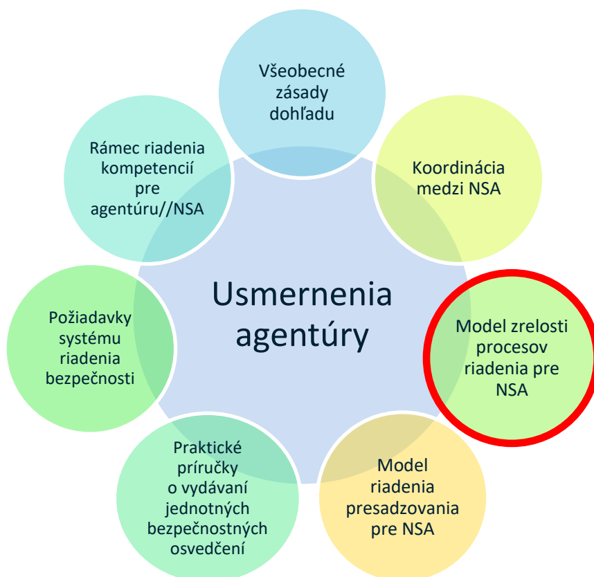
Obrázok 1: Súhrn usmernení agentúry

V modeli zrelosti procesov riadenia od agentúry sa používa rovnaká štruktúra ako v prílohe I a II k delegovanému nariadeniu Komisie (EÚ) .../... [spoločné bezpečnostné metódy systému riadenia bezpečnosti] na vytvorenie stanoviska ku kvalite SMS organizácie. Plní aj potrebu NSA týkajúcu sa nástroja, ktorý sa môže používať na splnenie požiadaviek stanovených v článku 7 ods. 1 delegovaného nariadenia Komisie (EÚ) .../... [spoločné bezpečnostné metódy pre dohľad] na hodnotenie účinnosti SMS a článku 5 ods. 2 uvedeného nariadenia na hodnotenie výkonnosti riadenia bezpečnosti železničného podniku alebo manažéra infraštruktúry. Cieľom prístupu nariadeného v článku 5 ods. 2 je vytvoriť silnú väzbu medzi posúdením a následným dohľadom, čím sa uľahčuje lepšia výmena informácií v rámci NSA a medzi NSA a agentúrou (t. j. medzi subjektmi vykonávajúcimi dohľad a subjektmi vykonávajúcimi posúdenie) a nakoniec, lepšie sa objasňuje železničnému sektoru, ako jeho vlastná výkonnosť v oblasti bezpečnosti tvorí vstup pre dohľad NSA (napr. určenie priorit činností dohľadu v oblastiach s najväčším rizikom pre bezpečnosť).