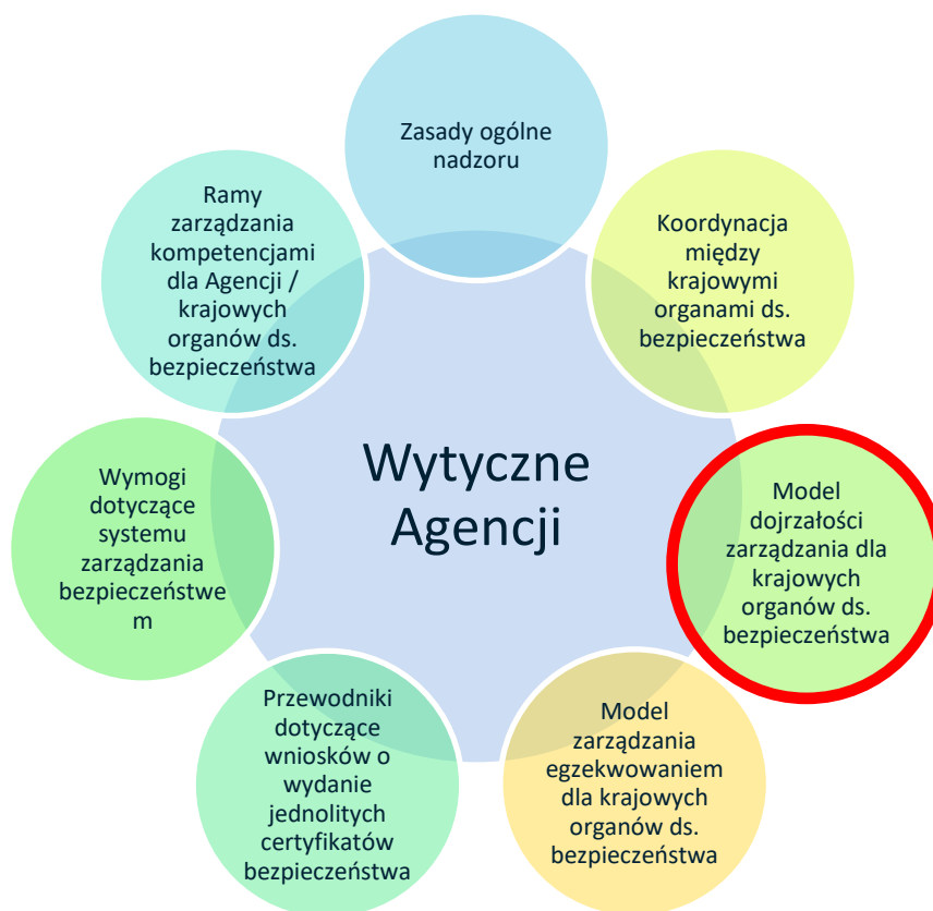
Rysunek 1: Kompendium wytycznych Agencji

W modelu dojrzałości zarządzania Agencji zastosowano tę samą strukturę, którą określono w załączniku I i II do rozporządzenia delegowanego Komisji (UE) .../... [CSM dotyczące systemów zarządzania bezpieczeństwem] w celu sformułowania oceny jakości systemu zarządzania bezpieczeństwem danej organizacji. Odpowiada on również zapotrzebowaniu krajowych organów bezpieczeństwa na narzędzie, które może zostać wykorzystane do spełnienia wymogów określonych w art. 7 ust. 1 rozporządzenia delegowanego Komisji (UE) .../... [CSM dotyczące nadzoru] w celu oceny skuteczności systemu zarządzania bezpieczeństwem oraz w art. 5 ust. 2 tego samego rozporządzenia w celu oceny działania systemu zarządzania bezpieczeństwem przedsiębiorstwa kolejowego lub zarządcy infrastruktury. Podejście przyjęte w art. 5 ust. 2 ma na celu stworzenie silnego związku między oceną a późniejszym nadzorem, ułatwia lepszą wymianę informacji między krajowymi organami ds. bezpieczeństwa oraz między krajowymi organami ds. bezpieczeństwa a Agencją (tj. między podmiotami sprawującymi nadzór a tymi, którzy przeprowadzają ocenę), oraz daje większą przejrzystość sektorowi kolejowemu umożliwiającą zrozumienie, w jaki sposób ich własne osiągnięcia w zakresie bezpieczeństwa wpływają na nadzór krajowego organu ds. bezpieczeństwa (np. priorytetowe traktowanie nadzoru nad obszarami największego ryzyka dla bezpieczeństwa).