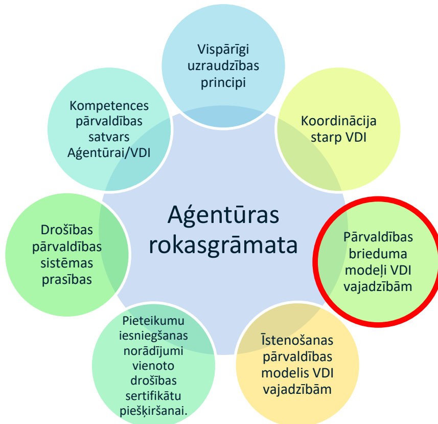
1. attēls. Aģentūras rokasgrāmatu krājums

Šis dokuments ir to Aģentūras rokasgrāmatu krājuma daļa, kas paredzētas dzelzceļa pārvadājumu uzņēmumu, infrastruktūras pārvaldītāju, valstu drošības iestāžu un Aģentūras atbalstam, veicot savus pienākumus un uzdevumus saskaņā ar Direktīvu (ES) 2016/798.