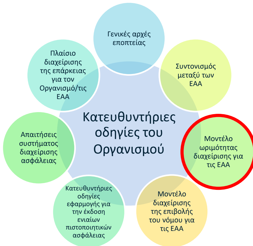
Διάγραμμα 1: Συλλογή κατευθυντήριων οδηγιών του Οργανισμού

Το Μοντέλο Ωριμότητας Διαχείρισης του Οργανισμού χρησιμοποιεί την ίδια δομή με το παράρτημα I και II του κατ' εξουσιοδότηση κανονισμού (ΕΕ) .../... της Επιτροπής [κοινές μέθοδοι ασφάλειας (ΚΜΑ) για ΣΔΑ] για την εκτίμηση της ποιότητας του ΣΔΑ ενός οργανισμού. Επιπλέον, καλύπτει την ανάγκη των ΕΑΑ για ένα εργαλείο το οποίο να μπορεί να χρησιμοποιηθεί για την εκπλήρωση των απαιτήσεων που ορίζονται στο άρθρο 7 παράγραφος 1 του κατ' εξουσιοδότηση κανονισμού (ΕΕ) .../... [ΚΜΑ για την εποπτεία] όσον αφορά την αξιολόγηση της αποτελεσματικότητας των ΣΔΑ, καθώς και στο άρθρο 5 παράγραφος 2 του ίδιου κανονισμού όσον αφορά την αξιολόγηση των επιδόσεων διαχείρισης της ασφάλειας της σιδηροδρομικής επιχείρησης ή του διαχειριστή υποδομής. Η προσέγγιση που θεσπίζεται στο άρθρο 5 παράγραφος 2 έχει στόχο τη δημιουργία ενός ισχυρού δεσμού μεταξύ της αξιολόγησης και της επακόλουθης εποπτείας, διευκολύνει την καλύτερη ανταλλαγή πληροφοριών εντός των ΕΑΑ και μεταξύ των ΕΑΑ και του Οργανισμού (δηλ. μεταξύ των φορέων που αναλαμβάνουν την εποπτεία και των φορέων που διενεργούν την αξιολόγηση) και, τέλος, εξασφαλίζει μεγαλύτερη διαφάνεια για τους παράγοντες του σιδηροδρομικού τομέα, ώστε να κατανοήσουν τον τρόπο με τον οποίο οι δικές τους επιδόσεις ασφάλειας αποτελούν τη βάση για την εποπτική δραστηριότητα των ΕΑΑ (π.χ. ιεράρχηση δραστηριοτήτων εποπτείας σε τομείς με μεγαλύτερο κίνδυνο για την ασφάλεια).