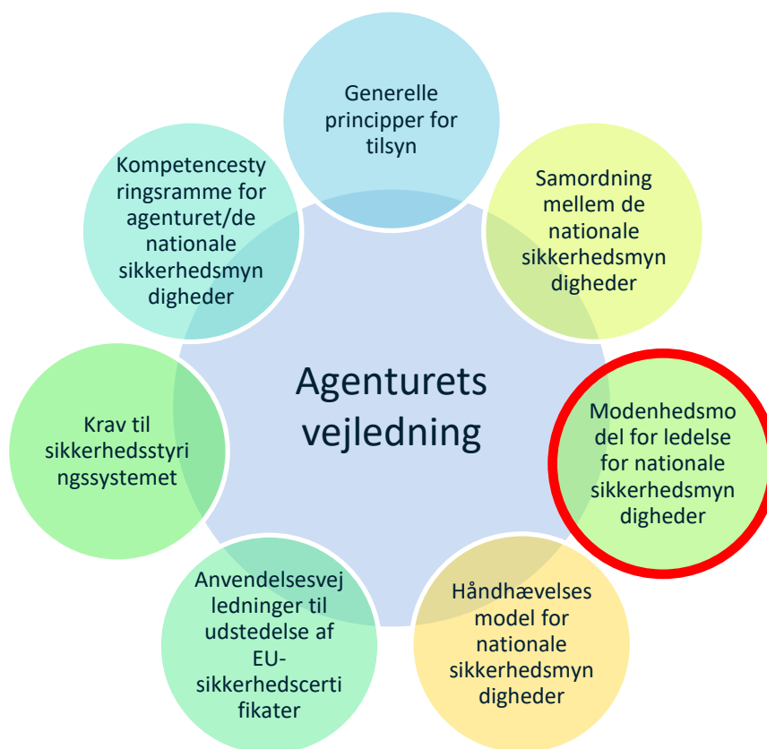
Figur 1: Alle agenturets vejledninger

Agenturets modenhedsstyringsmodel anvender samme struktur som bilag I og II til Kommissionens delegerede forordning (EU) .../... [ Sikkerhedsmetoder for sikkerhedsledelsessystem ] skal frembringe en bedømmelse af kvaliteten af en organisations sikkerhedsledelsessystem. Den opfylder også den nationale sikkerhedsmyndigheds behov for et værktøj, der kan bruges til at overholde kravene i artikel 7, stk. 1, i Kommissionens delegerede forordning (EU) .../... [ Fælles sikkerhedsmetoder for tilsyn ] til vurdering af effektiviteten af sikkerhedsledelsessystemet og i artikel 5, stk. 2 i samme forordning for sikkerhedsledelsens præstation i jernbanevirksomhed eller infrastrukturforvalter. Fremgangsmåden, der er fastsat i artikel 5, stk. 2 har til formål at skabe en stærk kobling mellem evaluering og efterfølgende tilsyn, fremmer en bedre informationsudveksling hos nationale sikkerhedsmyndigheder og mellem nationale sikkerhedsmyndigheder og agenturet (dvs. mellem de virksomheder, der foretager tilsyn og dem, der udfører evaluering) og bringer endelig mere klarhed for jernbanesektoren over, hvordan deres egen sikkerhedspræstation informerer den nationale sikkerhedsmyndigheds tilsyn (f.eks. prioritering af tilsynsaktiviteter i de områder, hvor der er størst risiko for sikkerheden).