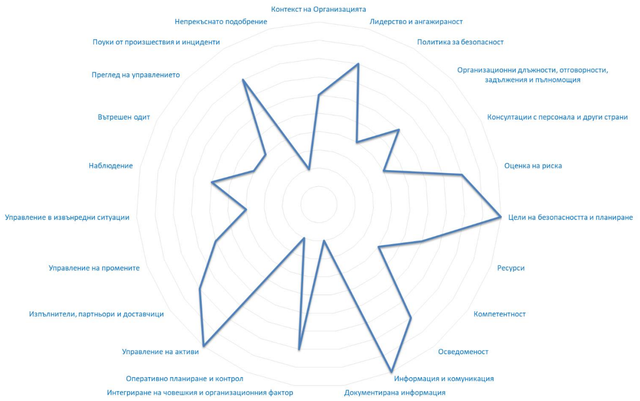
Фигура 2: Радарна диаграма – примерно представяне на резултатите от модела.