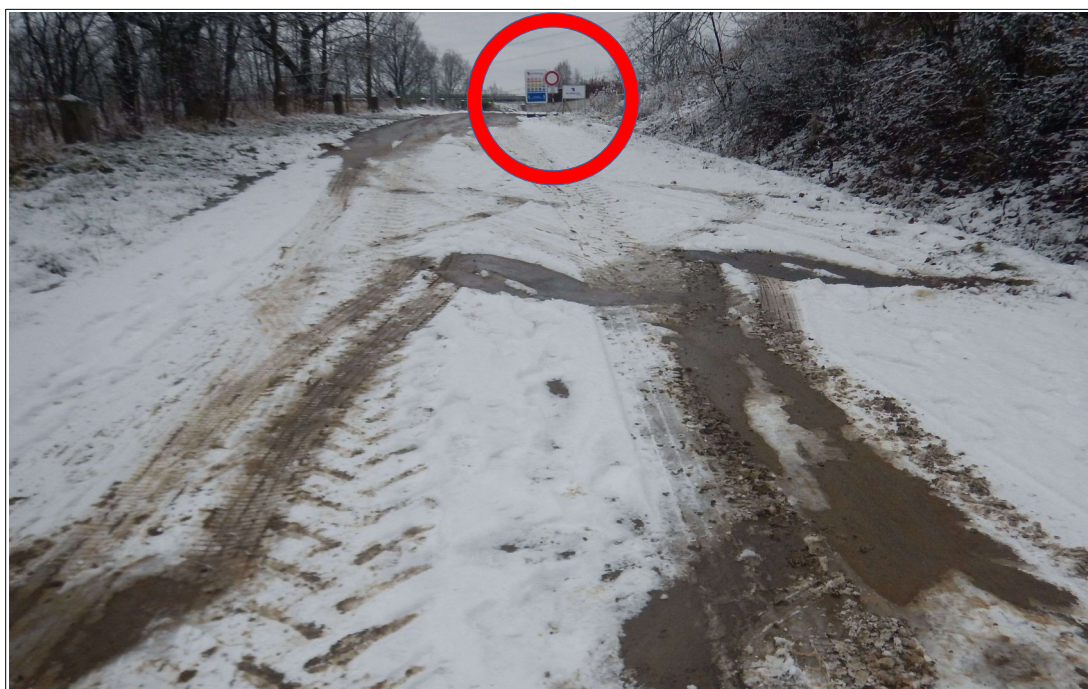
Obr. č. 11: Dopravní značka B1 „Zákaz vjezdu všech vozidel“