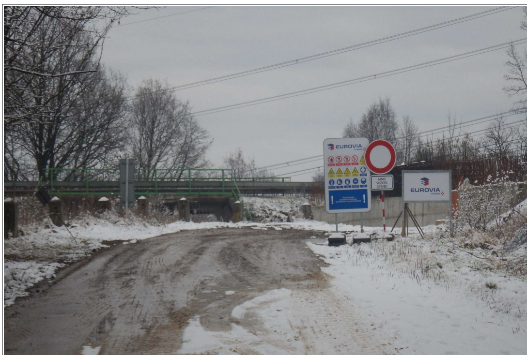
Obr. č. 4: Uzavření a přerušení pozemní komunikace III. tř. č. 00421a

naměřena 137 m a v opačném směru jízdy, tj. ve směru jízdy NA couváním zpět k ŽP, 105 m;