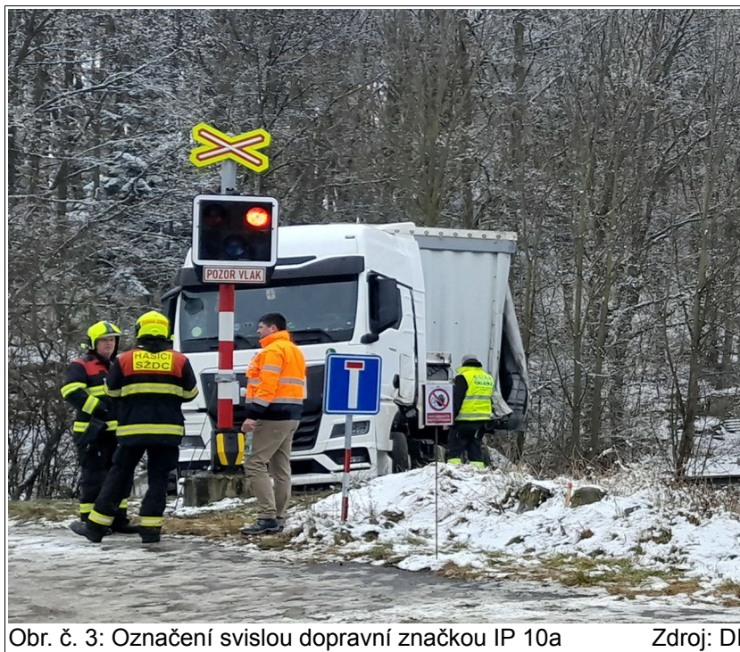
Obr. č. 3: Označení svislou dopravní značkou IP 10a