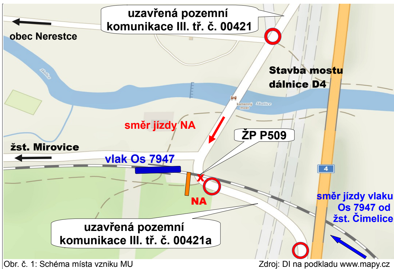
Obr. č. 1: Schéma místa vzniku MU