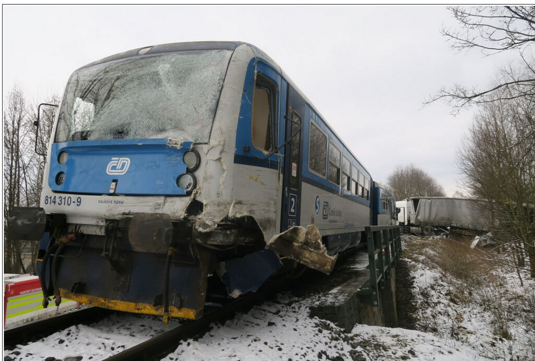
Obr. č. 2: Poškozené čelo vlaku Os 7947