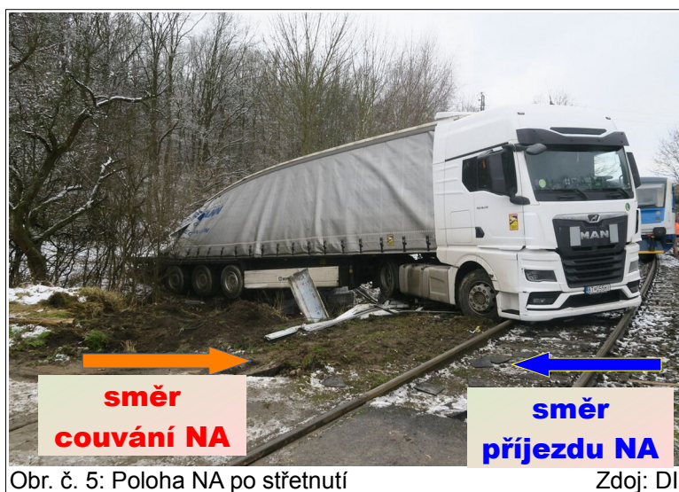
Obr. č. 5: Poloha NA po střetnutí