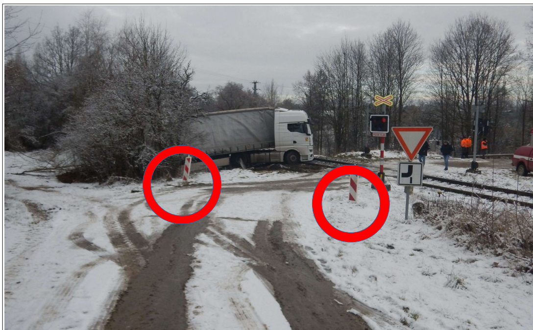
Obr. č. 10: Dopravní značení bezprostředně po vzniku MU

Uvedená zjištění nemohou být posuzována v příčinné souvislosti se vznikem MU, protože řidič NA byl ostatním dopravním značením upozorněn dostatečně včas před ŽP P509 o uzavírci pozemní komunikace.