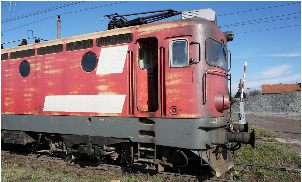
Слика 2.2.2.3: Изглед бочног дела локомотиве 441-510 са стране управљачнице „Б“

На чеоним странама локомотиве, налазе се два вертикална рукохвата (постављени су са сваке стране по један) и један хоризонтални рукохват (постављен је испод ветробранских стакала управљачнице и на крајевима је спојен са горњим деловима вертикалних рукохвата), чеона платформа испод које се налазе два чеона степеника (са сваке стране по један) и два степеника у облику узенгије, односно у облику латиничног слова „У“ (са сваке стране по један) причвршћена на дно сандука локомотиве. Изглед чеоне стране локомотиве 441-510 са стране управљачнице „Б“ је приказан на слици 2.2.2.4. (изглед чеоне стране локомотиве са стране управљачнице „А“ је идентичан).