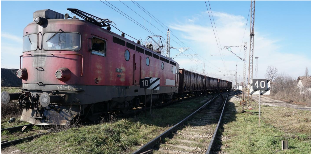
Слика 2.2.2.6: Изглед сигналног знака 97в: „Почетак лагане возње“ на блоку 2 станице Мала Крсна (посматрано од стране станица Осипаоница и Пожаревац ка станици Мала Крсна)

Увиђајем на лицу места озбиљне несреће, истражитељски тим ЦИНС је констатовао да је лагана возња у станици Мала Крсна сигналисана на блоку 2 посматрано од стране станица Осипаоница и Пожаревац ка станици Мала Крсна. Лагана возња од 10 km/h је сигналисана сигналним знаком 97в: „Почетак лагане возње“, тако да се односи на 1, 2, 3. и 4. колосек што је и у телеграму број 88 од 11.12.2020. године требало да буде наведено. Изглед сигналног знака 97в: „Почетак лагане возње“ приказан је на слици 2.2.2.6.