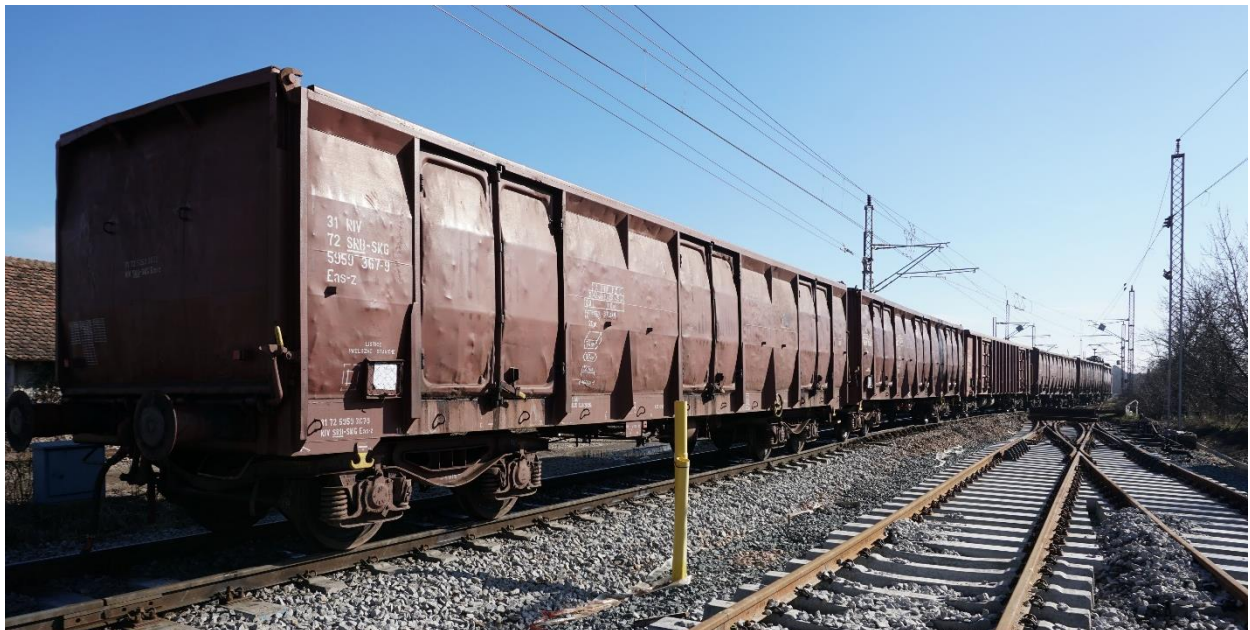
Слика 2.1.2.2: Изглед места где се маневарски састав зауставио на скретничком блоку 2 након озбиљне несреће (поглед из смера станице Мала Крсна према отвореној прузи у смеру ка станицама Пожаревац и Осипаоница)

Изглед места где се маневарски састав зауставио на скретничком блоку 2 након озбиљне несреће приказан је на слици 2.1.2.2.