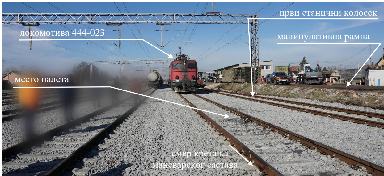
Слика 2.1.2.1: Изглед места озбиљне несреће после налета маневарског састава на железничког радника (поглед из смера скретничког блока 2 ка станичној згради)

Изглед места где се маневарски састав зауставио на скретничком блоку 2 након озбиљне несреће приказан је на слици 2.1.2.2.