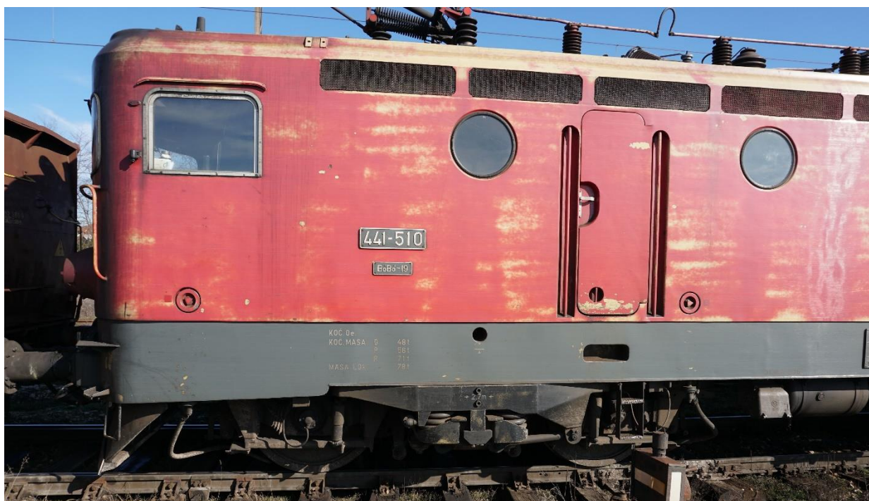
Слика 2.2.2.2: Изглед бочног дела локомотиве 441-510 са стране управљачнице „А“

На локомотиви 441-510 постоје две управљачнице (управљачнице „А“ и „Б“) смештене чеоно на оба краја локомотиве. На бочним странама локомотиве постоје по двоје врата (једна врата за улаз у управљачницу и једна врата за улаз у машински простор). Са обе стране свих врата се налазе рукохвати смештени у удубљеном простору оплате сандука локомотиве. Испод врата за улаз у управљачницу се на сандуку локомотиве налазе два удубљења и два степеника постављена испод сандука локомотиве, а испод врата за улаз у машински простор једно удубљење у сандуку локомотиве и два степеника постављена испод сандука локомотиве. У обе управљачнице, позиција машиновође се налази на супротној страни од врата за улазак у управљачницу. Изглед врата на бочној страни локомотиве 441-510, приказан је на сликама 2.2.2.2. и 2.2.2.3.