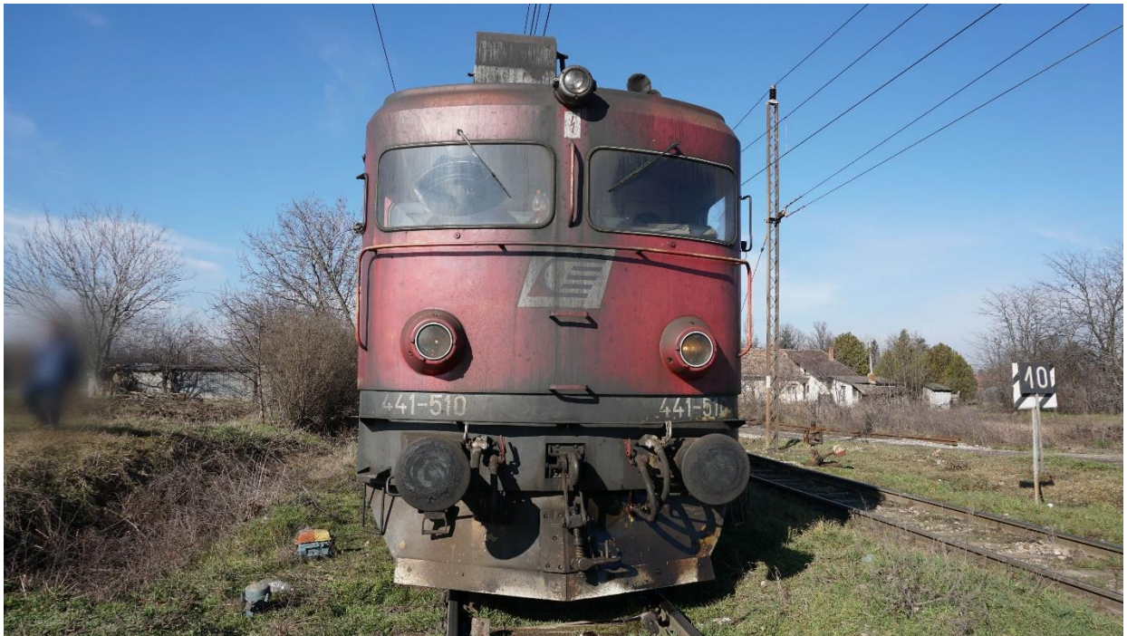
Слика 2.2.2.4: Изглед чеоног дела локомотиве 441-510 са стране управљачнице „Б“.

Кола серије Eas-z и Eanoss су четвороосовинска теретна кола отвореног типа и намењена су за превоз растреситог и комадног терета. Могу да се користе у унутрашњем и међународном железничком саобраћају на колосеку ширине 1435 mm.