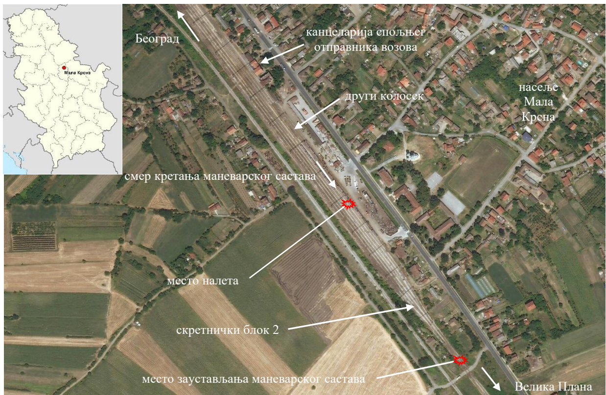
Слика 2.1.1.1: Сателитски снимак подручја места озбиљне несреће

Изглед подручја места озбиљне несреће у станици Мала Крсна снимљен из сателита приказан је на слици број 2.1.1.1.