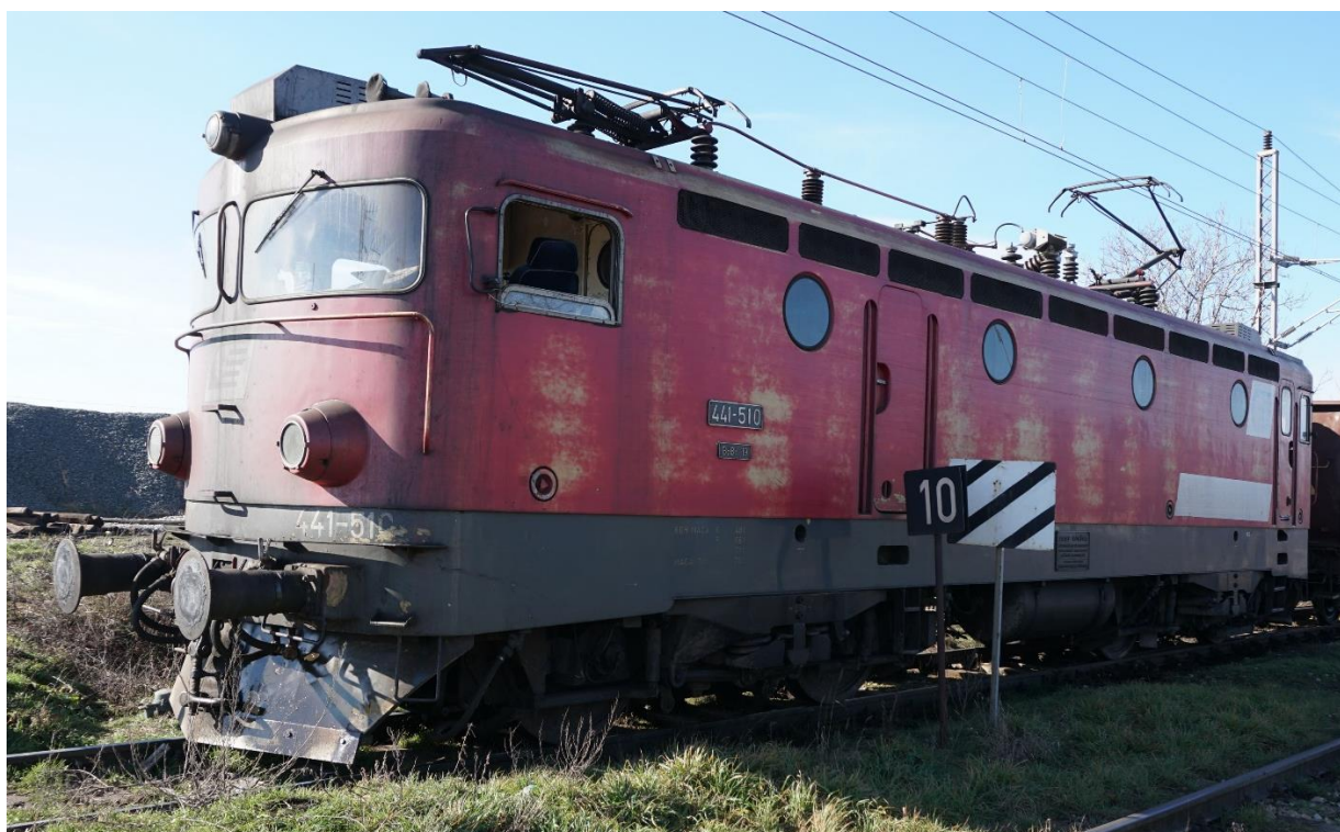
Слика 2.2.2.1: Изглед локомотиве 441-510

Изглед локомотиве 441-510 приказан је на слици 2.2.2.1.