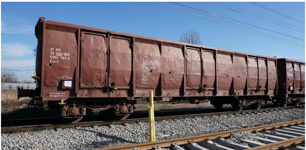
Слика 2.2.2.5: Изглед кола Eas-z

Изглед кола Eas-z приказан је на слици 2.2.2.5.