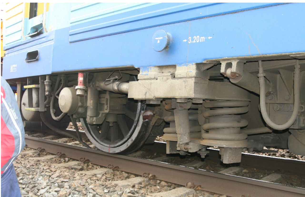
Foto 3: Lom obruče HDV 362.161-2