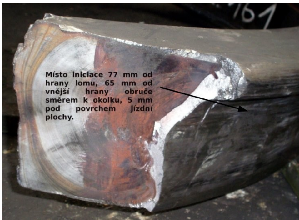
Obr. č. 6: Místo iniciace lomu.

Technický stav HDV byl v příčinné souvislosti se vznikem MU.