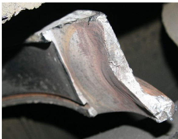
Obr. č. 5: Lom obruče - druhá část lomu.

Na základě těchto zjištění byla Dopravní fakulta Jana Pernera Univerzity Pardubice požádána o provedení podrobné analýzy lomové plochy s cílem určit místo iniciace únavové trhliny a příčiny jejího vzniku, včetně posouzení případného vlivu jakosti materiálu na vznik výše uvedené trhliny.