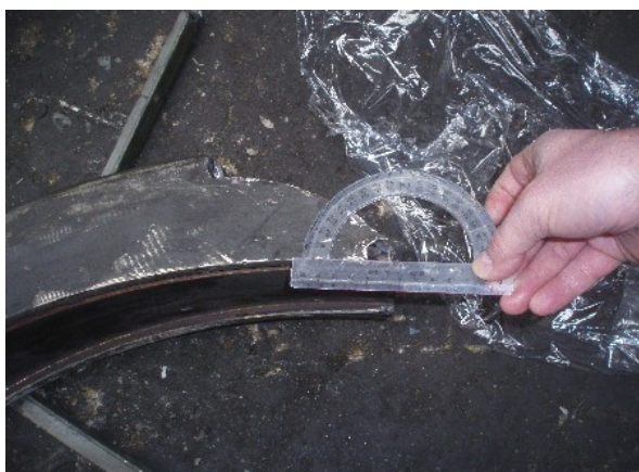
Obr. č. 2 : Úhel postupu únavového lomu.

Na základě těchto zjištění bylo dopravcem rozhodnuto požádat Univerzitu Pardubice, Dopravní fakultu o provedení analýzy lomové plochy s cílem určení místa iniciace únavové trhliny a příčiny jejího vzniku, včetně případného vlivu jakosti materiálu na vznik výše uvedené trhliny.