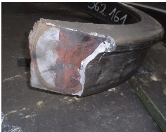
Obr. č. 4: Lom obruče - první část lomu.