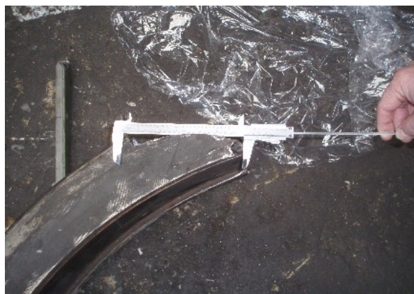
Obr. č. 3: Délka únavového lomu.