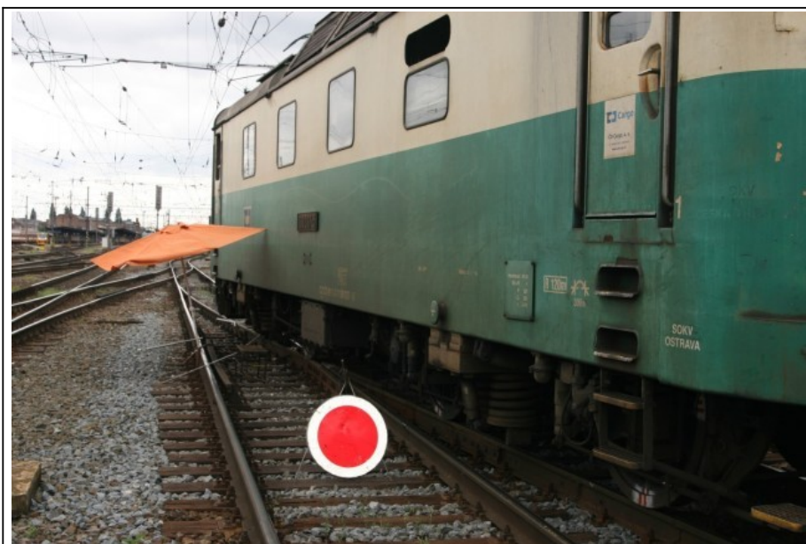
Obr. č. 1: Pohled na místo MU

Ke vzniku MU došlo dne 11. 07. 2011 v 08:49 h na dráze železniční, kategorie celostátní, Přerov – Česká Třebová (trať 309A), elektrifikované stejnosměrným napětím 3 kV, v žst. Olomouc hl. n., obvod osobní nádraží, ve výhybce č. 89, v km 86,515.