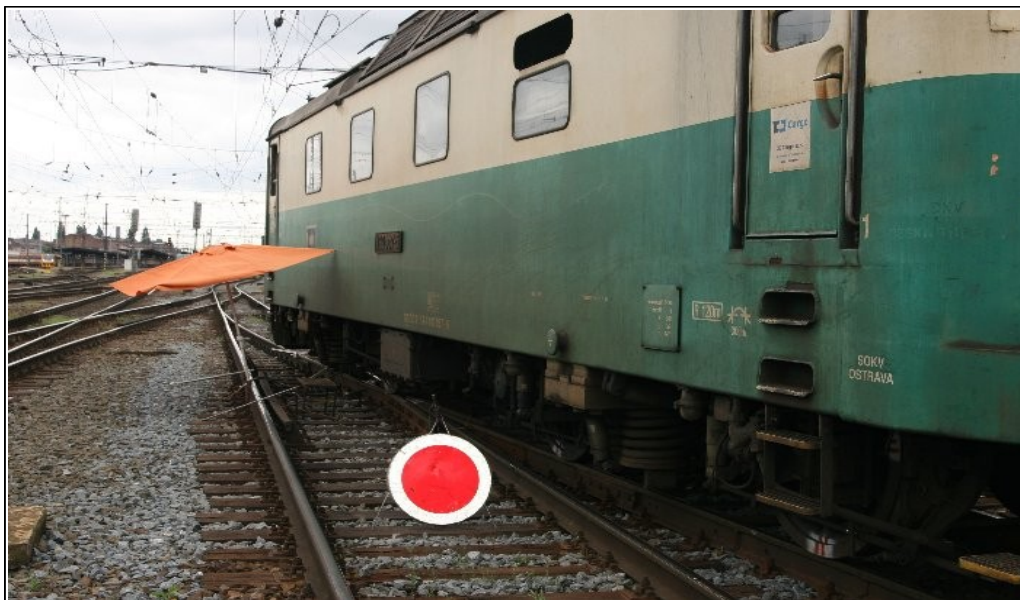
Foto 1: Krytí vyloučeného místa, výhybky č. 89, ve směru ze staniční koleje č. 51a