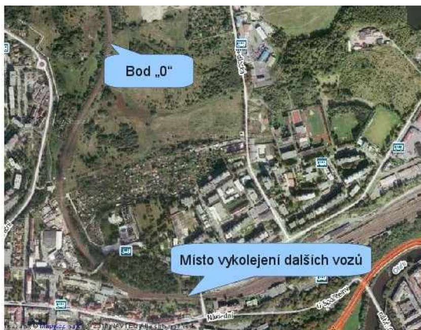
Obr. č. 2: Schéma místa MU