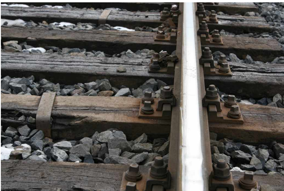
Obr. č. 3: Pohled na „bod nula“ a poškozená upevňovadla