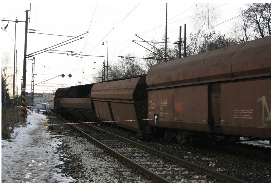
Obr. č. 1: Pohled na místo MU