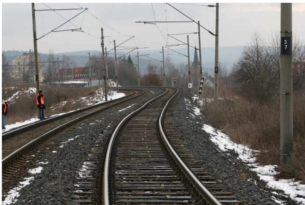
Obr. č. 4: Pohled na 1.TK v bodě nula - viditelná nerovnost koleje