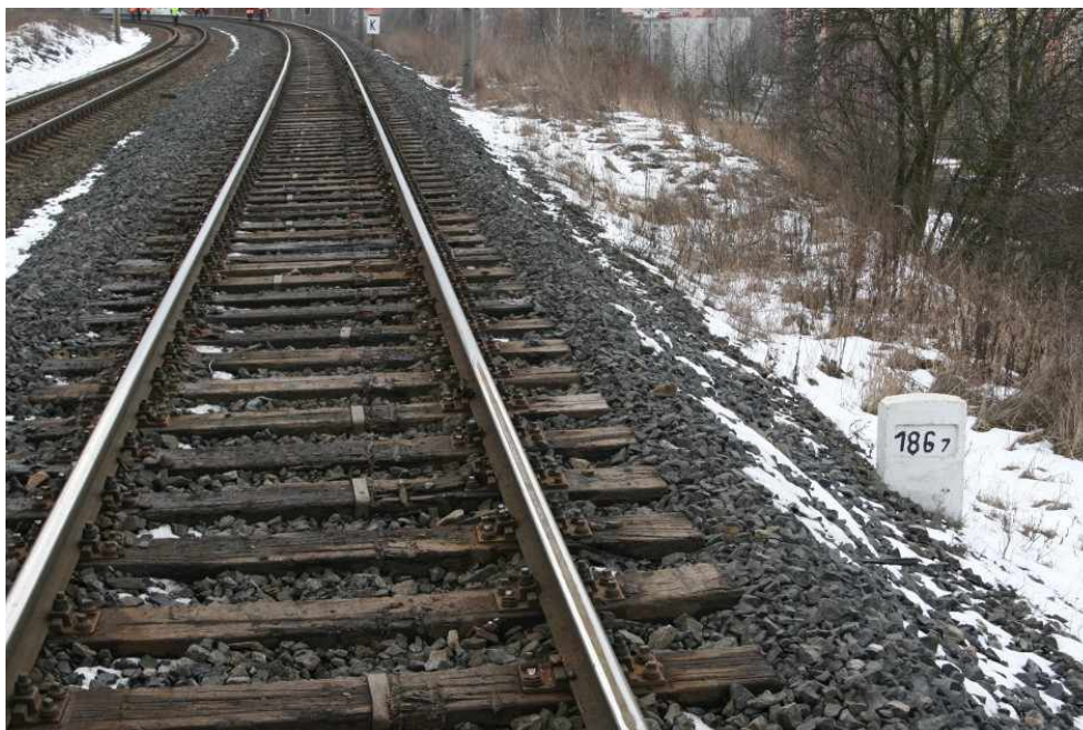
Obr. č. 5: Stopy po okolcích dvojkolí na pražcích