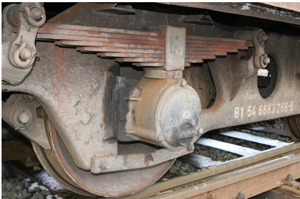
Obr. č. 7: Chybějící brzdové zdrže a stopy po vykolejení na voze Falls 81 54 6683 266-5