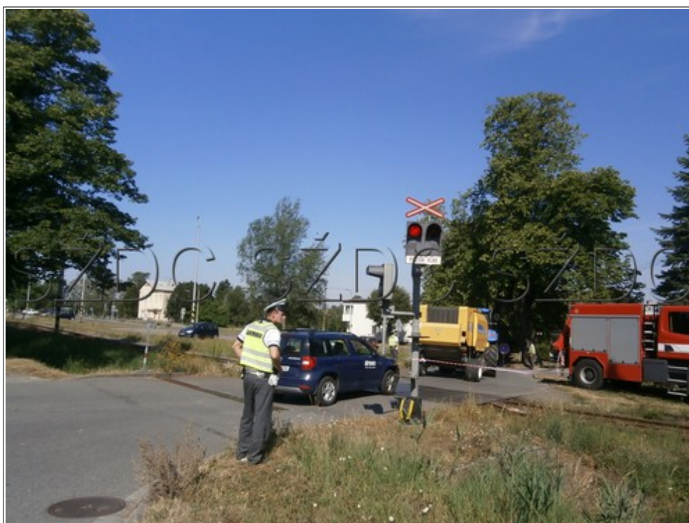
Obr. č. 4: Pohled na výstražné kříže a světelné skříně výstražníků ŽP P7272 ze směru jízdy na MU zúčastněného SMV z ulice Za Drahou.