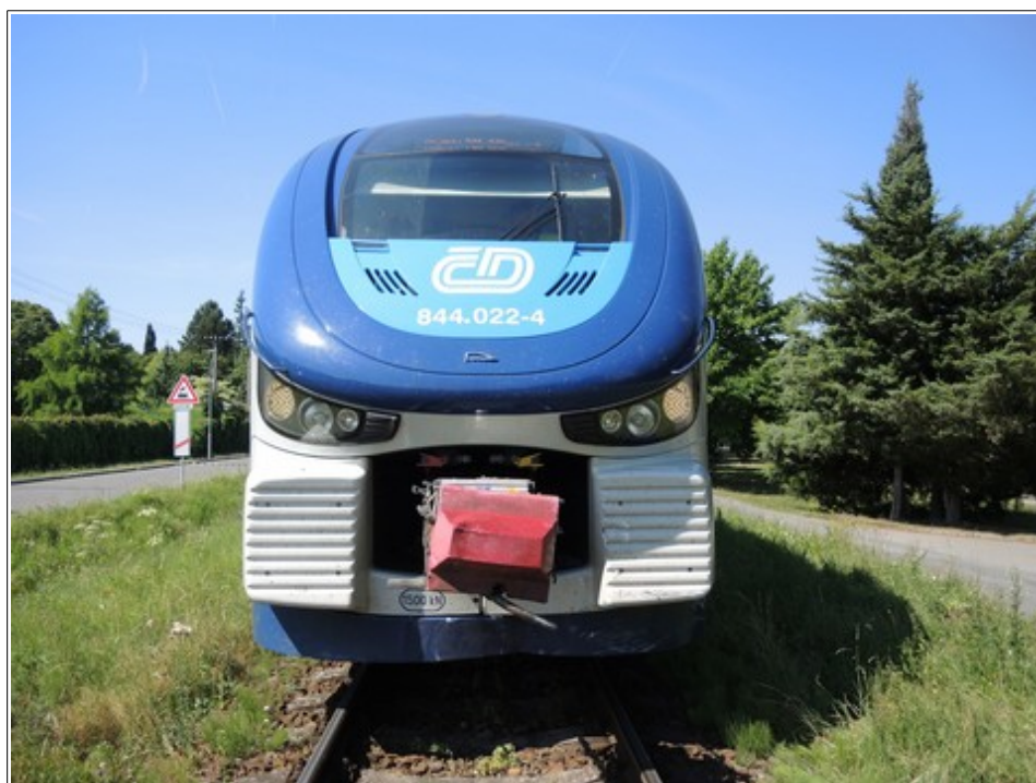
Obr. č. 1: Pohled na čelo vlaku po vzniku MU

GPS: 49°23'38.21984" N, 17°40'05.97768" E.