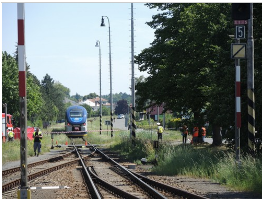
Obr. č. 3: Pohled na ŽP P7272 a konec vlaku Os 3905 po vzniku MU ze SK č. 1 žst. Bystřice pod Hostýnem.