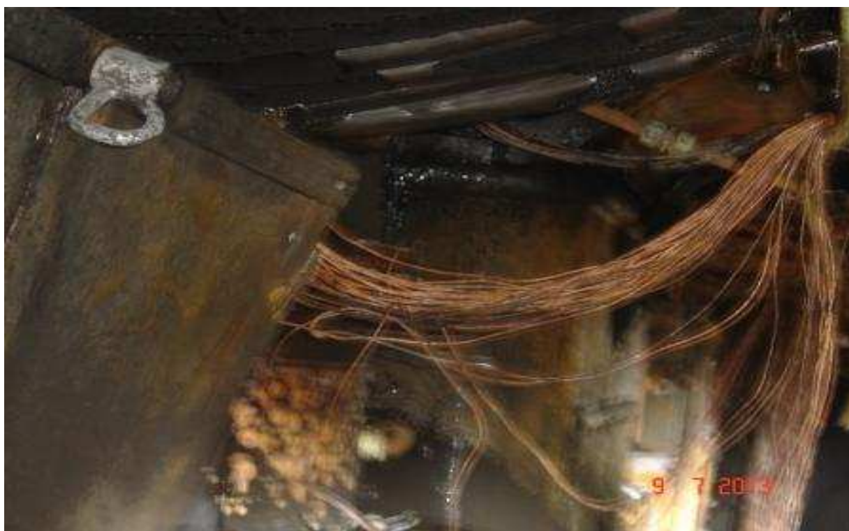
fig. 9 sala mașinilor culoar stânga