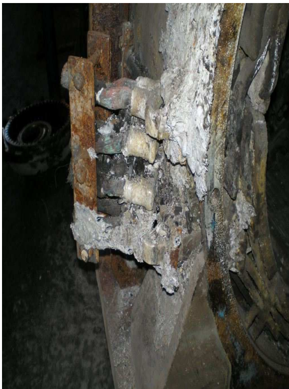
fig. 6 MT3 Cabluri