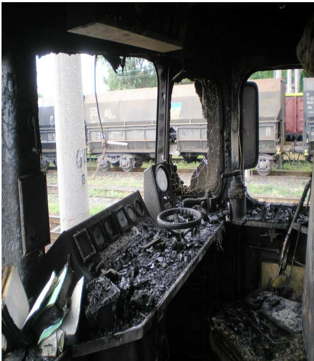
Fig.1. Postul de conducere nr. I