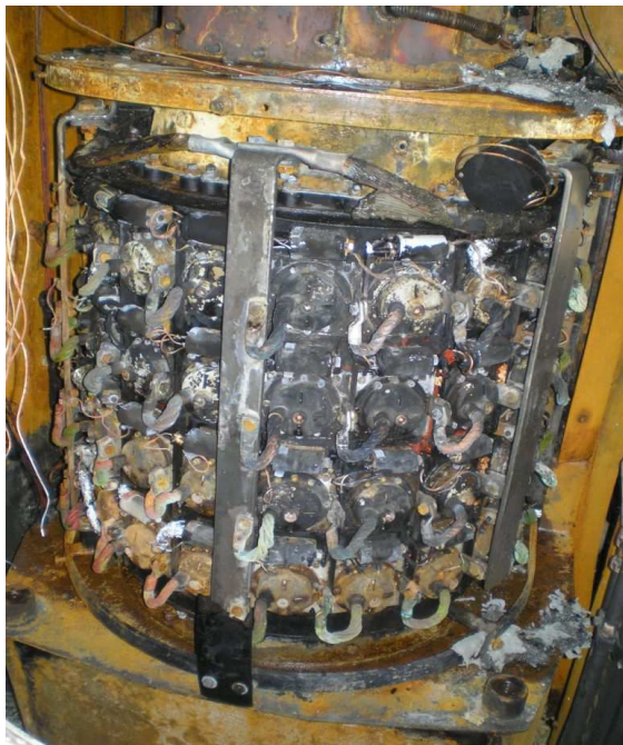
Fig.2. Redresor bloc