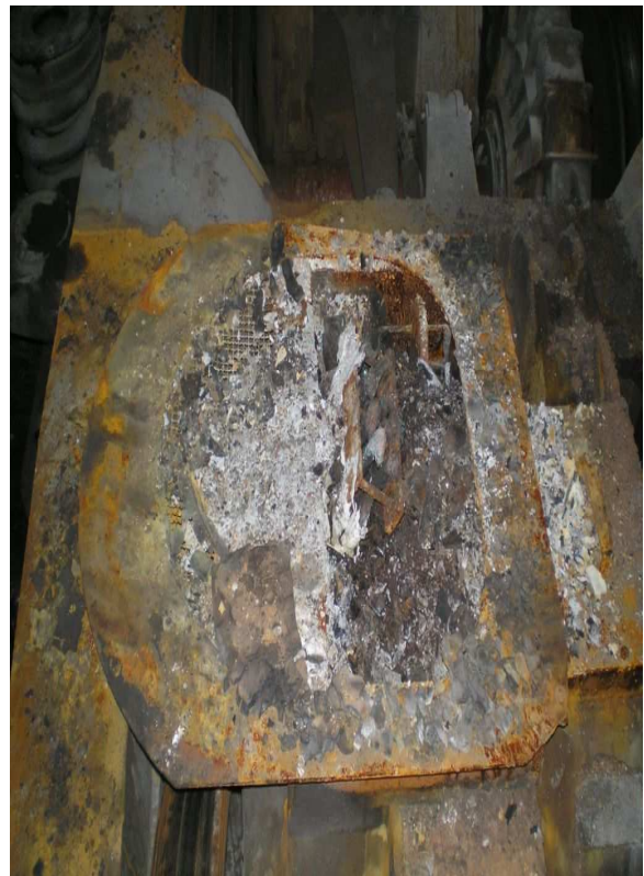
fig. 5 MT 3