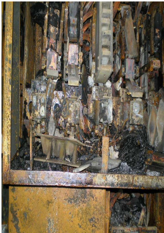
fig. 4 Blocul S3 contactori de linie și frânare