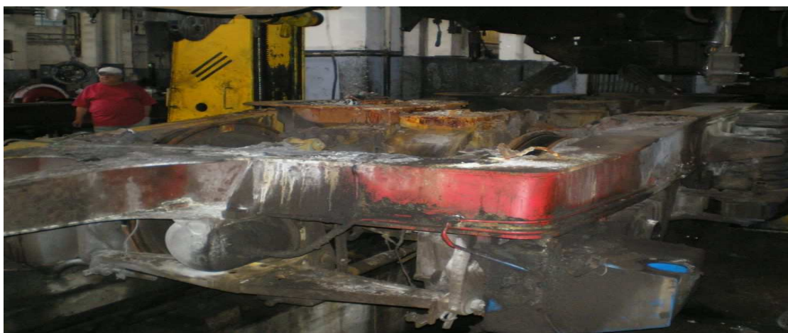
fig. 10 Boghiul nr. 1