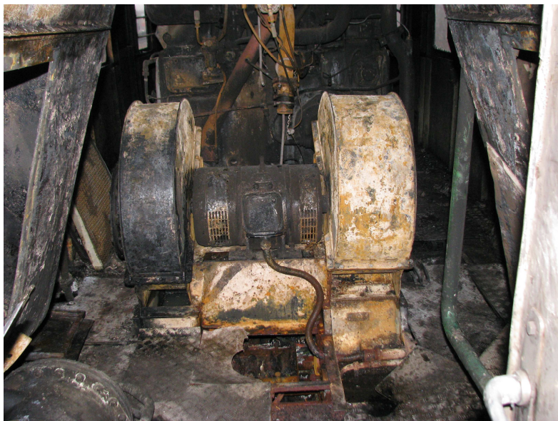
Imaginea 3 – avarii la interiorul locomotivei

Nu au fost avariate elemente ale infrastructurii ferovare.