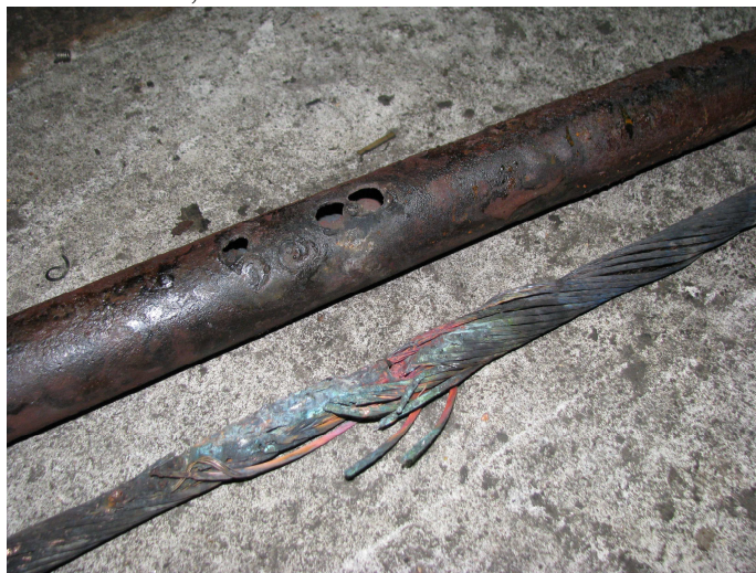
Imaginea 5 – țeava de protecție din oțel găurită și cablul electric topit;