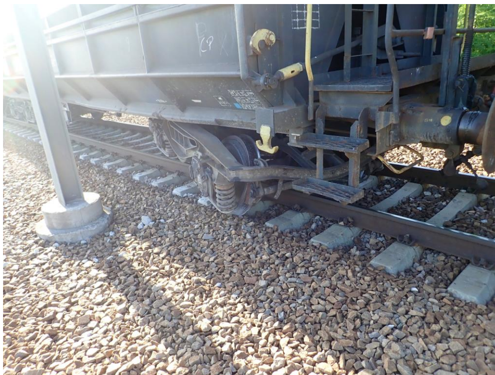
Fotografia nr. 1 – vagonul deraiat pe linia III din stația Valu lui Traian

Vagonul a circulat deraiat pe o distanță de aproximativ 600 metri.