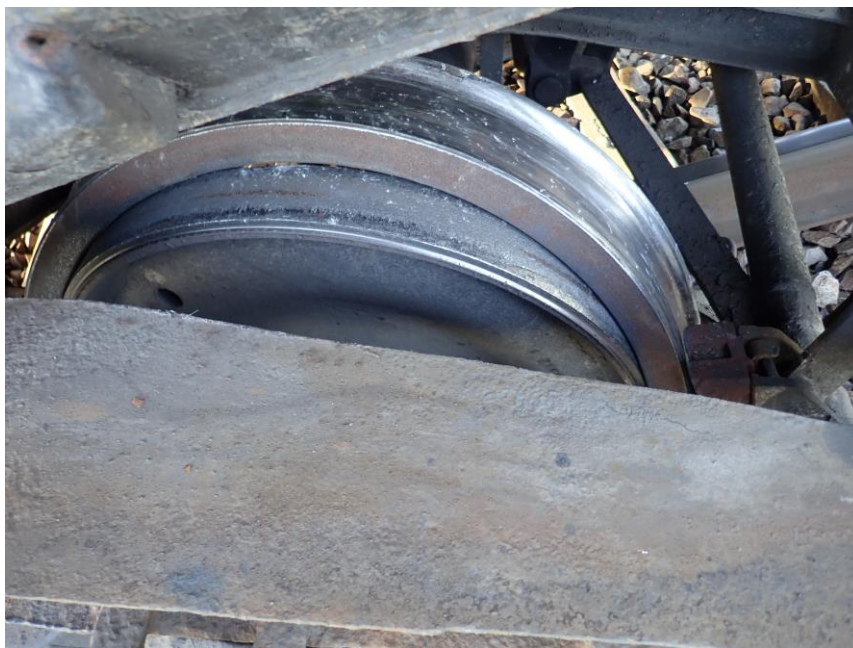
Fotografia nr.1: 23.05.2018 – stația Valu lui Traian roata nr.1, care a produs deraierea

Vagonul a fost îndrumat la stația Palas pentru înlocuirea osiei montate, ocazie cu care s-au făcut măsurători și verificări amănunțite, la data de 06.06.2018, constatându-se următoarele: