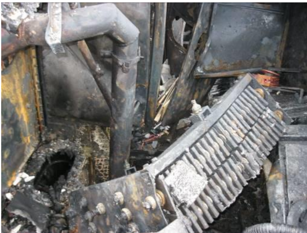
Foto nr.3 - zona TP rezistențele de trecere