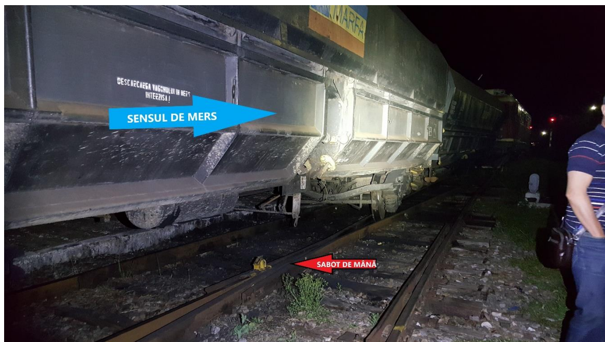
Imaginea 2 - sabotul de mână, înțepenit la inima de încrucișare

Trenul s-a oprit după deraierea primelor 2 vagoane, ca urmare a măsurilor de frânare luate de mecanicul de locomotivă.