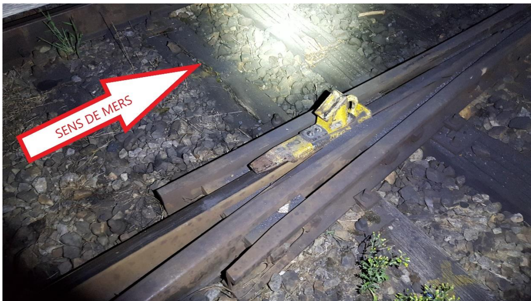
Imaginea 4 – locul producerii deraierii - poziția sabotului pe schimbătorul nr. 46

Sabotul de mână a fost târât de roata primului vagon pe o distanță de aproximativ 80 m până când sabotul de mână s-a înțepenit la inima de încrucișare a schimbătorului nr. 46. După ce sabotul de mână s-a înțepenit la inima de încrucișare, primul vagon a parcurs 18m deraiat până la oprirea trenului.