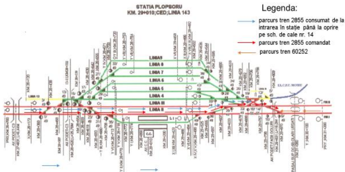
fig.2 – schița stației Ploșoru