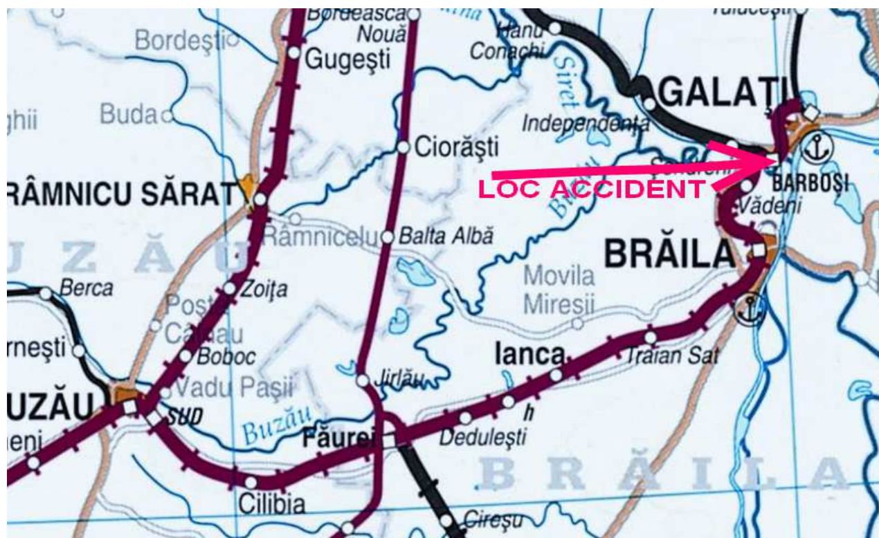
fig.1 - amplasarea locului accidentului

La data de 03.02.2014, trenul de marfă nr.89543 aparținând operatorului de transport feroviar SC GFR SA a fost format în stația CF Barboși Port din 36 de vagoane goale seria R și E, având destinația stația CFU Mălina.