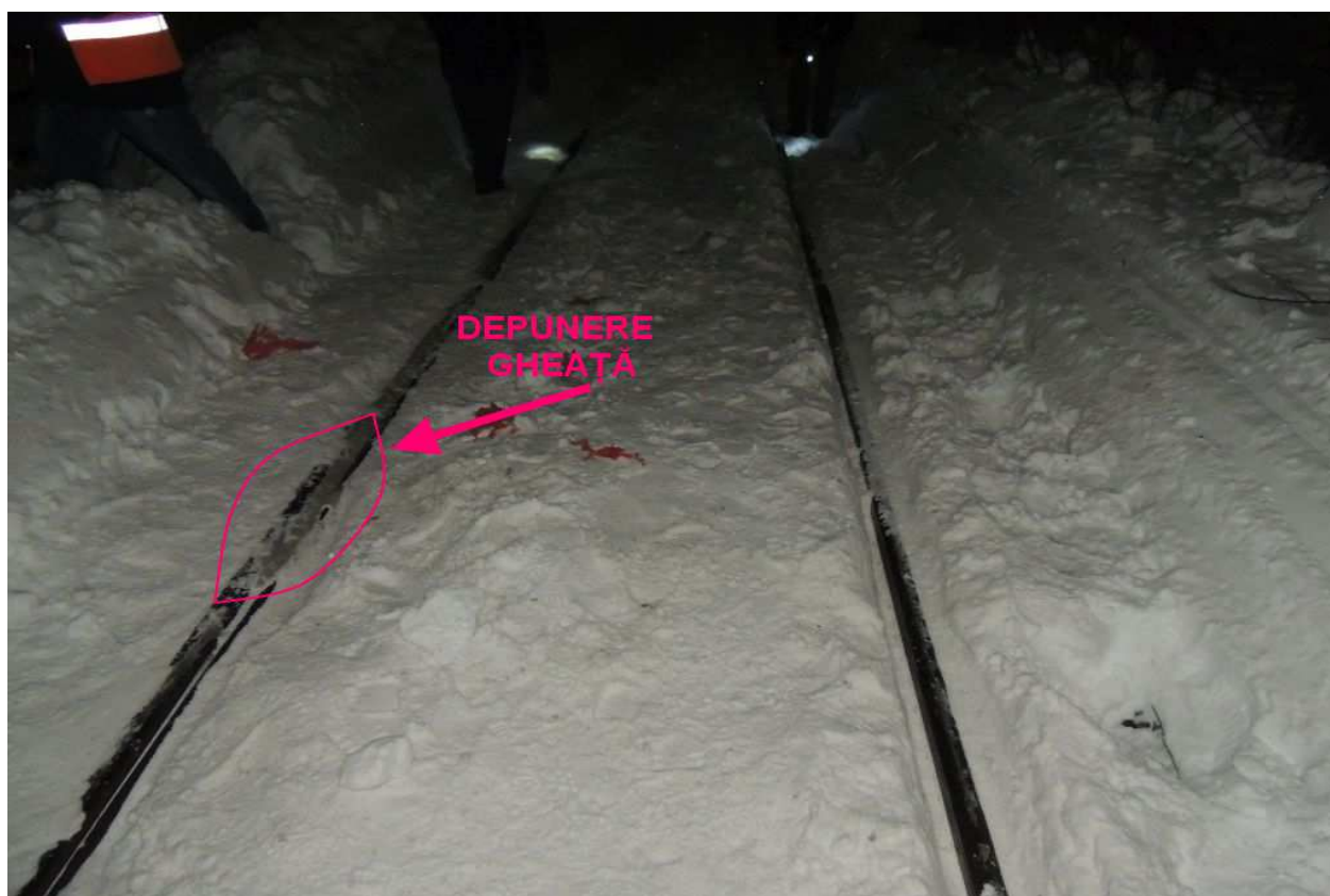
foto.3 - fotografie cu depunerea de gheață