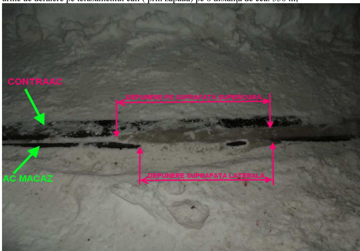
foto.4 - detaliu cu depunerea de gheață