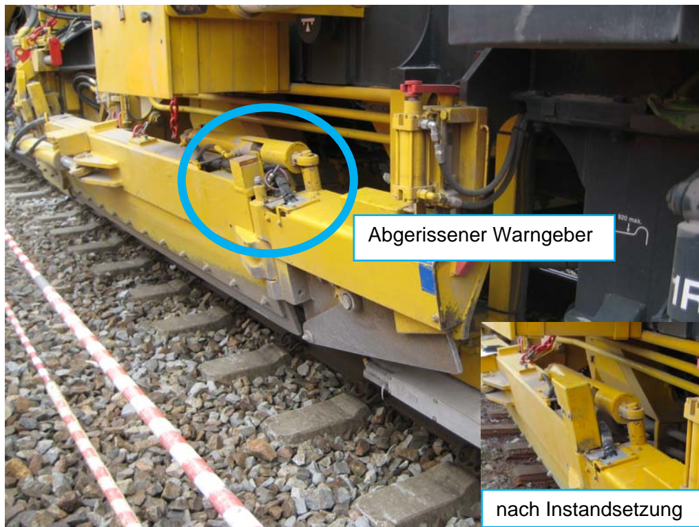
Abb. 8: Warngerber am rechten Flankenpflug der Schotterplaniermaschine 9980 9125 006-3

Anhand der dokumentierten Spuren lässt sich rekonstruieren, dass der auf dem rechten Flankenpflug der Schotterplaniermaschine 9980 9125 006-3 montierte Warngerber mit der linken Trittstufe und dem Taktgeber der zweiten Achse der Lok 9180 6183 002-5 in Berührung gekommen ist. Die Trittstufe wurde dadurch im Bereich zwischen unterer und oberer Stufe längs der Fahrzeugachse nach hinten verschoben, die Stufenwangen wurden dabei sichtbar verbogen. Am Taktgeber blieben Farbspuren an der Gehäusekante zurück. Am Flankenpflug wurde der Warngerber von seiner Halterung abgetrennt.