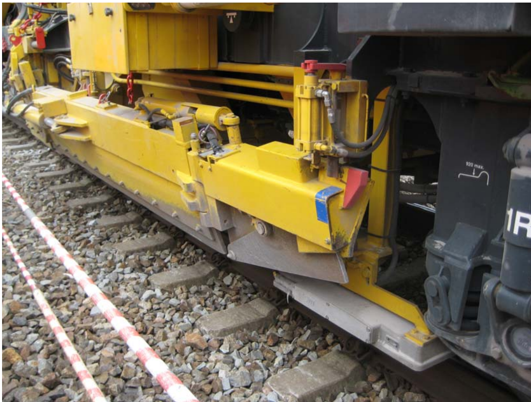
Abb. 1: Aufnahmen der beteiligten Fahrzeuge