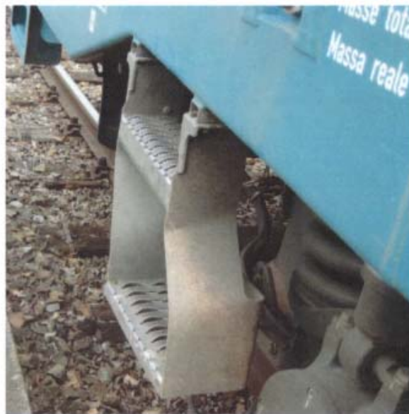
Abb. 6: verbogene Trittstufe im Detail