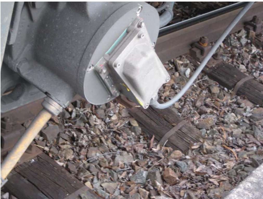
Abb. 7: Farbspuren am Taktgeber