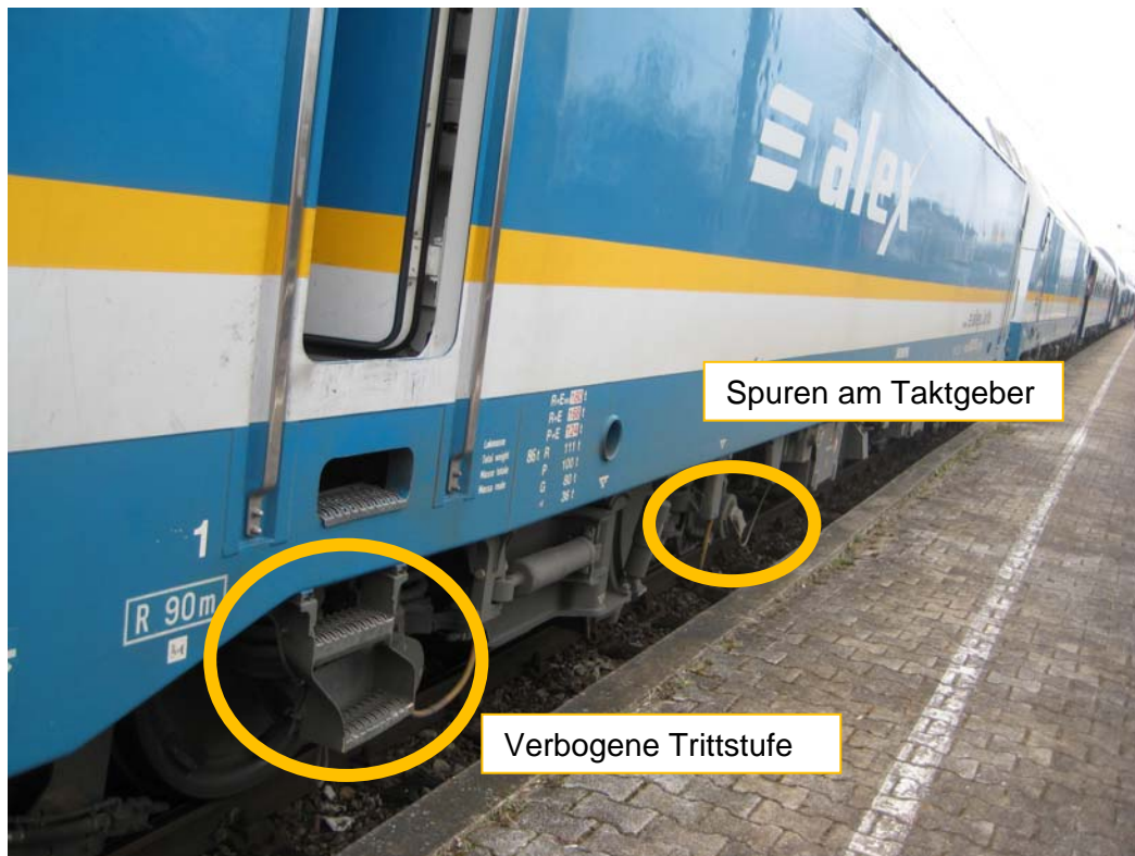
Abb. 5: Lok 9180 6183 002-5 mit Markierung der Schadensspuren

Aufgrund der ausgebliebenen Sofortmeldung des Ereignisses war eine zeitnahe Untersuchung der beteiligten Fahrzeuge durch die EUB nicht möglich. Zur Rekonstruktion wurden die vom Nmg der DB Netz AG und dem Notdienst der Länderbahn gemachten Fotos ausgewertet.