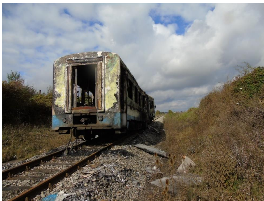
Slika 1. Opožarena dizel motorna garnitura serije 7121 na mjestu zaustavljanja

Dana 16. listopada 2020. godine u 21:10 sati prilikom prometovanja putničkog vlaka broj 6016 po pruzi oznake R202 u KM 072+600 nedaleko kolodvora Našice došlo je do požara na dizel motornoj garnituri serije 7121-101 (Slika 1.). U trenutku nastanka požara u vlaku je bio određeni broj putnika i vlakopravnog osoblja, nitko od navedenih nije ozlijeđen, dok je dizel motorna garnitura u potpunosti izgorjela.