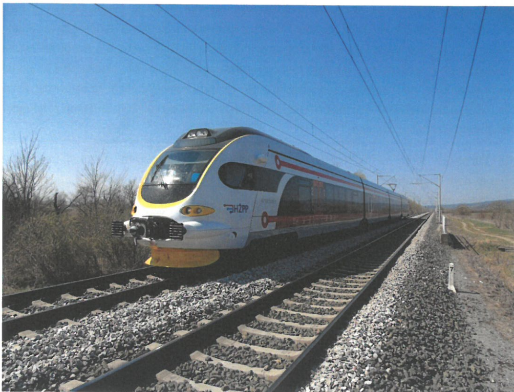
Slika 1. – EMV 94 78 6112 013-9 na mjestu nesreće

Dana 28. ožujka 2022. godine u 10:31 sati na pruzi oznake M104 u KM 294+100, između kolodvora Novska – Okučani, došlo je do naleta putničkog vlaka broj 2011 (Slika 1.) na radnika tvrtke HŽ Infrastruktura d.o.o., koji je uslijed naleta smrtno stradao. Vlak broj 2011 prometovao je na relaciji Zagreb Glavni kolodvor – Vinkovci, a čuvar pruge – ophodar se kretao lijevim kolosijekom ususret vlaku broj 2011 obavljajući pregled lijevog kolosijeka na dionici Okučani - stajalište Rajić.