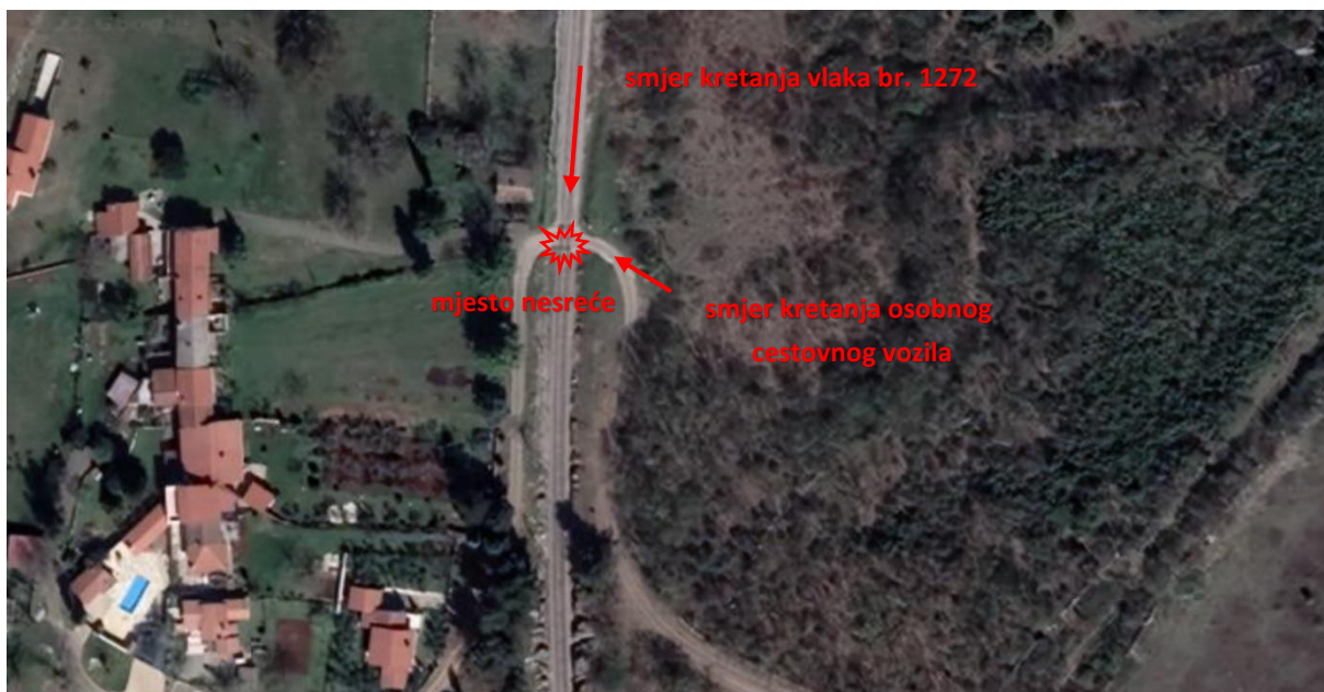
Slika 2. – Mjesto nesreće

U nesreći je smrtno stradao vozač koji je upravljao osobnim cestovnim vozilom. U osobnom cestovnom vozilu nije bilo drugih putnika.