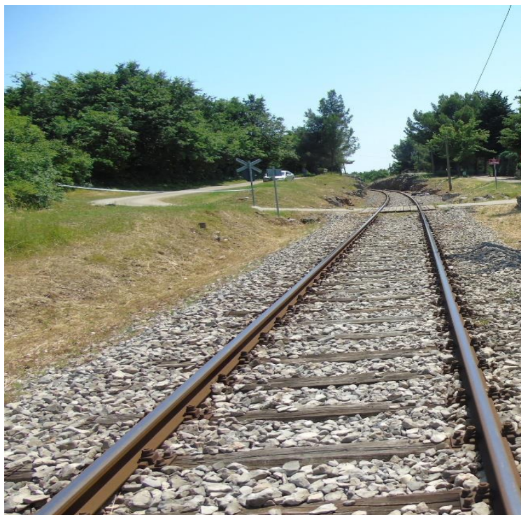
Slika 1. – ŽCP „Stancija Grgur“

U navedenoj ozbiljnoj nesreći smrtno je stradao vozač osobnog cestovnog vozila te je zabilježena veća materijalna šteta na osobnom cestovnom vozilu i manja materijalna šteta na putničkoj garnituri.