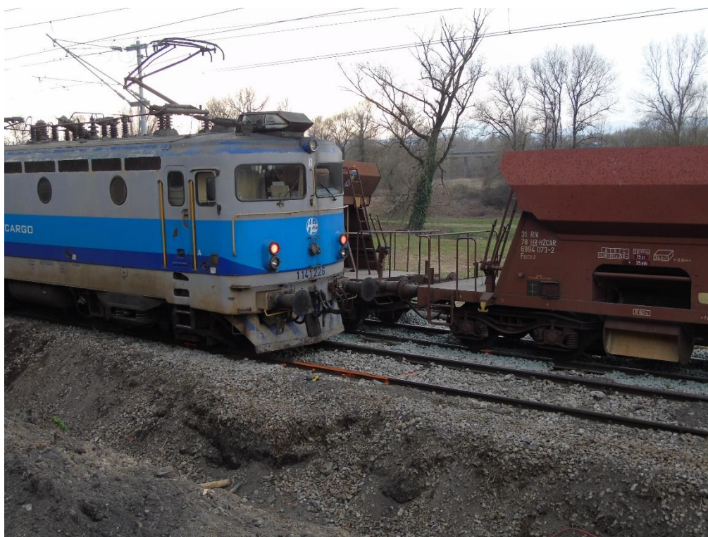
Slika 1. Opći snimak nesreće

U navedenoj nesreći smrtno je stradao pružni radnik koji je obavljao poslove pružnog poslovođe.