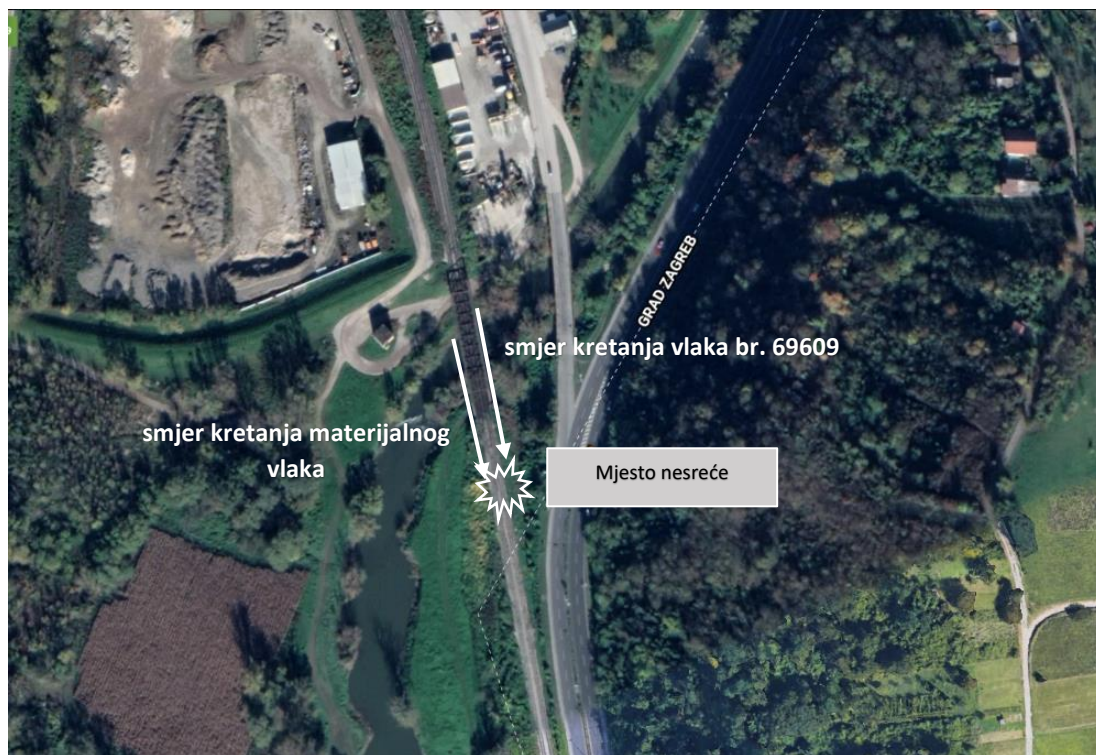
Slika 2. – Lokacija nesreće