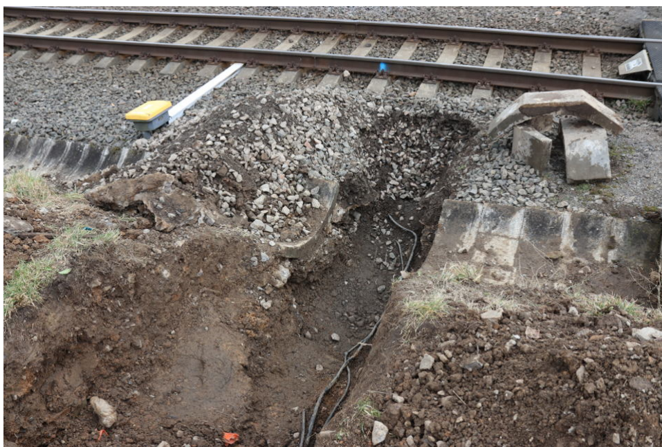
Obr. č. 1: Pohled na místo MU