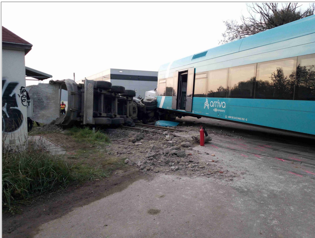
Obr. č. 2: Pohled na vykolejené KŘV-B 948.702-6 vlaku Os 14342 zaklíněné do převráceného tahače NA.