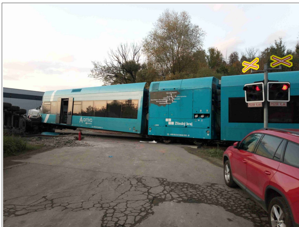
Obr. č. 5: Pohled na vykolejené DV vlaku Os 14342 v konečném postavení po MU.