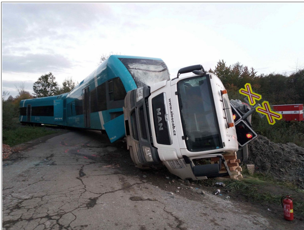
Zdroj: Drážní inspekce

Vznik události: 11. 10. 2022, 14:50 h. Popis události: střetnutí vlaku Os 14342 se silničním motorovým vozidlem – nákladním automobilem s následným vykolejením. Dráha, místo: dráha železniční, kategorie regionální, Rožnov pod Radhoštěm – Valašské Meziříčí, v úseku mezi dopravnou D3 Střítež nad Bečvou a železniční stanicí Valašské Meziříčí, železniční přejezd P7414 v km 3,779. Zúčastnění: Správa železnic, státní organizace (provozovatel dráhy); ARRIVA vlaky, s. r. o. (dopravce vlaku Os 14342); řidič nákladního automobilu. Následky: 6 zraněných osob; celková škoda 19 548 932 Kč.