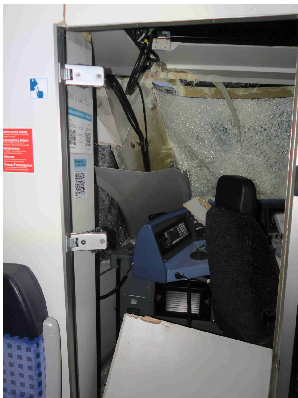
Obr. č. 6: Pohled do kabiny strojvedoucího z oddílu pro cestující skrze rozbité dveře kabiny strojvedoucího KRV-B 948.702-6.