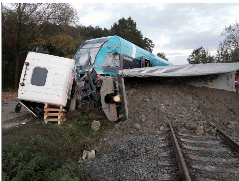
Obr. č. 4: Pohled na převrácený NA s vysypaným nákladem a se zaklíněným KŘV-B 948.702-6 vlaku Os 14342 v konečném postavení po MU.