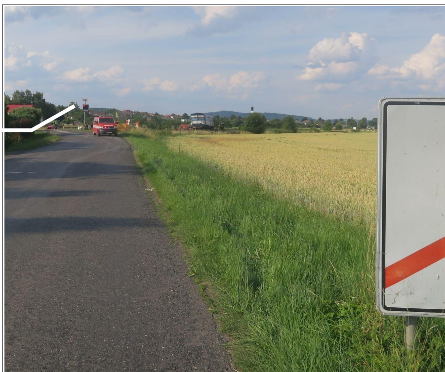
Obr. č. 2: Viditelnost výstrahy PZZ ze vzdálenosti 80 m