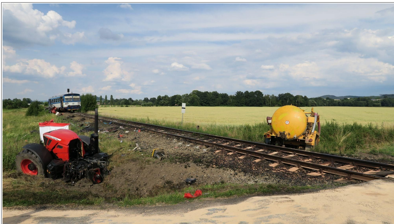
Obr. č. 3: Celkový pohled na trosky silniční soupravy