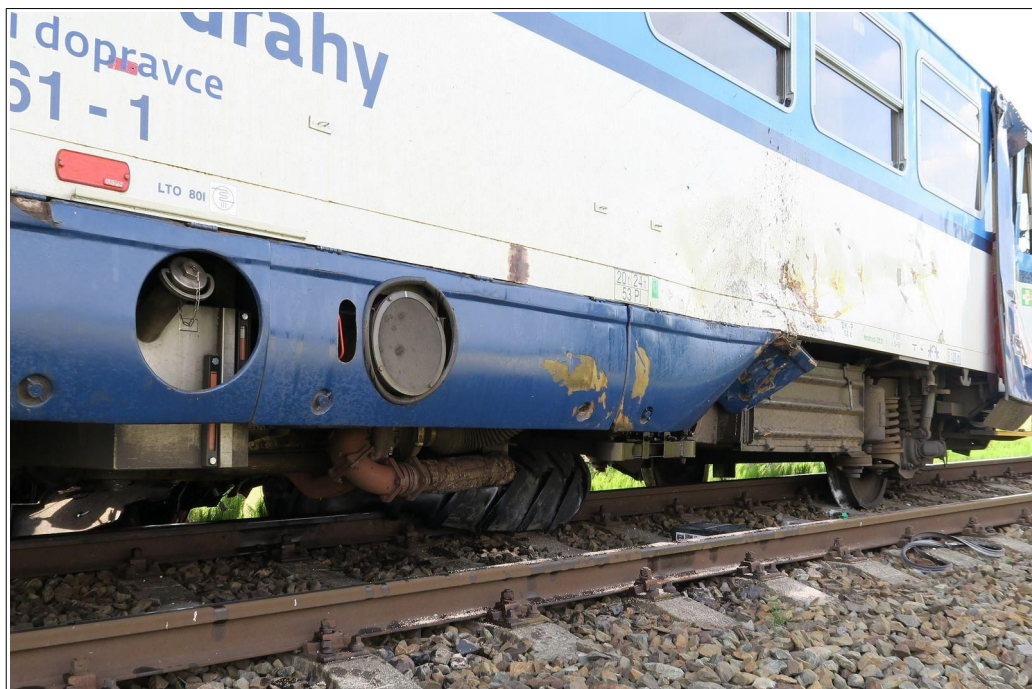
Obr. č. 4: Zaklíněné kolo traktoru pod HDV vlaku Os 17555