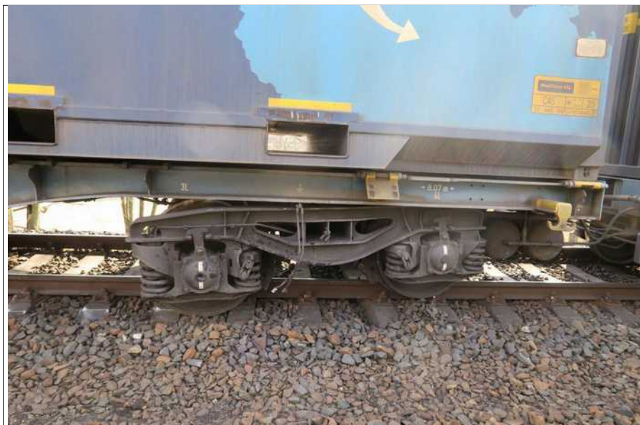
Obr. č. 5: Pohled na vykolejené TDV