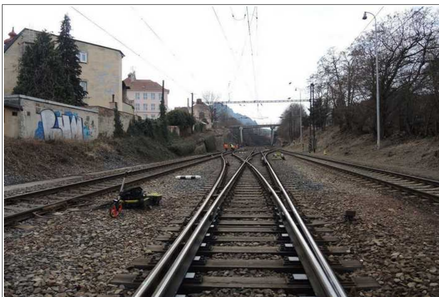
Obr. č. 2: Pohled na výhybky č. 35 a 37