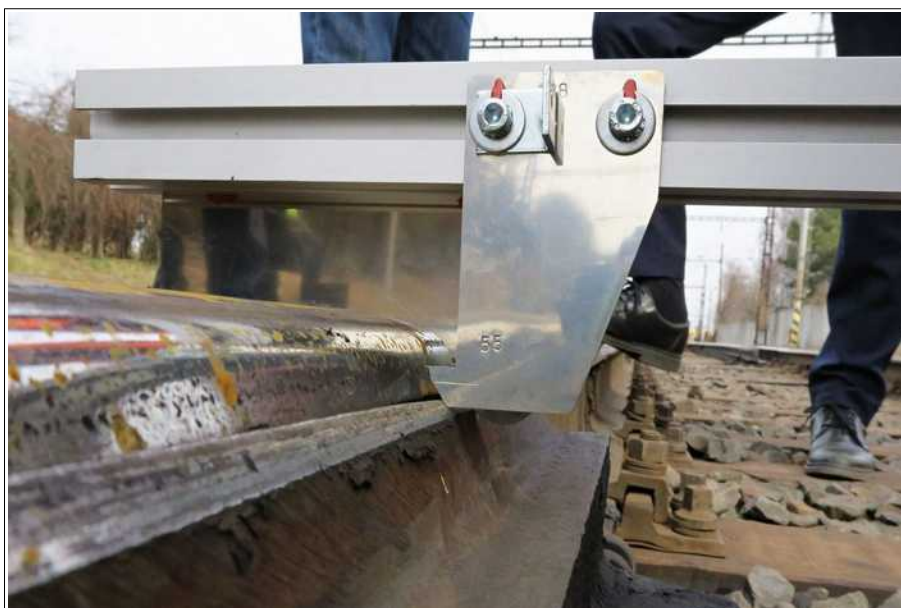
Obr. č. 3: Měření výhybky č. 35 šablonou „55°“