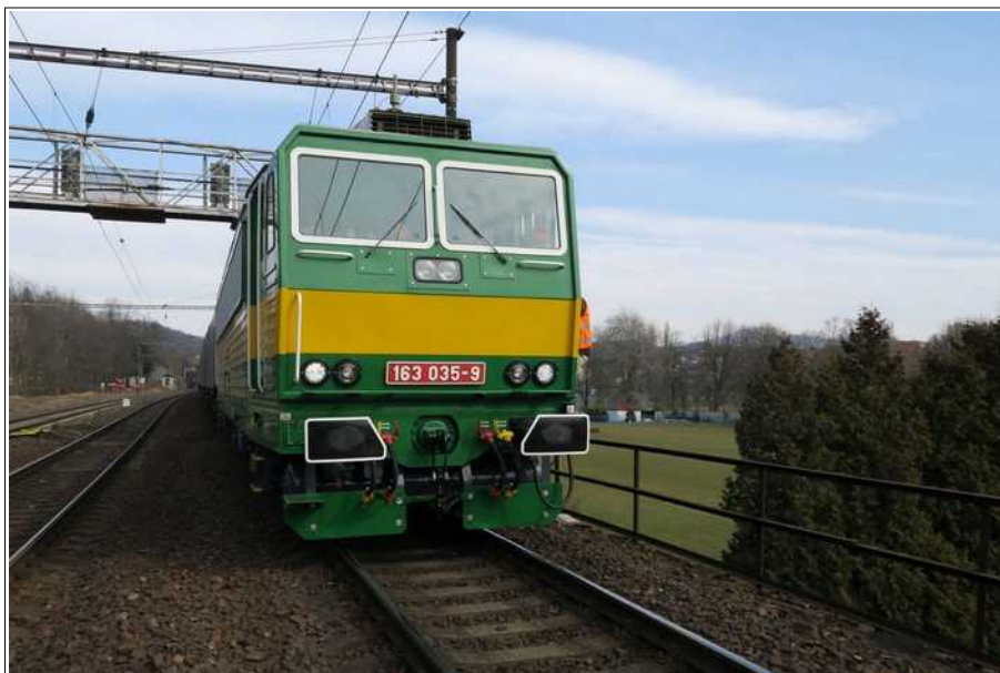
Obr. č. 4: Místo zastavení čela vlaku Nex 53030 v km 35,851