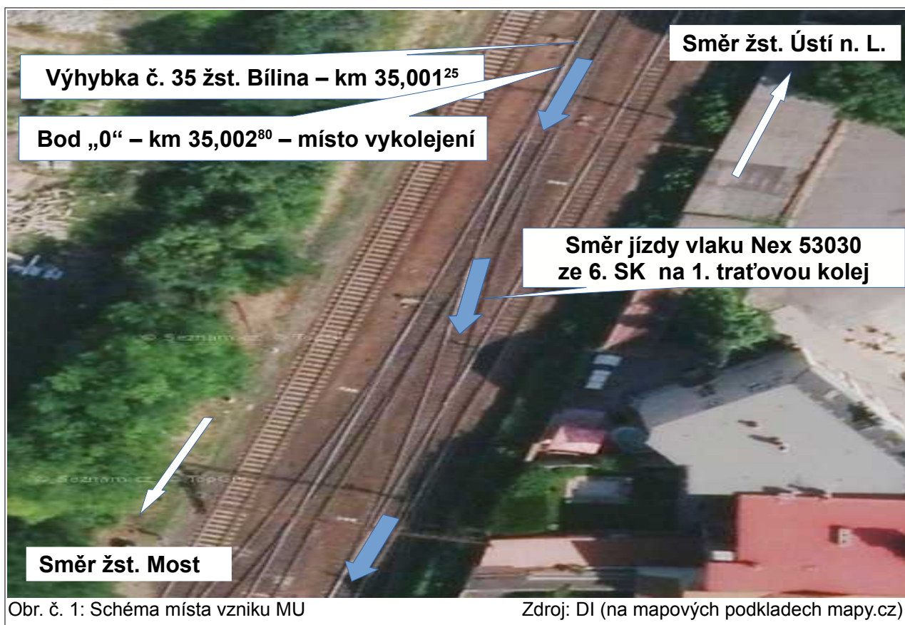
Obr. č. 1: Schéma místa vzniku MU

Žst. Bílina je obsazena výpravčím, leží na dráze železniční, celostátní, v km 34,514 dvojkolejně trati Ústí nad Labem hl. n. os. n. – Chomutov a je stanicí odbočnou pro dvojkolejnou trať Ústí nad Labem západ – Bílina. V úseku žst. Bílina – odbočka České Zlatníky je trať trojkolejná. Výhybka č. 35 se nachází v km 35,001 a je přestavována z ústředního stanoviště výpravčím. V žst. Bílina je SZZ 3. kategorie – reléové zabezpečovací zařízení. Trojkolejný prostorový oddíl žst. Bílina – odbočka České Zlatníky je vybaven TZZ 3. kategorie – obousměrným tříznakovým automatickým blokem AB3/74. Dvojkolejný mezistaniční úsek žst. Bílina – žst. Světec je vybaven obousměrným TZZ 3. kategorie – AH 88A automatické hradlo. Dvojkolejný mezistaniční úsek žst. Bílina – žst. Oldřichov u Duchcova je vybaven TZZ 3. kategorie – obousměrným tříznakovým automatickým blokem elektronickým ABE-1. Pro samostatné hlášení a potvrzování předvídaného odjezdu a hlášení skutečného odjezdu používá výpravčí aplikaci EDD. Volnost vlakové cesty při správné činnosti RZZ zjišťuje výpravčí pohledem na indikační prvky ovládacího stolu RZZ.