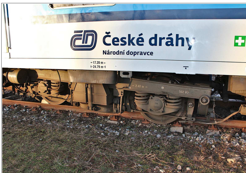
Obr. č. 5: Vykolejená 2. náprava prvního podvozku HDV vlaku Sp 1834