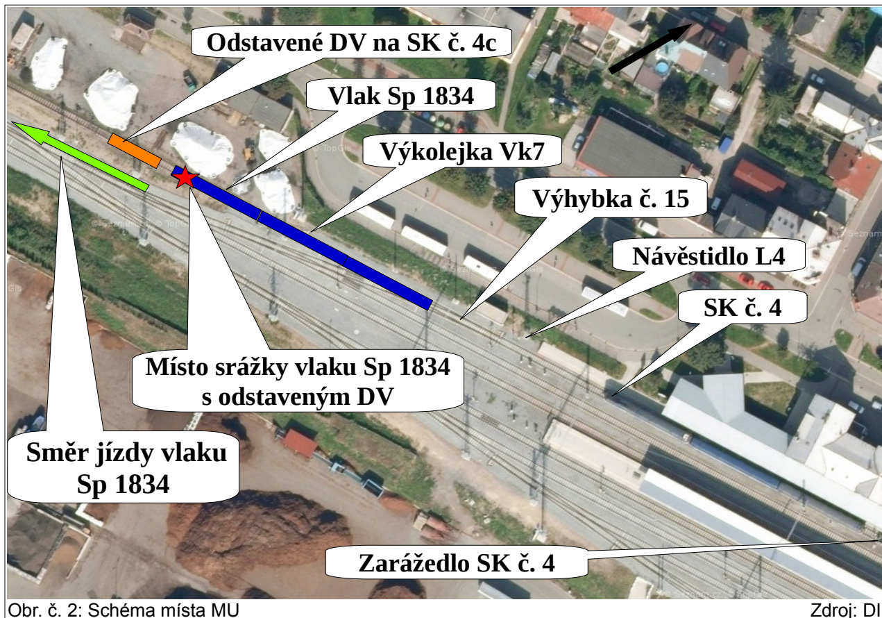
Obr. č. 2: Schéma místa MU

Žst. Letohrad leží na dráze železniční, celostátní, Lichkov – Ústí nad Orlicí, v km 89,953 a zároveň je začátkem celostátní dráhy Letohrad – Týniště nad Orlicí (trať, po níž měl odjet vlak Sp 1834). V přilehlých mezistaničních úsecích je jednokolejná.