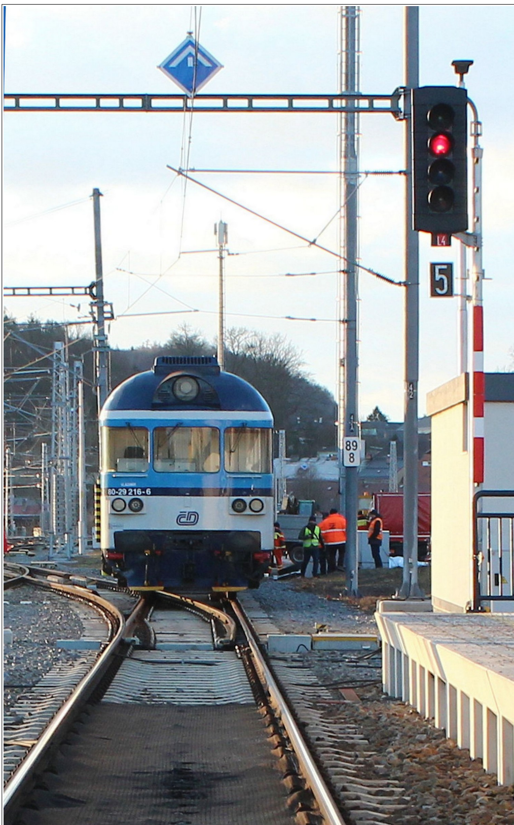
Obr. č. 3: Místo vzniku MU, hlavní (odjezdové) návěstidlo L4, pohled na zadní část ŘDV vlaku Sp 1834 na SK č. 4c