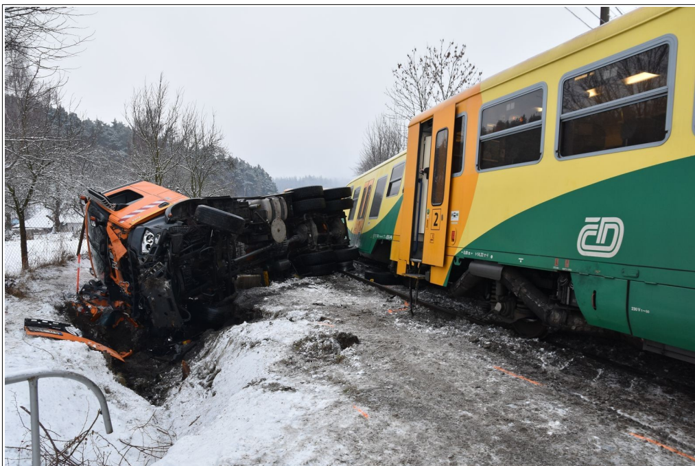
Obr. č. 2: Pohled na převrácený NA a konečné postavení vlaku po MU