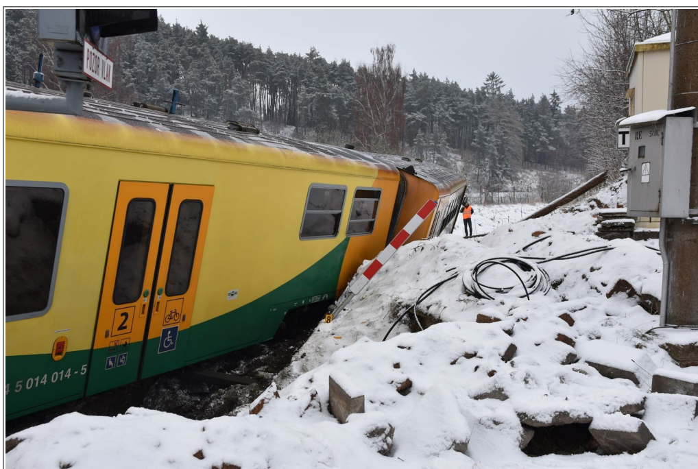
Obr. č. 3: Pohled na vykolejená DV ze strany ŽP od centra obce Rožná