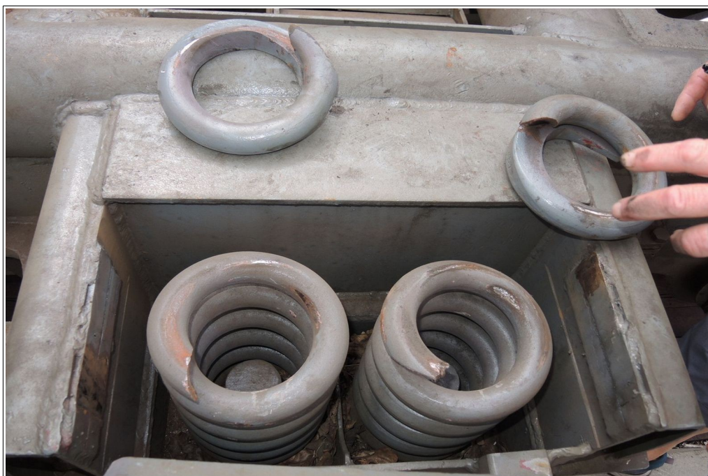
Obr. č. 3: Pružiny sekundárního vypružení s lomy