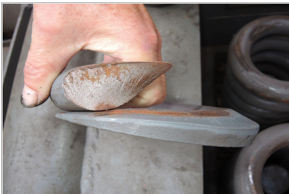
Obr. č. 4: Detail lomové plochy vinuté pružiny