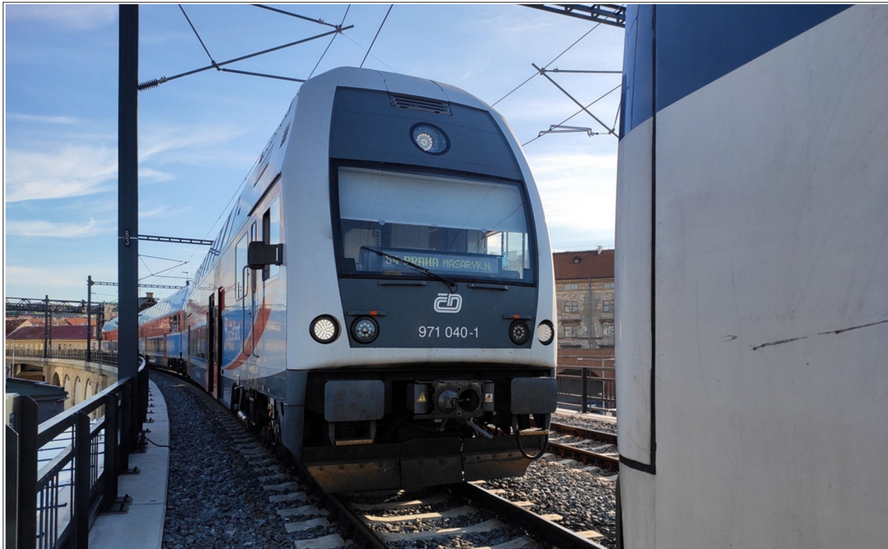
Obr. č. 5: Snímek dokumentující vzájemnou vzdálenost mezi předními čely osobních vlaků.