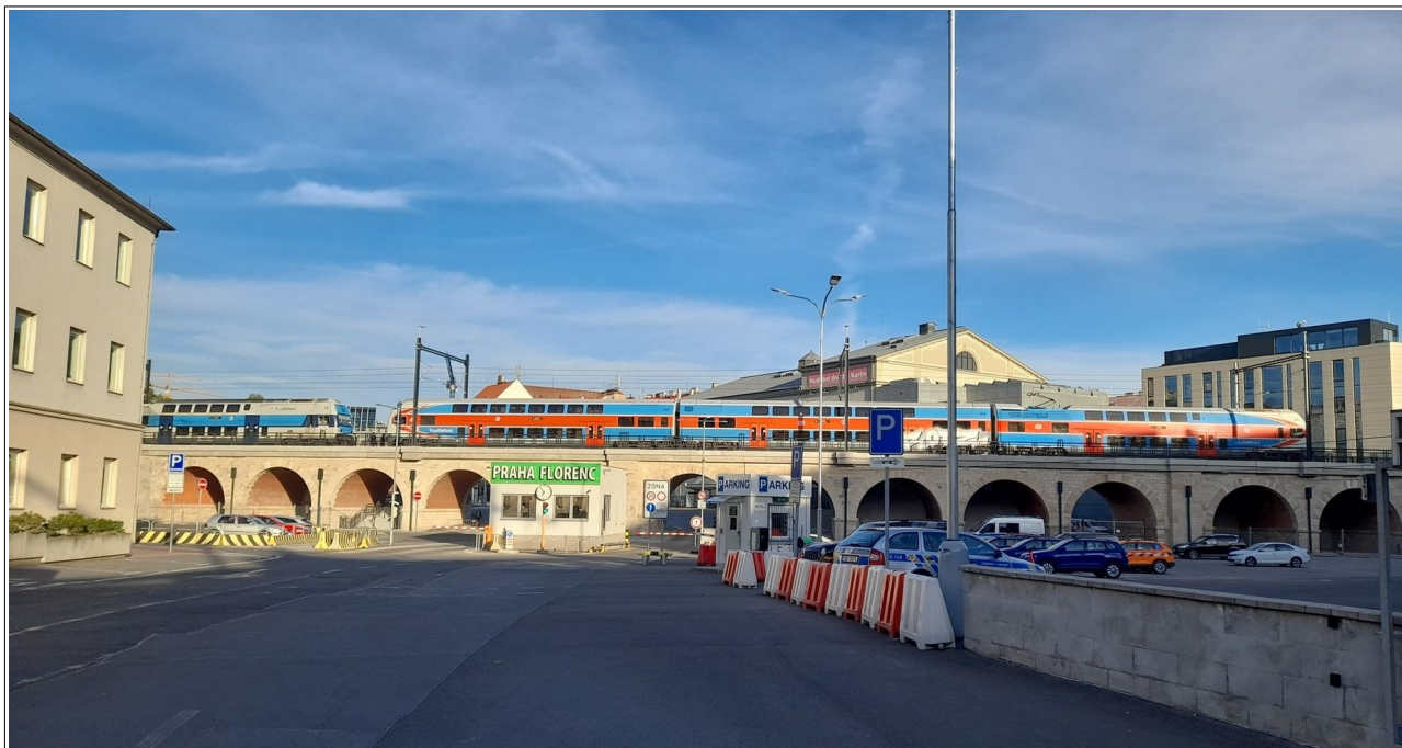
Obr. č. 4: Celkový pohled na vlaky Os 6903 a Os 9608 v konečném postavení po MU na Negrelliho viaduktu z uličního prostoru (pozemní komunikace přilehlé k ul. Prvního pluku).