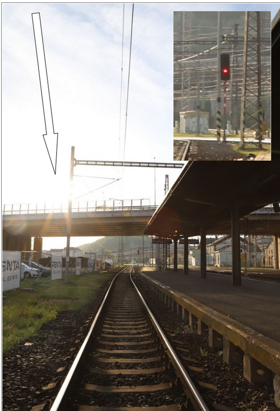
Obr. č. 8: Poloha slunce v čase vzniku MU – snímek, pořízený dne 11. 5. 2021 při stejných světelných podmínkách jako v době vzniku MU, dokládá, že poloha slunce a směr slunečního světla (svitu) neměly na viditelnost cestového návěstidla Sc7 a rozpoznatelnost (nezaměnitelné vnímání) jím návěstěné návěsti „Stůj“ negativní vliv.