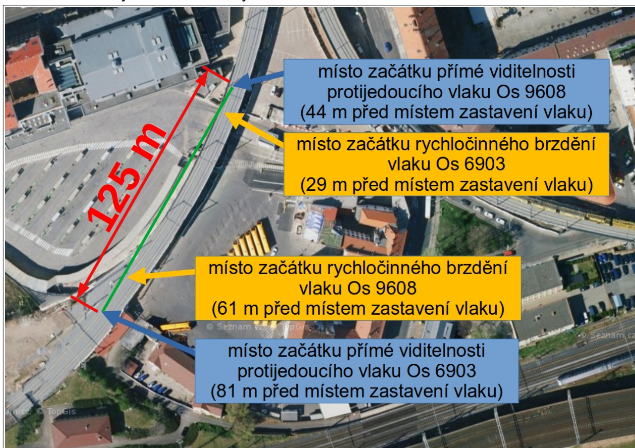
Obr. č. 3: Poloha vlaků Os 9608 a 6903 v místě začátku vzájemné přímé viditelnosti na téže SK.