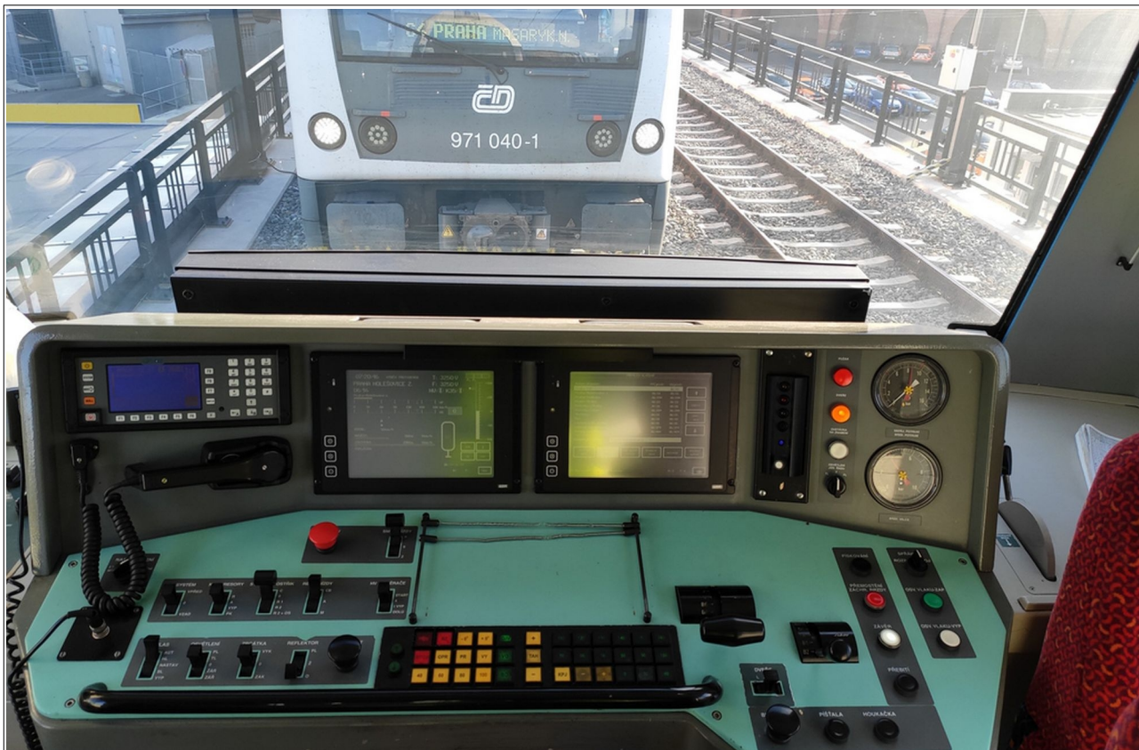
Obr. č. 6: Pohled na přední čelo vlaku Os 6903 z kabiny strojvedoucího vlaku Os 9608 v konečném postavení po MU na SK č. 701 v obvodu viadukt.