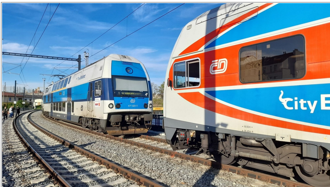
Obr. č. 2: Vlaky Os 6903 a Os 9608 v konečném postavení po MU na SK č. 701.