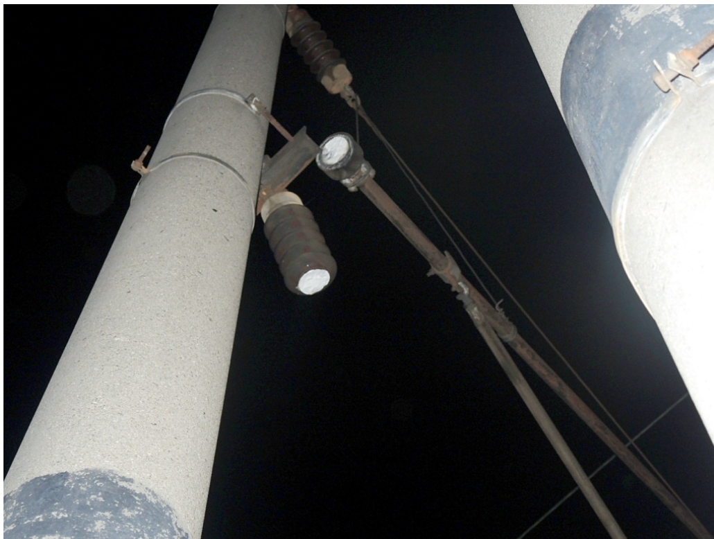
Obr. č. 5: Prasklý izolátor na stožáru