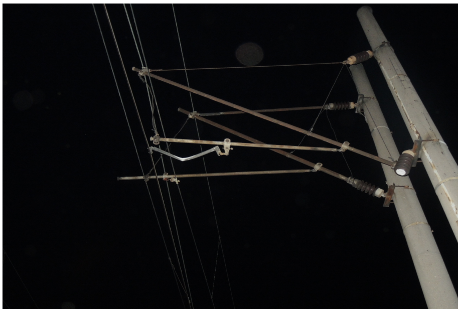
Obr. č. 1: Pohled na místo vzniku MU