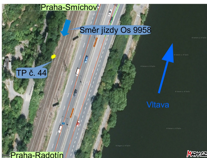
Obr. č. 2: Schéma místa MU.

Poškození sběrače strojvedoucí vzhledem k řazení jednotky zjistil až po zastavení v zastávce Praha-Velká Chuchle v 17:40:42 h. Při obsluze sběrače za napájecí stanicí Chuchle (návěst „Zdvihněte sběrač“) v čase 17:39:19 h bylo v čase 17:39:30 h při rychlosti 85 km·h -1 zaregistrováno stažení sběrače a následně výpadek hlavního vypínače. Strojvedoucí pohledem z bočního okna neviděl při jízdě obloukem žádné poškození TV ani sběrače na HDV. Z důvodu obsazení vlaku cestujícími se rozhodl výběhem dojet do zastávky Praha-Velká Chuchle v km 6,804, kde zastavil. Po zastavení zjistil bližší kontrolou pantografu vznik MU. Ten následně ohlásil, umožnil výstup cestujících a vyčkal příjezdu vyšetřujících složek.