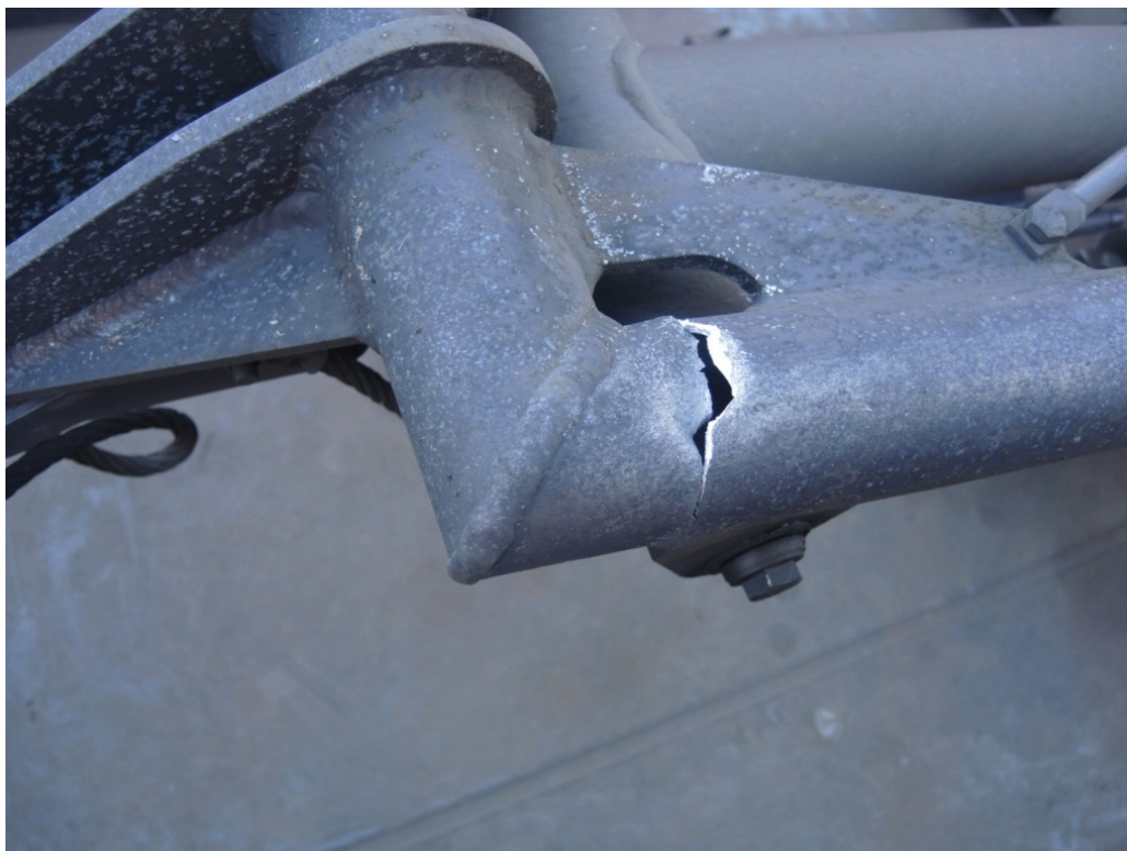
Obr. č. 6: Prasklina v konstrukci pantografu HDV po srážce s izolátorem