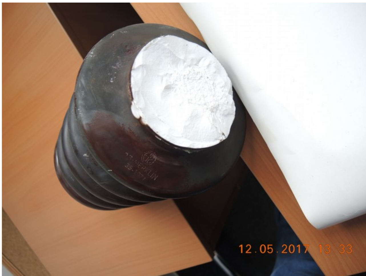
Obr. č. 3.: Detailní pohled na prasklý izolátor a místo průsaku

trakční vedení 2. TK v úseku od zastávky Praha-Velká Chuchle k žst. Praha-Smíchov. V kilometru 3,278 byl ve 2. TK na trakční podpěře č. 44 nalezen prasklý izolátor šikmé konzole ramena L_2 (viz obr. č. 2). Vizualně byl lom izolátoru zhodnocen jako čerstvý, křehký. Šikmá konzole se zachytila částí odlomeného izolátoru za kovový úhelník, na němž byl izolátor připevněn k trakční podpěře. Dále byl zjištěn ohnutý boční držák trakčního vedení (viz obr. č. 5). Ve vzdálenosti 5 metrů před trakční podpěrou č. 44 bylo v km 3,273 nalezeno poškozené propojovací lano odstupující a příchozí větve trakčního vedení. Konec lana příchozí větve visel z trakčního vedení svisle do průjezdného průřezu 2. TK. Ke stržení trolejového drátu nedošlo. Prohlídkou z MVTV bylo dále zjištěno, že bylo poškozeno 9 závěsů mezi trolejovým drátem a nosným lanem. Jiné poškození trakčního vedení zjištěno nebylo. Drážní inspekce předmětný izolátor zajistila.