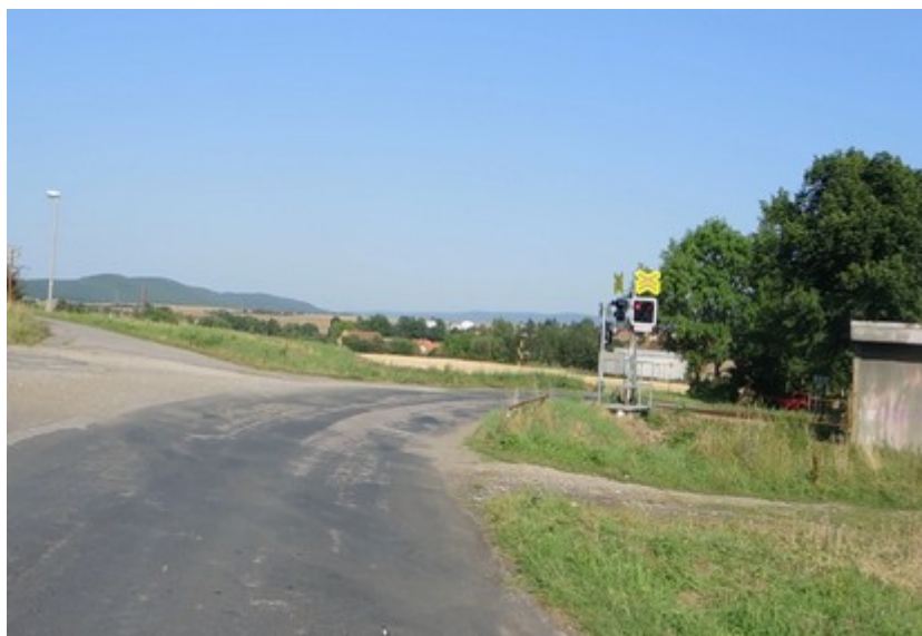
Obr. č. 7: Viditelnost výstražníku a výstrahy PZZ ze 40 m ve směru jízdy OA

Dne 1. 8. 2017 bylo inspektorem DI provedeno ověření viditelnosti jak svislých dopravních značek na pozemní komunikaci, tak i viditelnosti světelné výstrahy na světelné skříni výstražníku PZZ ve směru jízdy OA v čase shodném s časem vzniku MU a za stejných povětrnostních a světelných podmínek. Současně byla také prověřována možnost oslnění řidiče OA sluncem.