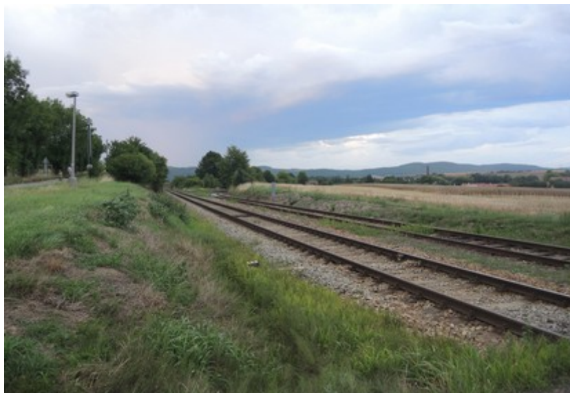
Obr. č. 5: Rozhledová délka ve směru jízdy OA a vlaku Os 27714