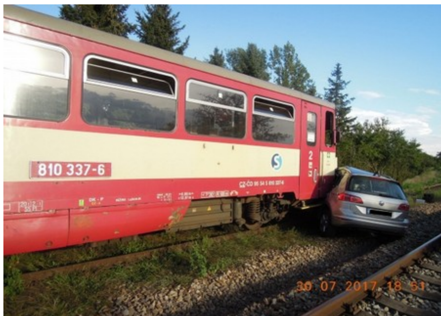
Obr. č. 1: Pohled na zaklíněný osobní automobil

GPS: 49°51'13.07087" N, 13°58'30.90012" E.