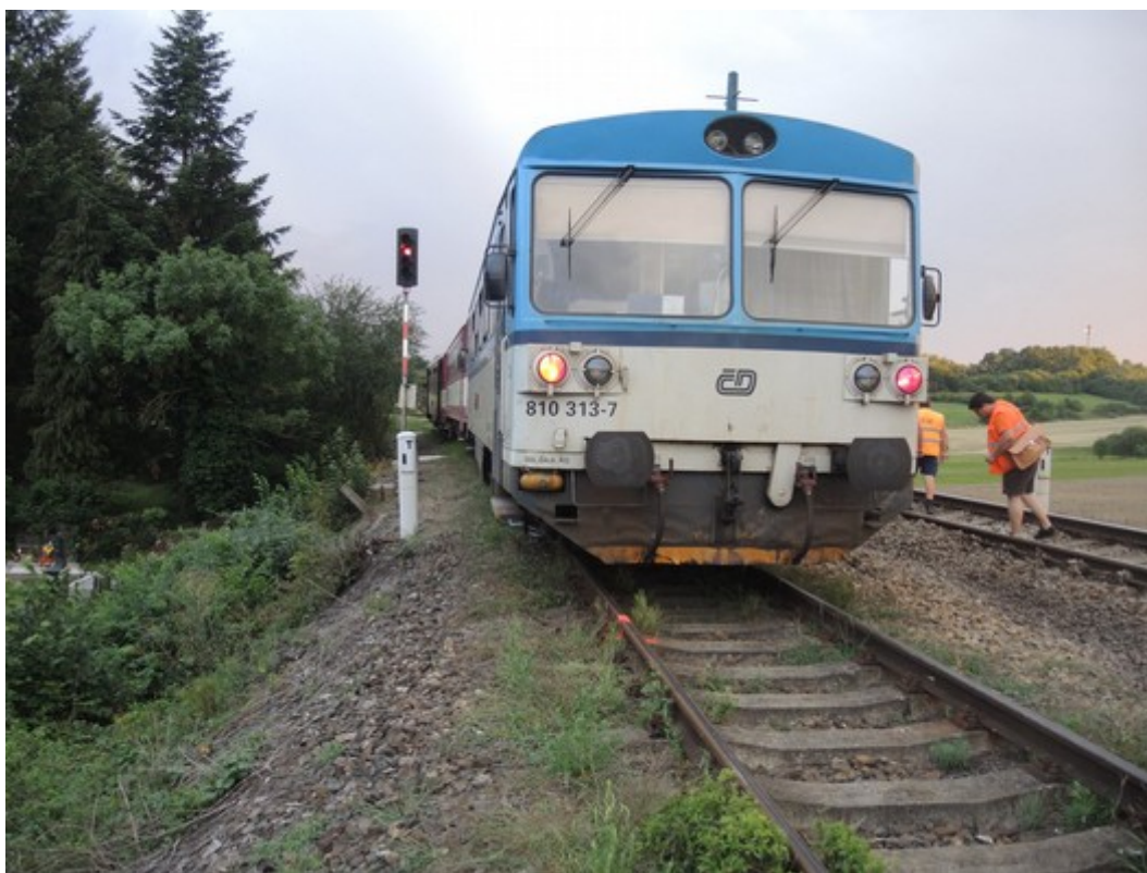
Obr. č. 9: Pohled na vlak Os 27714 a vjezdové návěstidlo TL