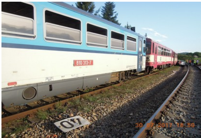
Obr. č. 6: Pohled na návěstidla a rozhrnutý štěrk