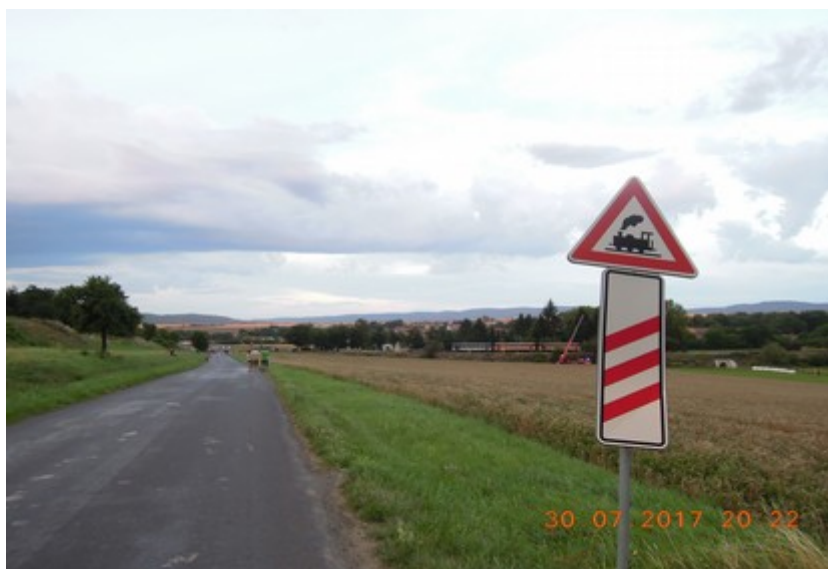
Obr. č. 3: Silniční značení ve směru jízdy OA