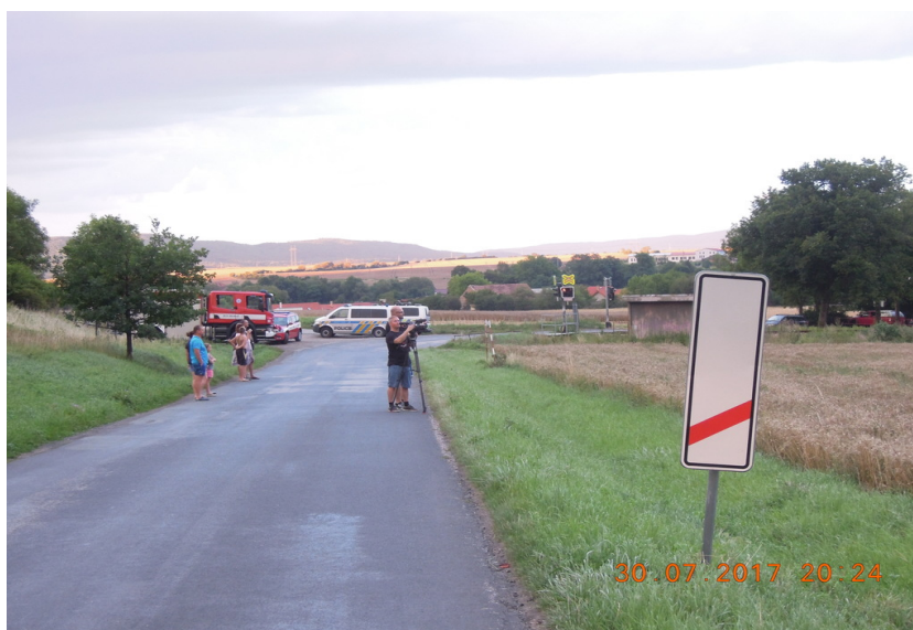
Obr. č. 4: Viditelnost výstražného kříže a výstrahy PZZ ve směru jízdy OA