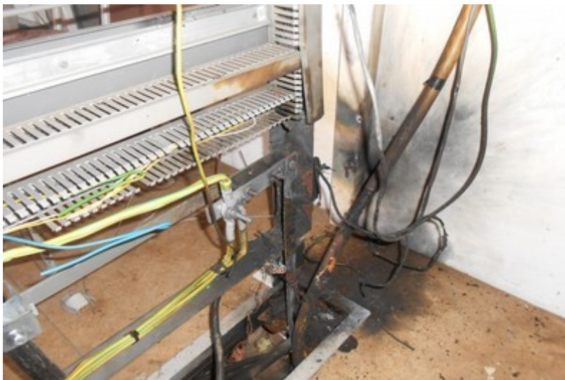
Obr. č. 5: Pohled na zkratované vodiče PZZ P2727 následkem MU.

Zúčastněná zaměstnankyně provozovatele dráhy (výpravčí) byla na základě předloženého lékařského posudku o zdravotní způsobilosti k práci v době vzniku MU zdravotně způsobilá pro výkon své funkce.