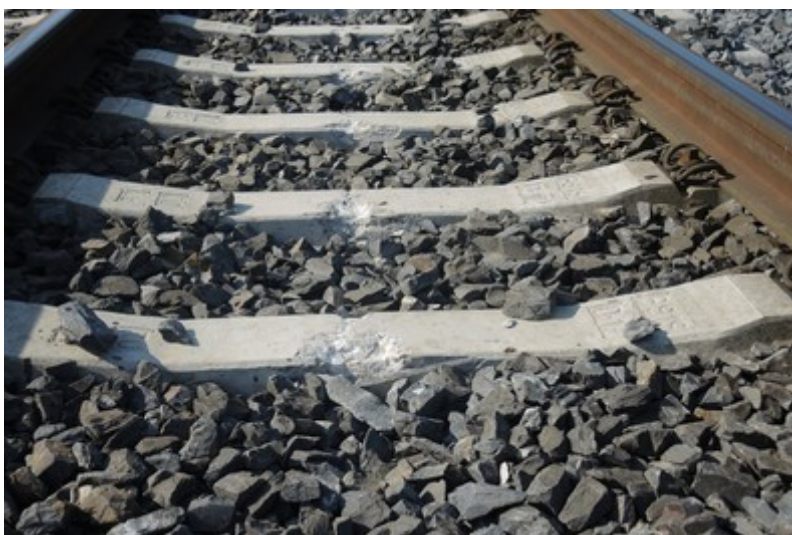
Obr. č. 2: Stopy v kolejišti po jízdě DV ve vykolejeném stavu.