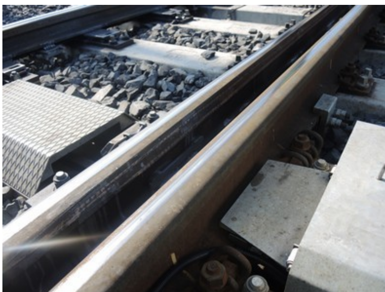
Obr. č. 1: Stopy otěru kol DV mezi jazykem a opornicí – násilného přestavení výhybky č. 19