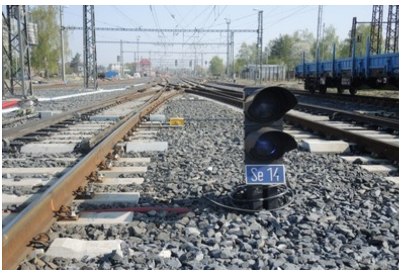
Obr. č. 3: Pohled na návěstidlo Se14 pro zamýšlenou jízdu zpět.