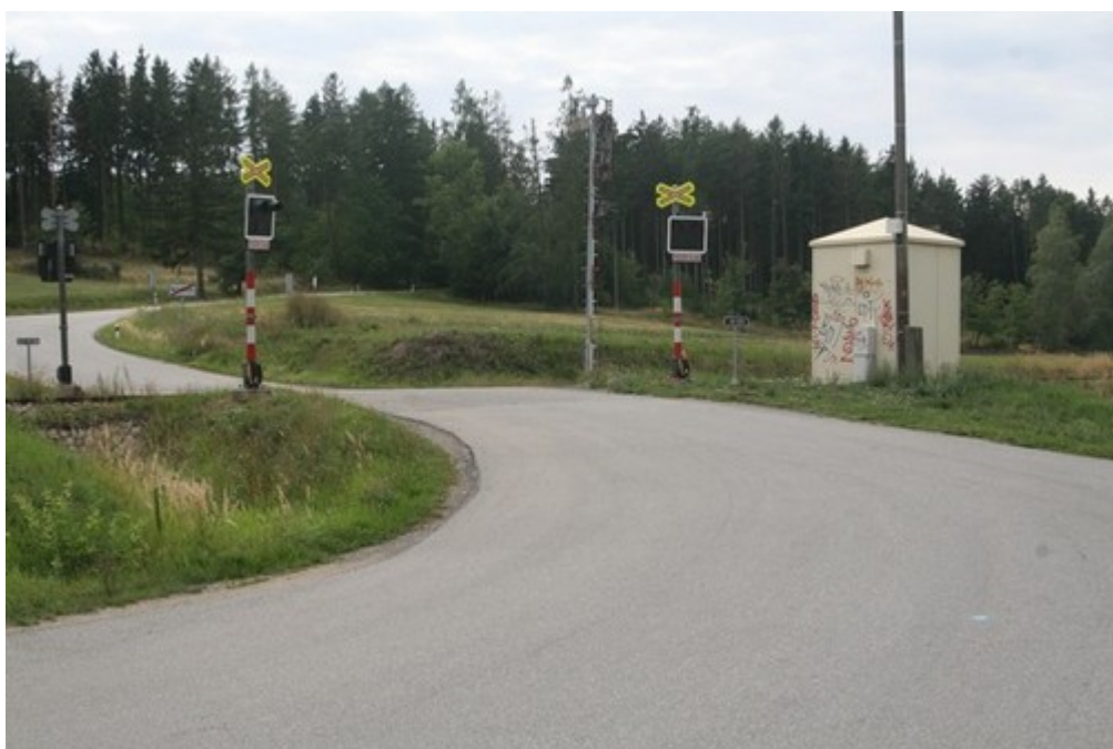
Obr. č. 5: Pohled na označení přejezdu ve směru od obce Stařeč, to na vzdálenost větší než D_z = 20 metrů