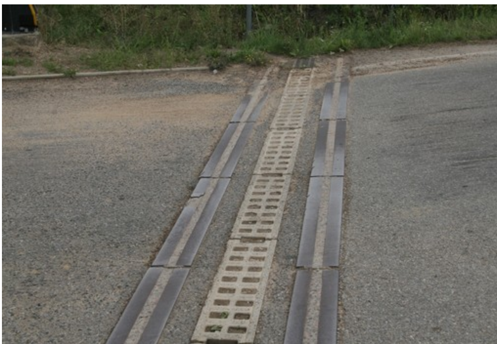
Obr. č. 4: Zanesené odvodňovací zařízení na železničním přejezdu P3652