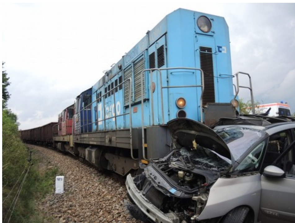
Obr. č. 1: Pohled na čelo vlaku po vzniku MU