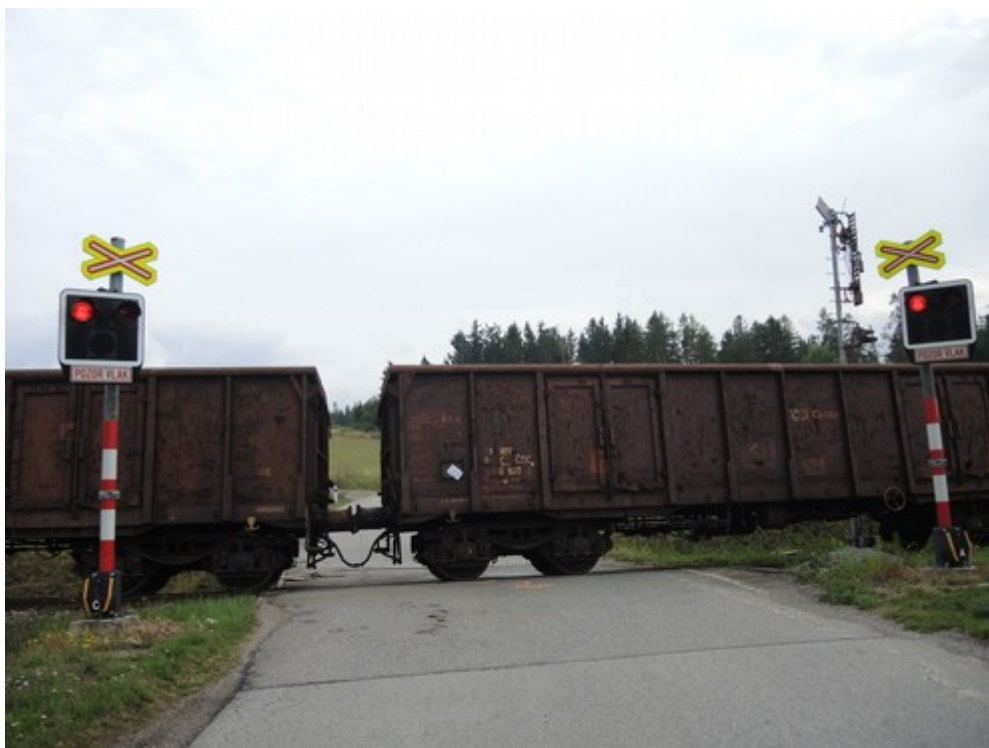
Obr. č. 3: Pohled na přejezd P3652 v době ohledání místa MU