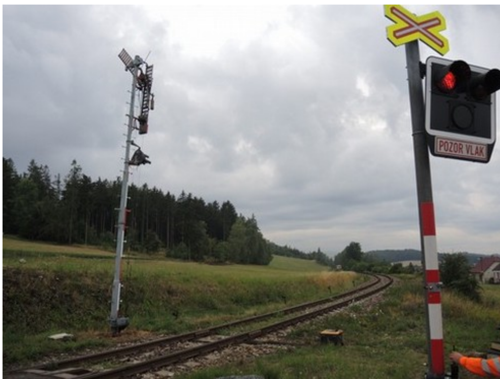
Obr. č. 6: Rozhled na dráhu ve směru Okříšky