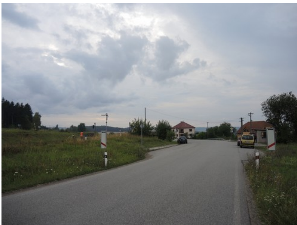
Obr. č. 7: Pohled na dopravní značky A 31c „Návěstní deska (80 m)“ ve směru od obce Stařeč