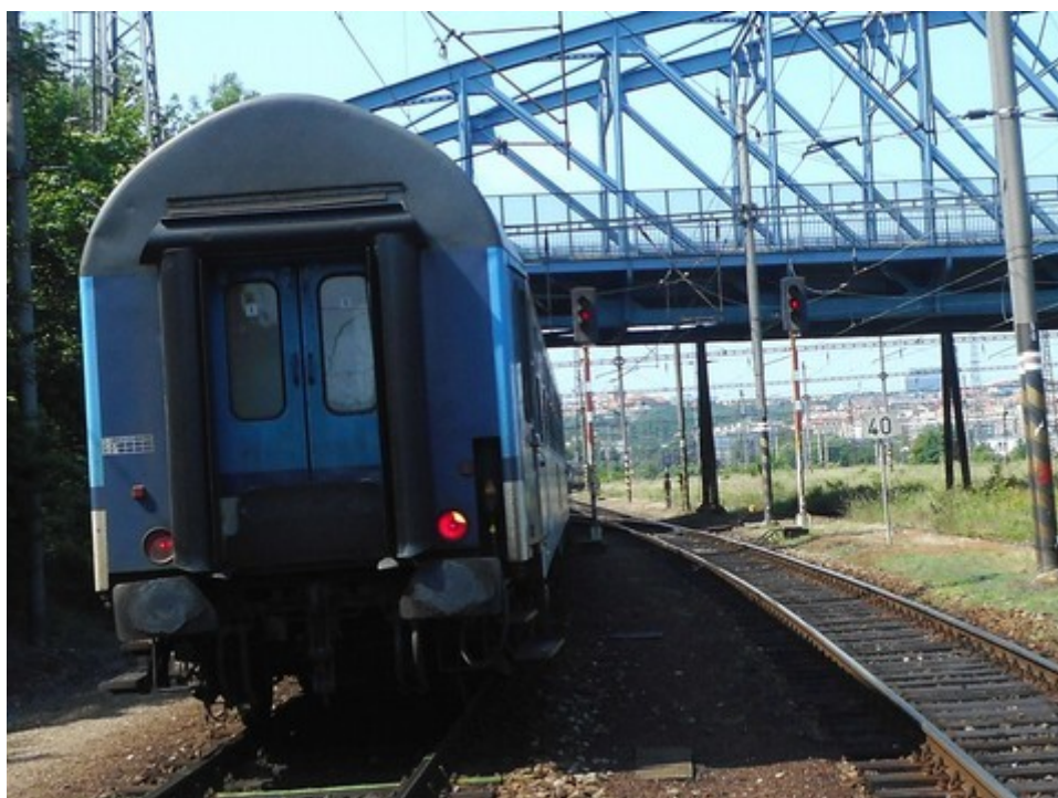
Obr. č. 1: Místo MU – návěstidlo L1 vpravo