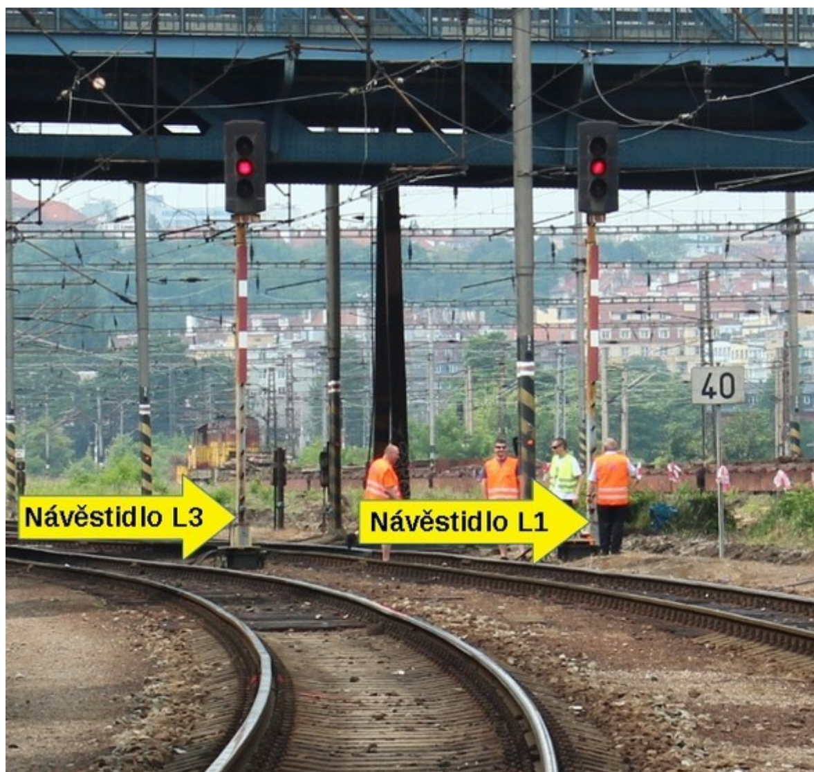
Obr. č. 5: Pohled na místo MU, návěstidla L1 a L3