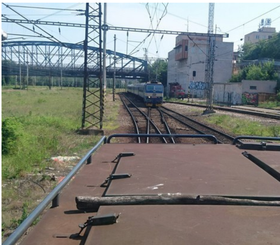
Obr. č. 4: Pohled na místo zastavení z HDV posunového dílu