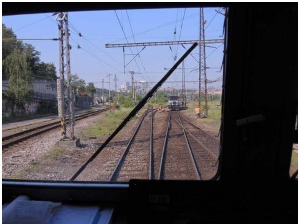
Obr. č. 3: Pohled na místo zastavení z HDV vlaku Sv 29977