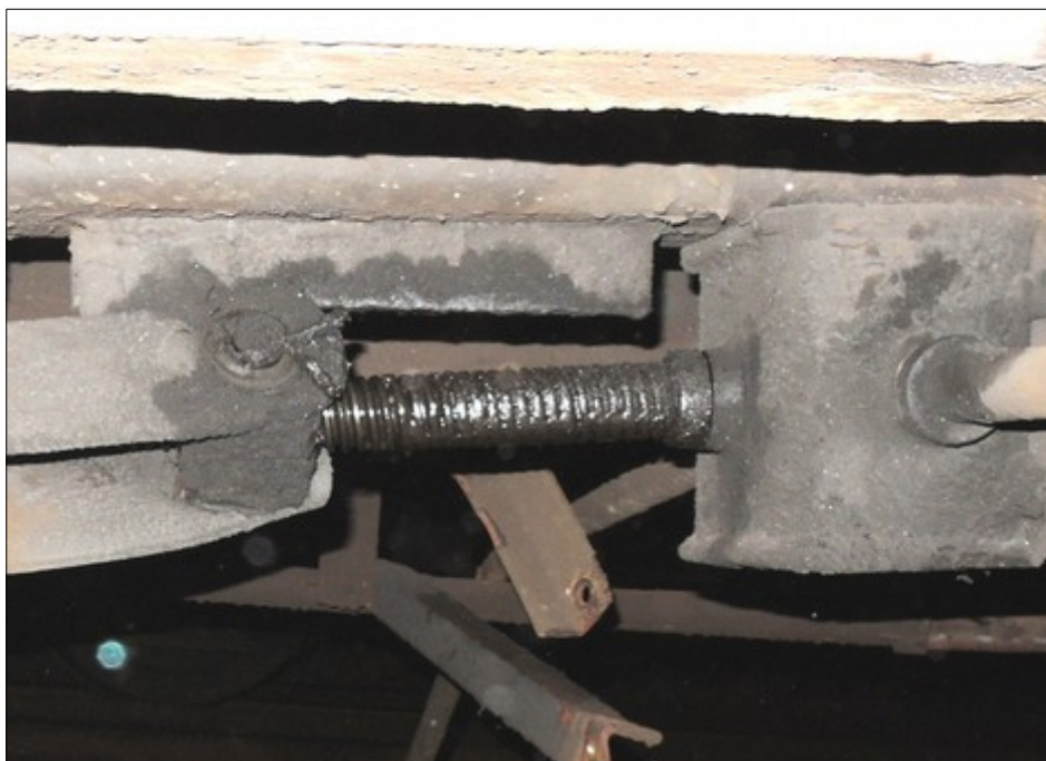
Obr. č. 4: Pohled na vřeteno pořádací brzdy TDV 81 54 5972 878-9 se zřetelně setřeným mazacím tukem.