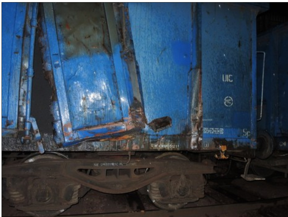
Obr. č. 5: Pohled na poškozenou vozovou skříň TDV 31 51 5355 925-9 řazeného jako v 4. TDV za HDV taženého posunového dílu PČ 13.