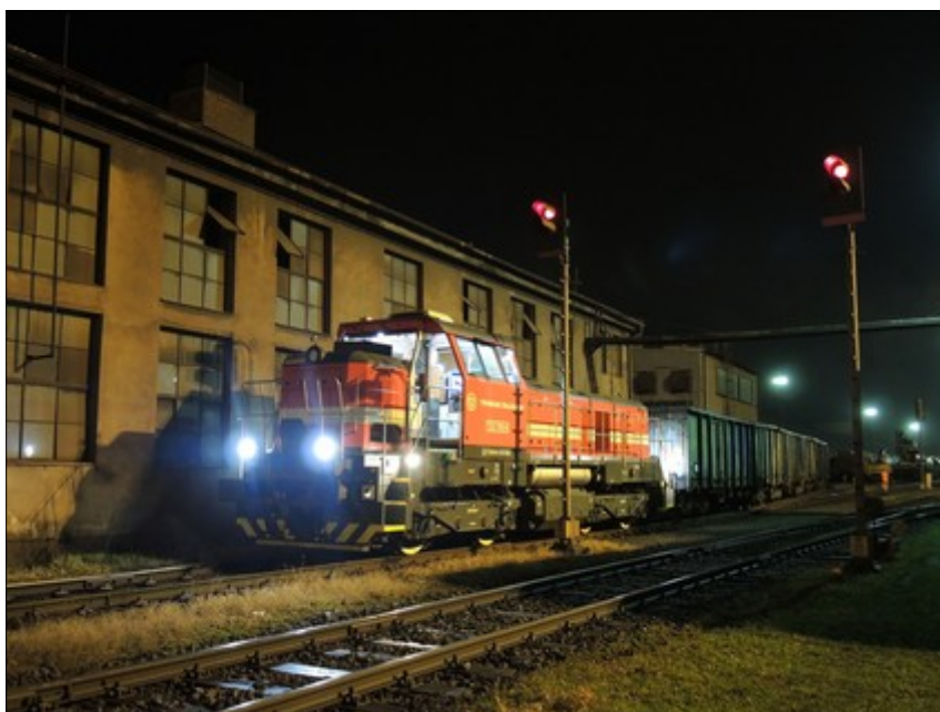
Obr. č. 1: Pohled na přední čelo taženého posunového dílu „Posunové čety 13 – Válcovna“ v konečném postavení po MU.