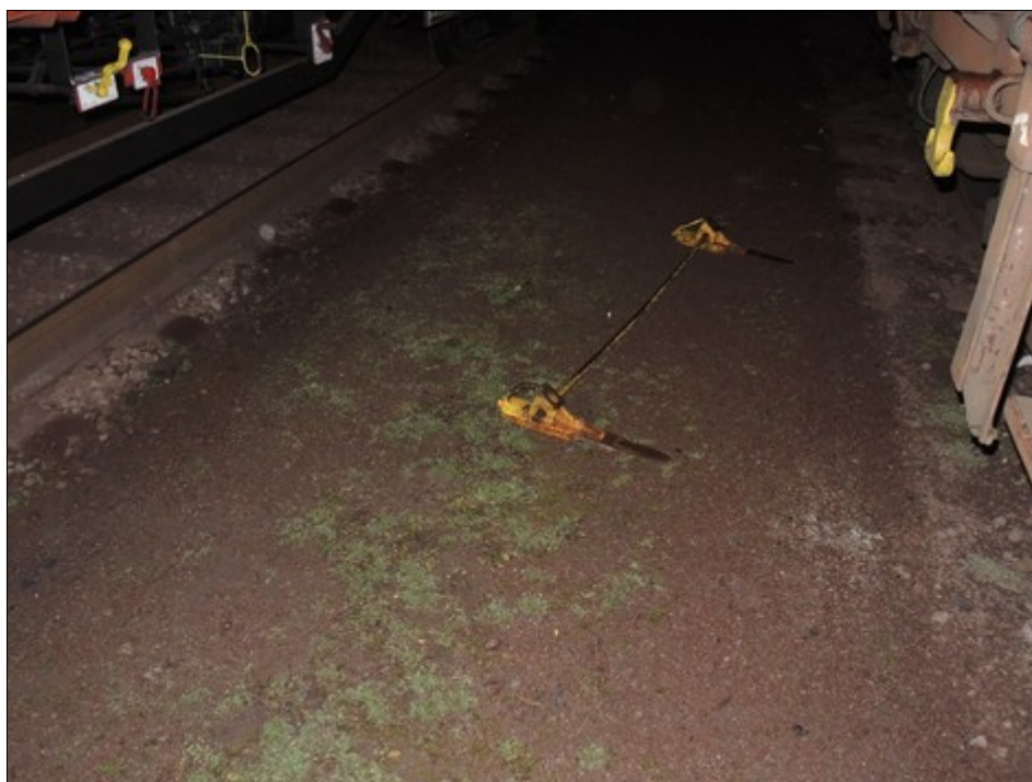
Obr. č. 6: Pohled na dvojitou zarážku volně položenou mezi kolejemi č. 1508 a č. 1509.