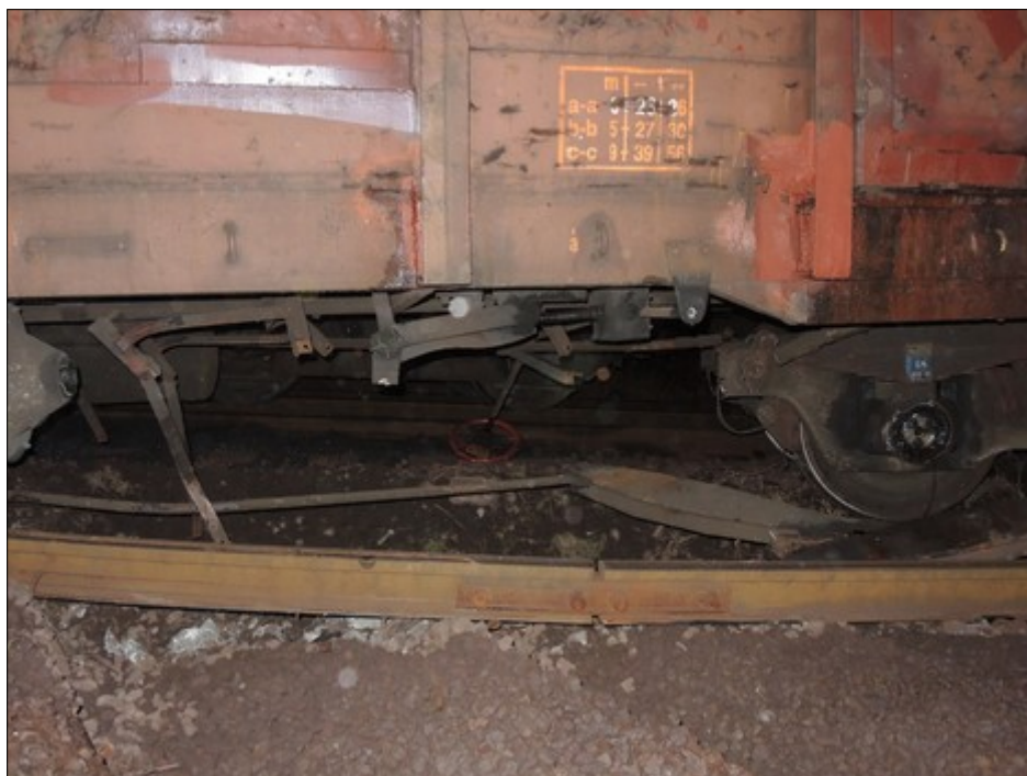
Obr. č. 3: Pohled na poškozené brzdové zařízení TDV 81 54 5972 878-9 řazeného v čele skupiny 9 TDV.