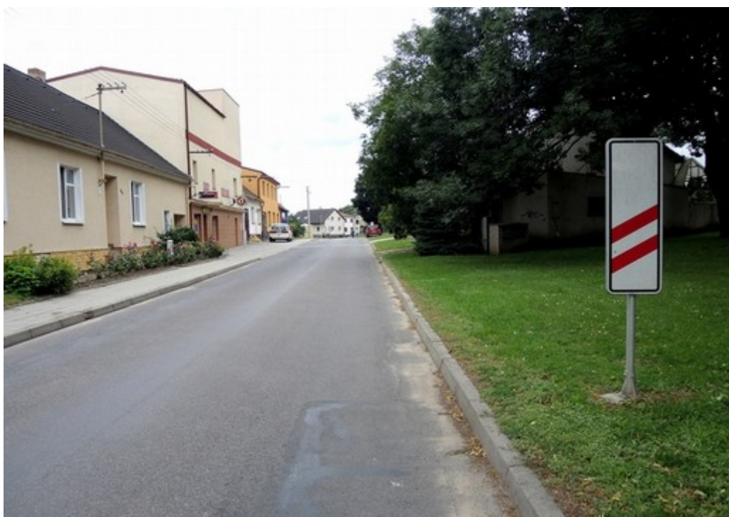
Obr. č. 6: Dopravní značka A 31b „Návěstní deska“ ve vzdálenosti 160 m