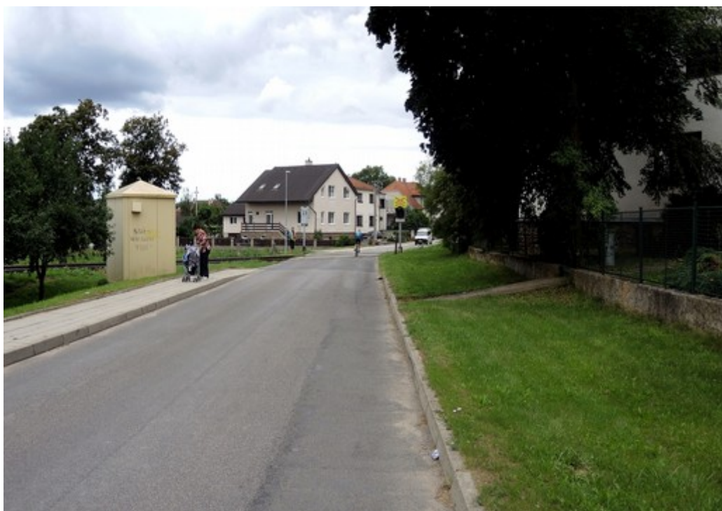
Obr. č. 4: Viditelnost výstražníku ve směru jízdy OA na vzdálenost D_z = 35\text{ m}