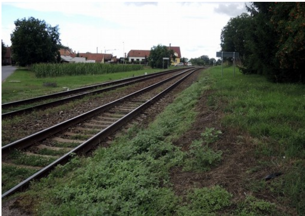
Obr. č. 7: Viditelnost Lp od výstražníku ve směru jízdy OA směrem k čelu vlaku Sp 1723