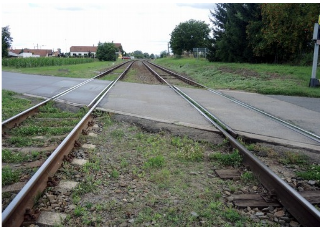
Obr. č. 8: Přejezdová vozovka