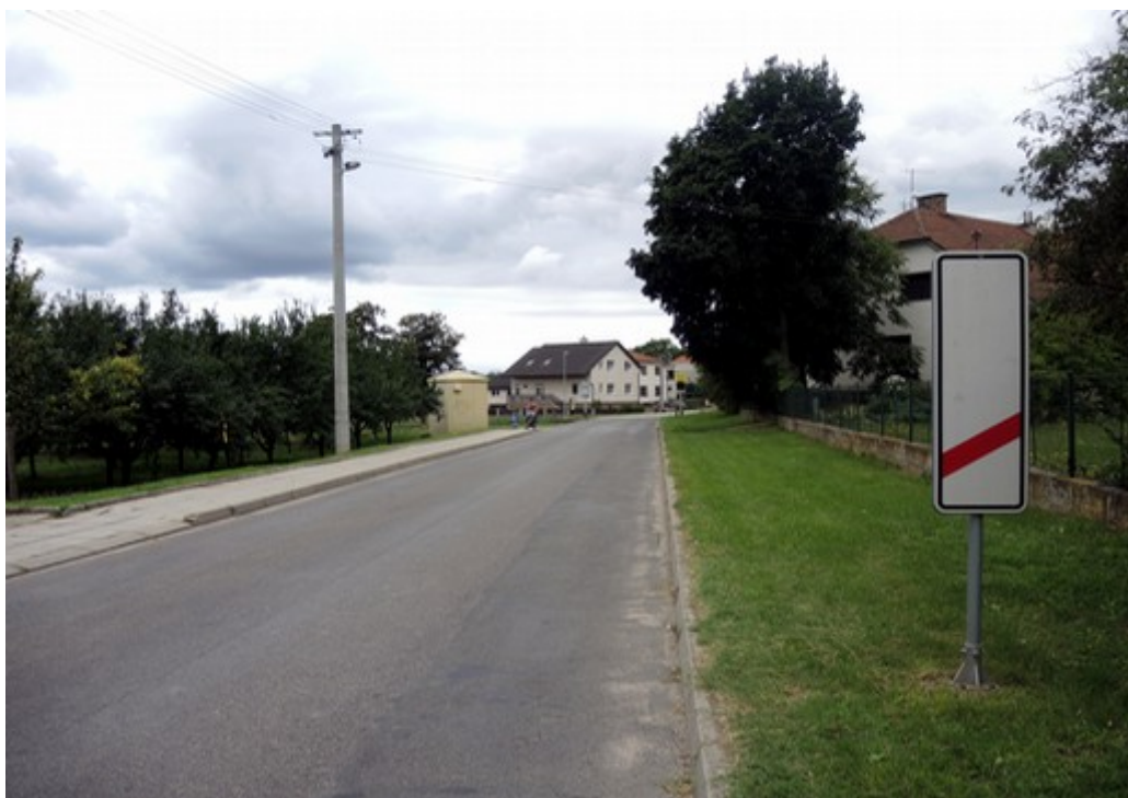
Obr. č. 5: Dopravní značka A 31c „Návěstní deska“ ve vzdálenosti 80 m