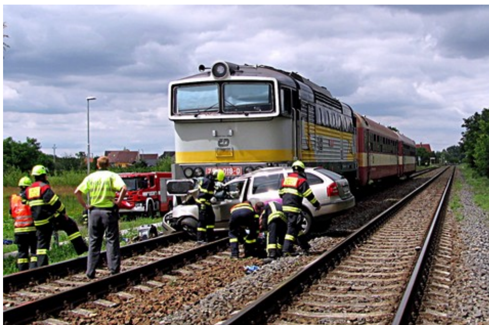
Obr. č. 1: Pohled na čelo vlaku po vzniku MU