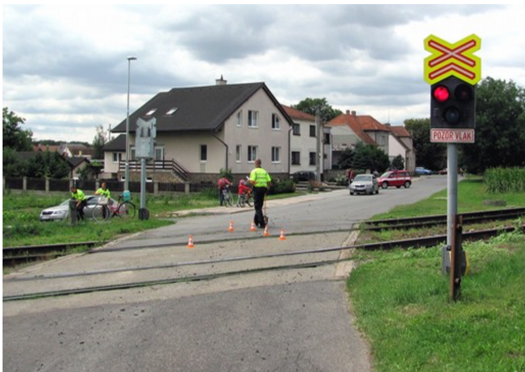
Obr. č. 3: Stav přejezdu ve směru jízdy OA po přjezdu pověřené osoby provozovatele dráhy a dopravce na místo MU