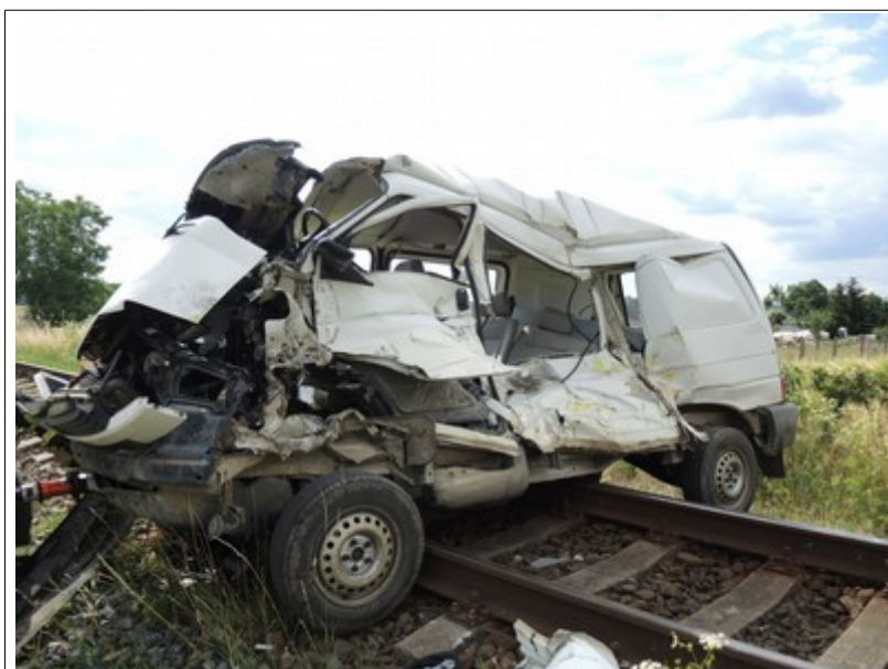
Obr. č. 8: Pohled na DA po uvolnění zaklínění na čele HDV