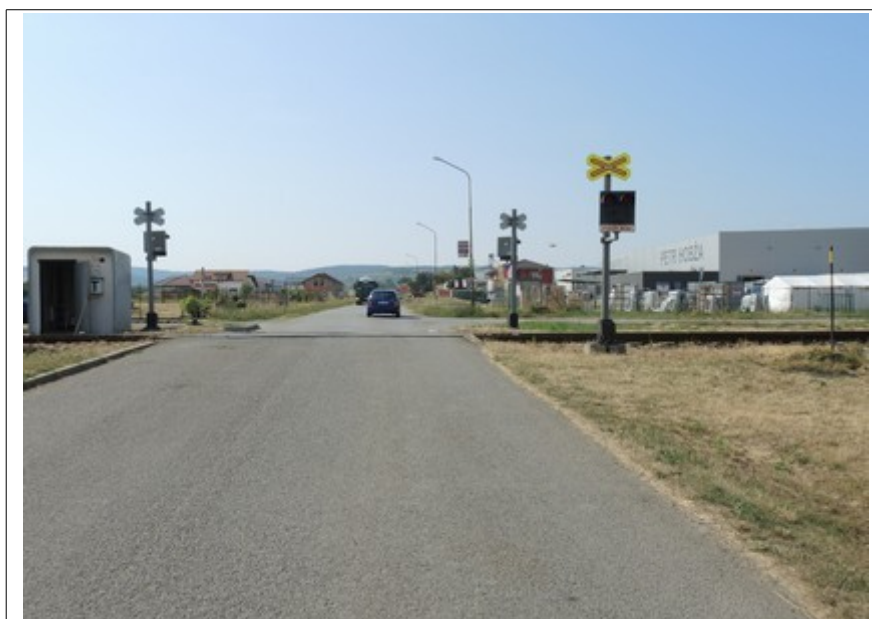
Obr. č. 5: Výhled na výstražník PZZ