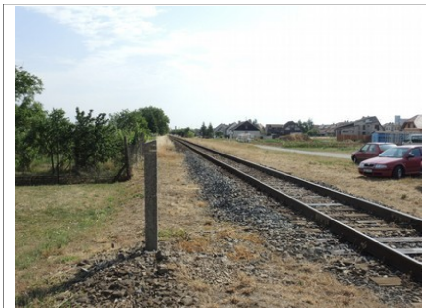
Obr. č. 6: Výhled ze směru jízdy vlaku

Bezprostředně před vjetím DA na přejezd byl ve vzdálenosti 4 m od osy koleje umožněn řidiči dostatečný výhled do směru jízdy vlaku (Obr. č. 6), aby se mohl, poté co před tím nerespektoval světelnou a zvukovou výstrahu dávanou PZZ, přesvědčit, zda může přejezd bezpečně přejet (§ 28 odst. 1 zákon č. 361/2000 Sb.)