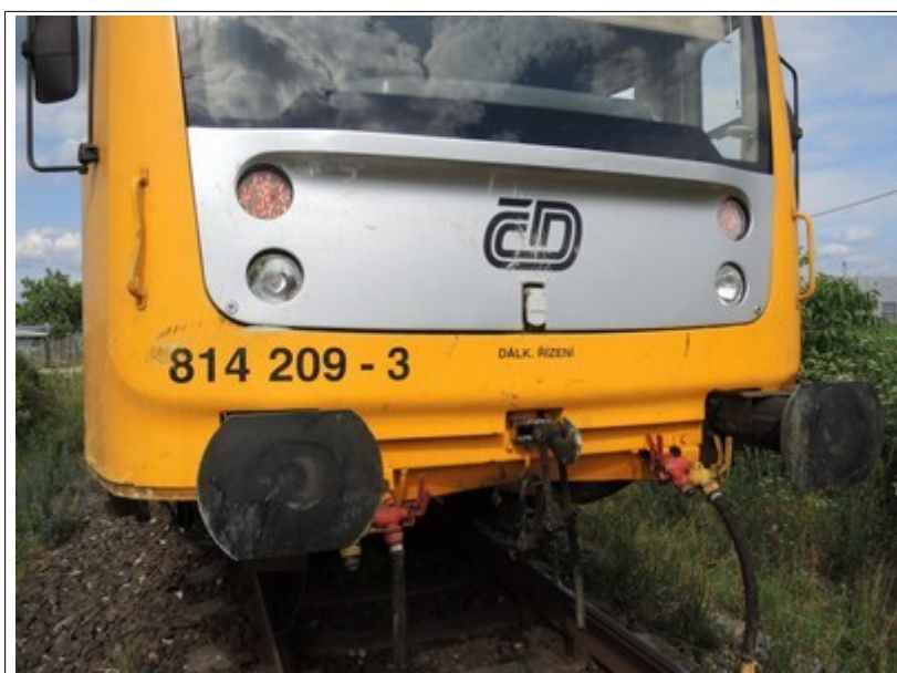
Obr. č. 7: Pohled na čelo HDV po odstranění zaklíněného DA