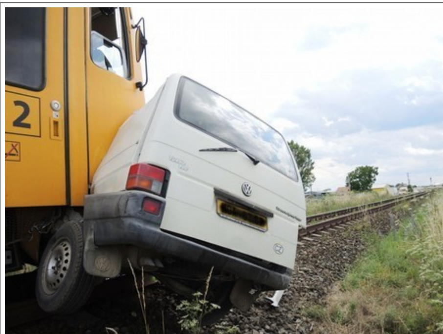
Obr. č. 1: Pohled na místo MU