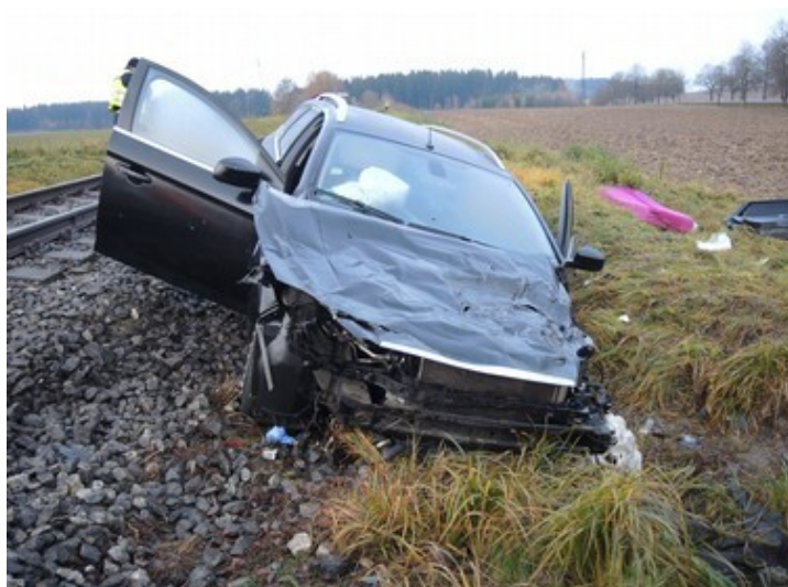
Obr. č. 5: Pohled na OA