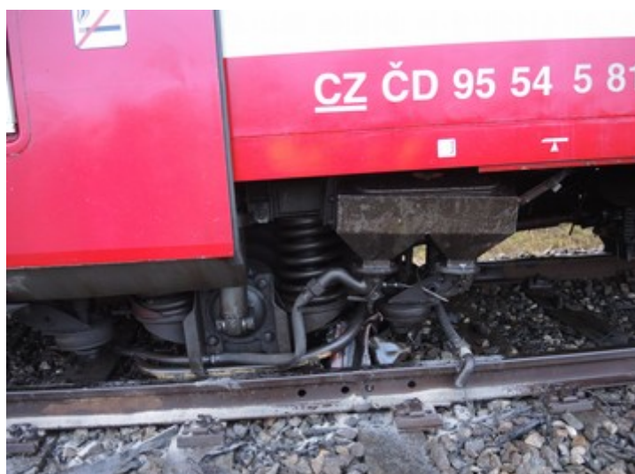
Obr. č. 6: Vykolejený zadní podvozek HDV