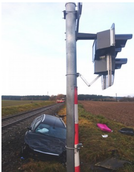
Obr. č. 1: Pohled na místo MU

GPS: 49°25'36.26036" N, 14°55'48.48952" E.