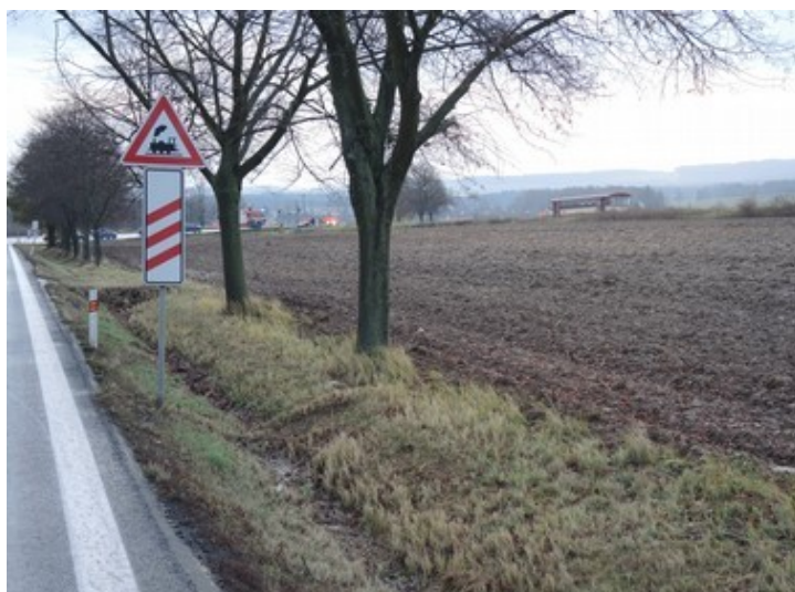
Obr. č. 3: Silniční značení ve směru jízdy OA