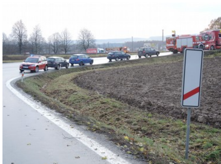
Obr. č. 4: Viditelnost výstražných křížů a výstrahy PZZ ve směru jízdy OA