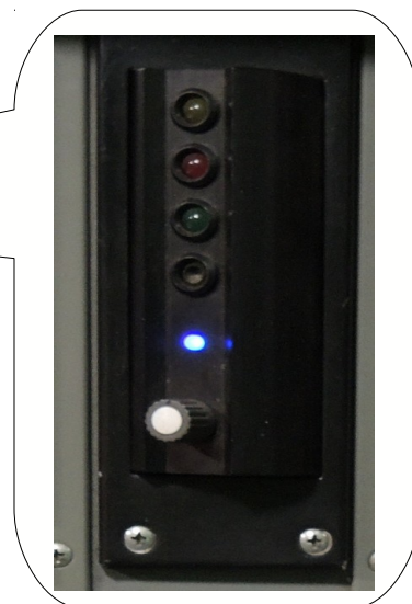
Obr. č. 4: Na návěstním opakovací svítí modré světlo