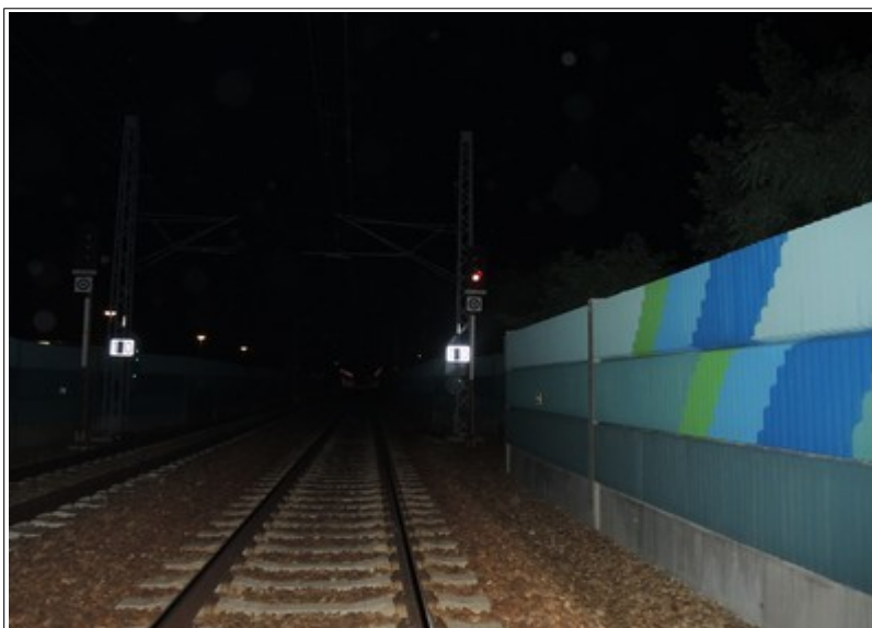
Obr. č. 5: Pohled na poslední oddílové návěstidlo AB 2-1067