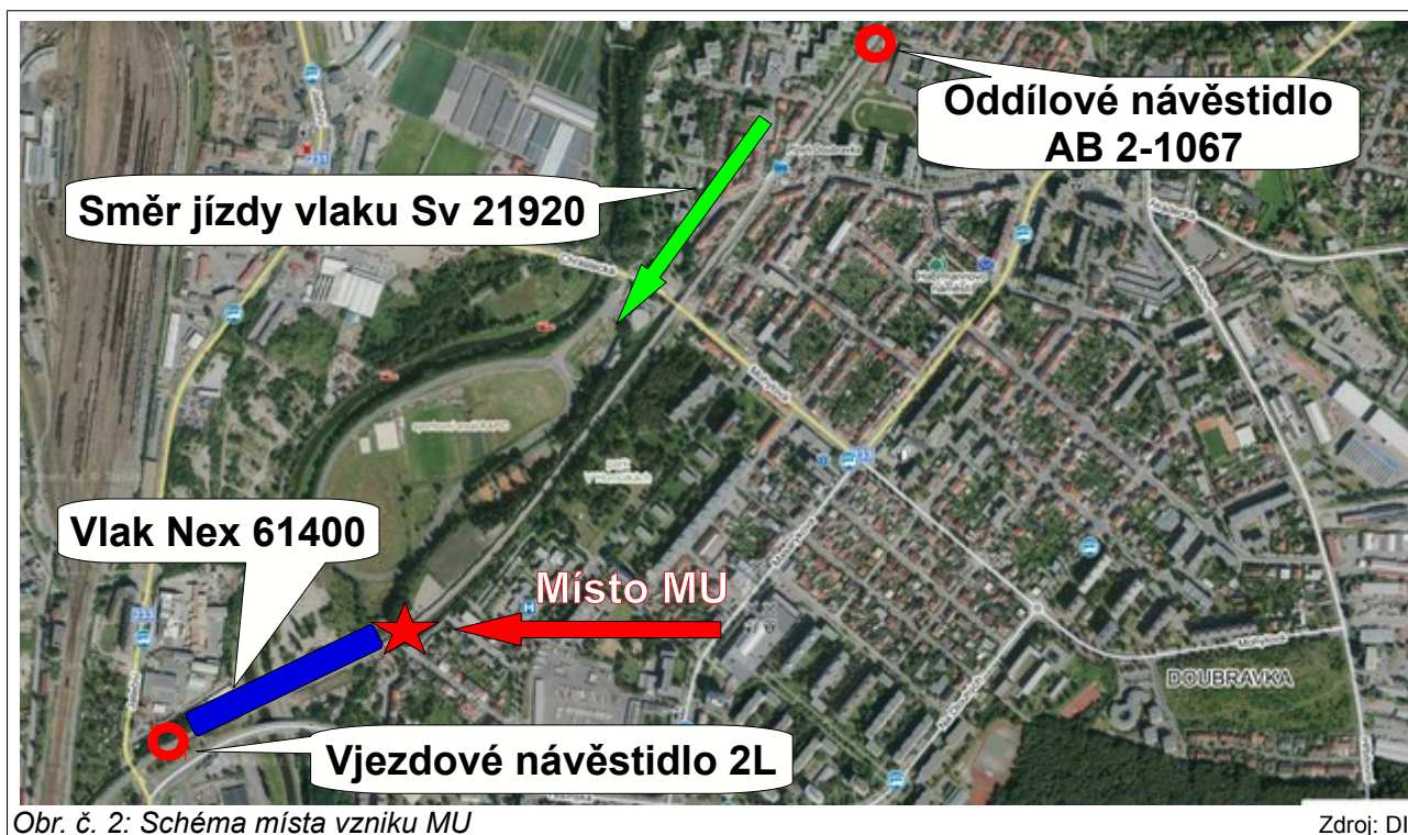
Obr. č. 2: Schéma místa vzniku MU