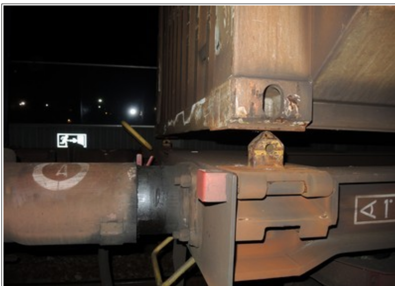
Obr. č. 3 Uvolněný kontejner z kotevních tmů