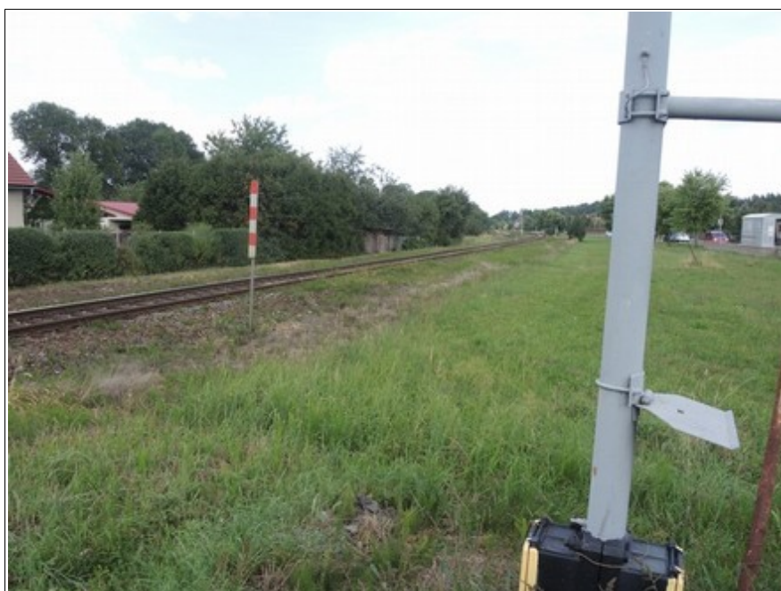
Obr. č. 4: Rozhled na dráhu proti směru jízdy vlaku Os 3130 od žst. Baška z úrovně výstražného kříže, ze směru jízdy SMV k ŽP P7385 od silnice III. třídy č. 48425.