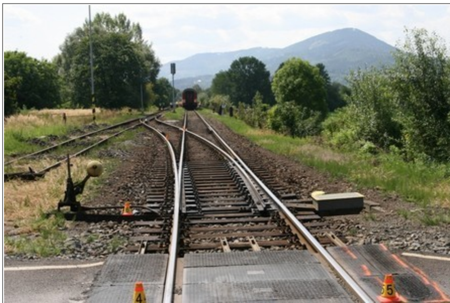
Obr. č. 5: Pohled z ŽP P7385 k místu zastavení vlaku po MU.