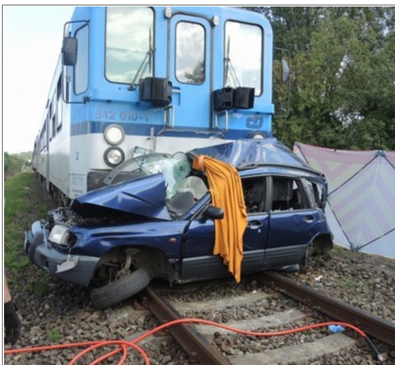
Obr. č. 1: Pohled na čelo HDV po vzniku MU.