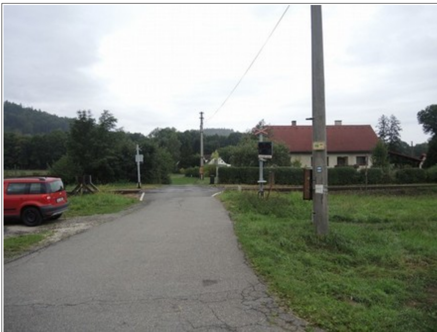
Obr. č. 3: Pohled na ŽP P7385 od silnice III. třídy č. 48425.