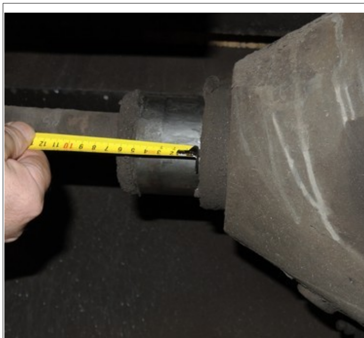
Obr. č. 4: Nedostatečný zdvih pístu brzdového válce

Při ohledání TDV Sgs 191-2 bezprostředně po vzniku MU byl zjištěn odborně způsobilými osobami nedostatečný účinek ruční pořadací brzdy. Tento nedostatek byl potvrzen i při komisionální prohlídce dne 12. 2. 2019 v SOKV Ústí nad Labem, kdy byl zároveň zjištěn nedostatečný zdvih (35 – 55 mm) pístu brzdového válce (viz obr. č. 4).