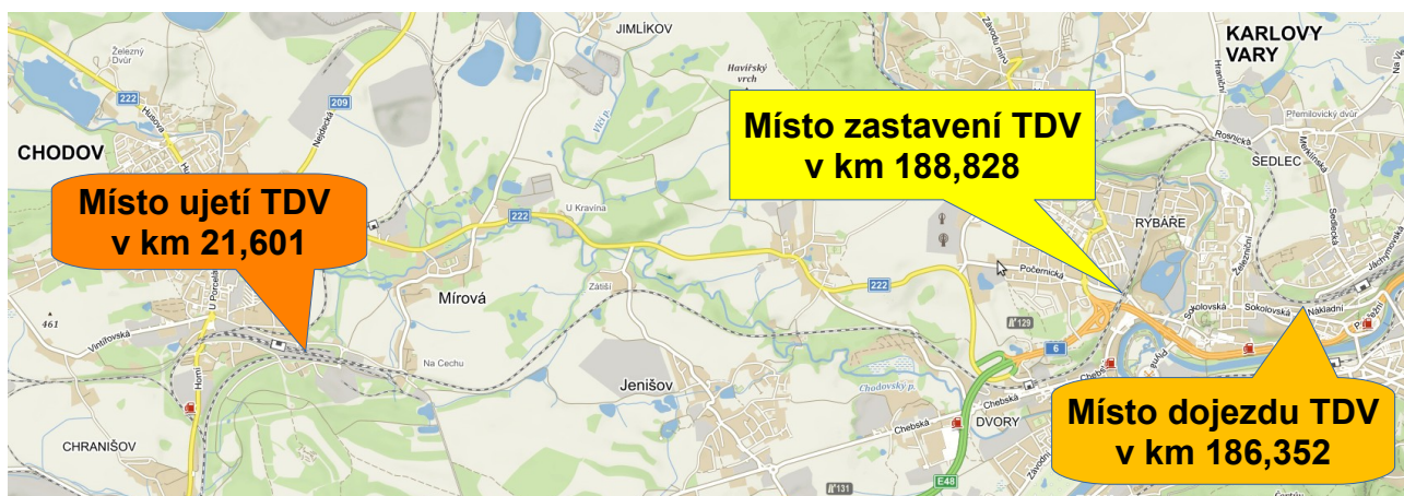
Obr. č. 2: Schéma místa vzniku MU

Dne 18. 1. 2019 přijel do žst. Chodov nákladní vlak Mn 87084 tvořený HDV řady 742 a dvěma TDV řady Sgs loženými kontejnery. Skupina TDV byla odstavena v 9.09 h na 4a. SK v úrovni skladiště. Ve 13.49 h se skupina TDV samovolně rozjela směrem k žst. Karlovy Vary, v čase 13.52 h projela kolem návěstidla Lc4a s návěstí „Stůj“ a následně násilně přestavila výhybku č. 11 z 4a. SK na 2. SK. Skupina TDV pokračovala v jízdě po 102. SK na 2. TK. V protisvahu na chodovském zhlaví žst. Karlovy Vary se samostatně jedoucí skupina TDV zastavila a opět samovolně rozjela zpět směrem k žst. Chodov. V protisvahu poblíž obce Jenišov se skupina TDV zastavila a opět rozjela směrem k žst. Karlovy Vary. Po několikeré změně směru se skupina TDV zastavila v km 188,828, kde ji zaměstnanci provozovatele dráhy zajistili proti nežádoucímu pohybu.