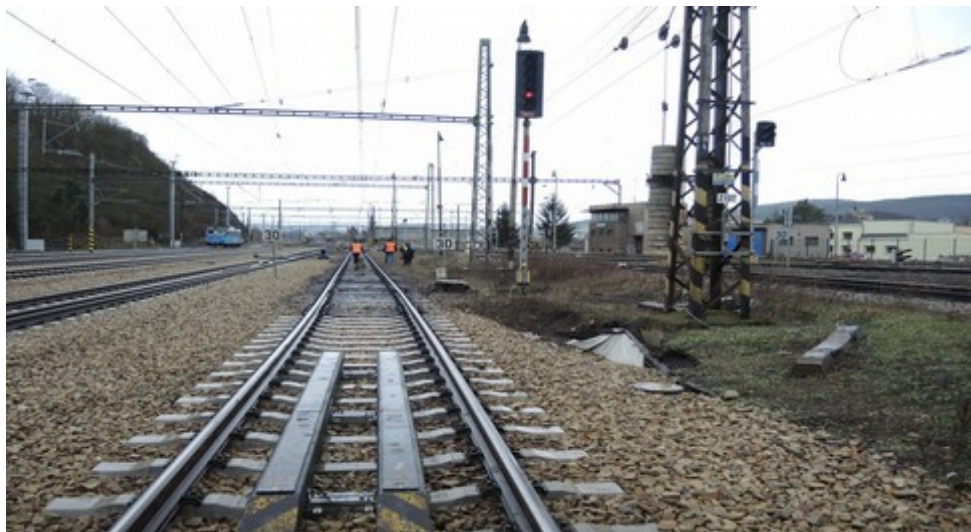
Obr. č. 1: Viditelnost cestového návěstidla Lc2a ze směru jízdy vlaku Služ 269294