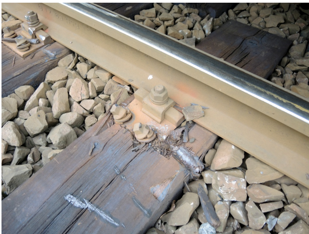
Obr. č. 5: Poškozený svršek v důsledku vykolejení vlaku