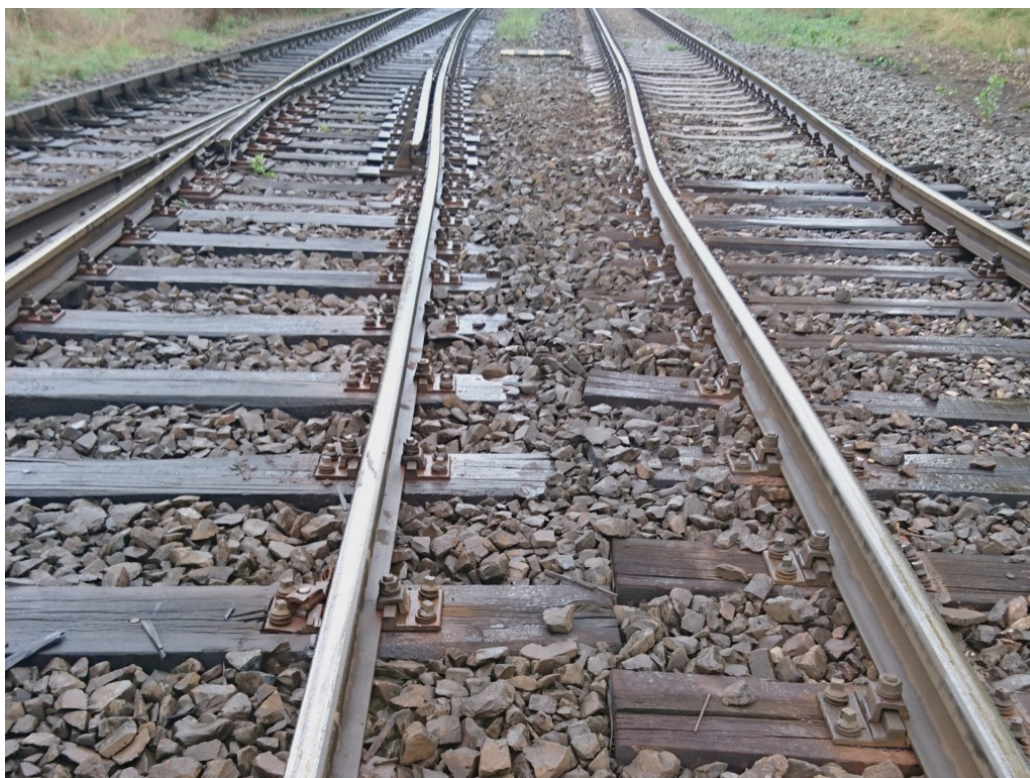
Obr. č. 6: Poškozený svršek v důsledku vykolejení vlaku