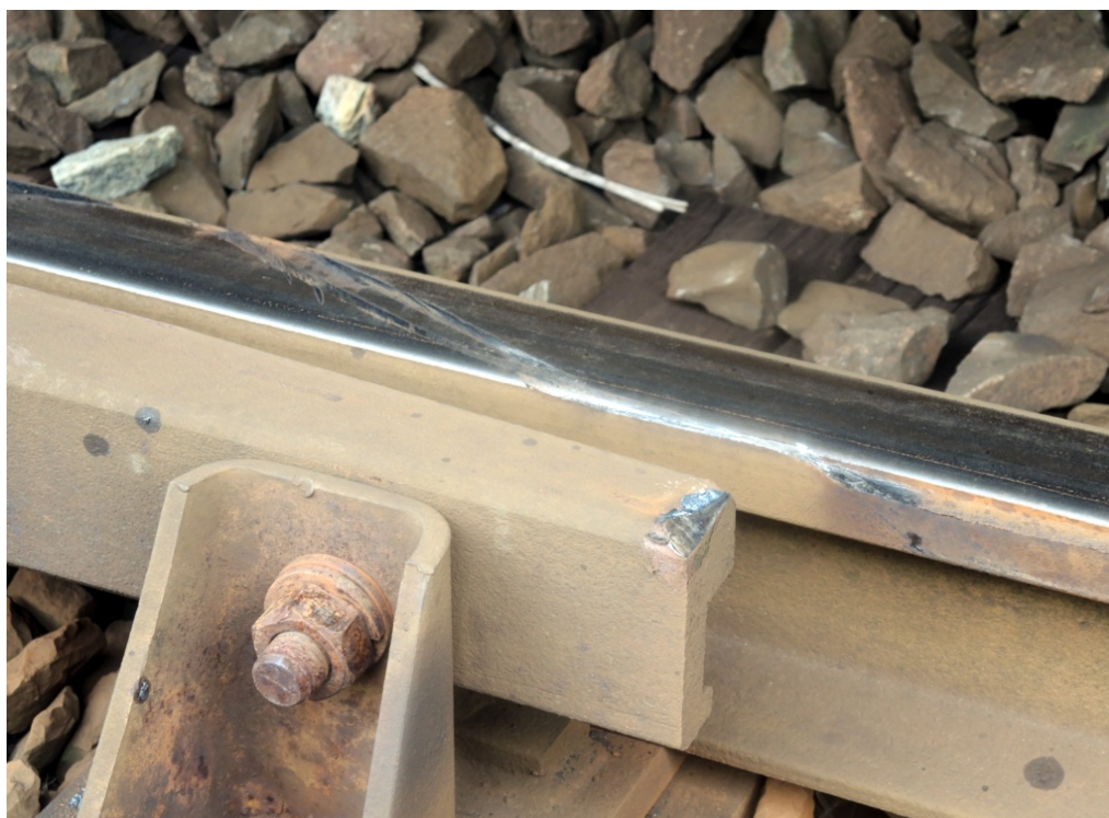
Obr. č. 4: Stopy po přestoupaní DV přes temeno kolejnice