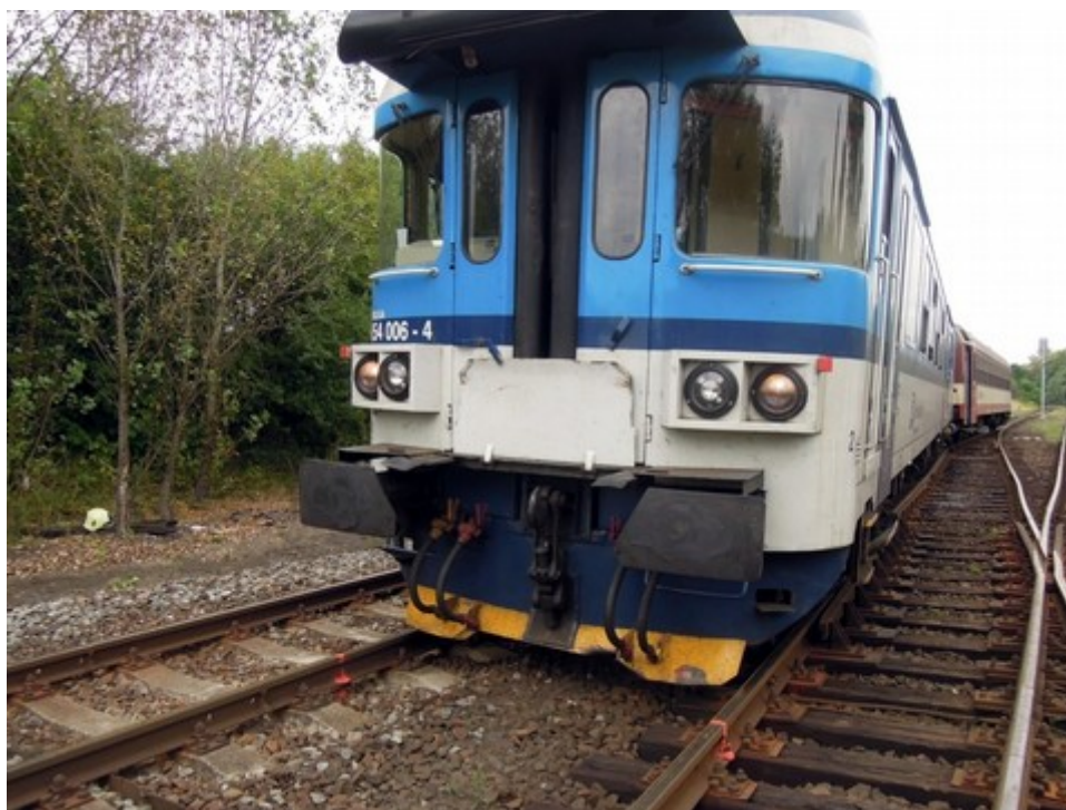
Obr. č. 1: Pohled na čelo vlaku po vzniku MU