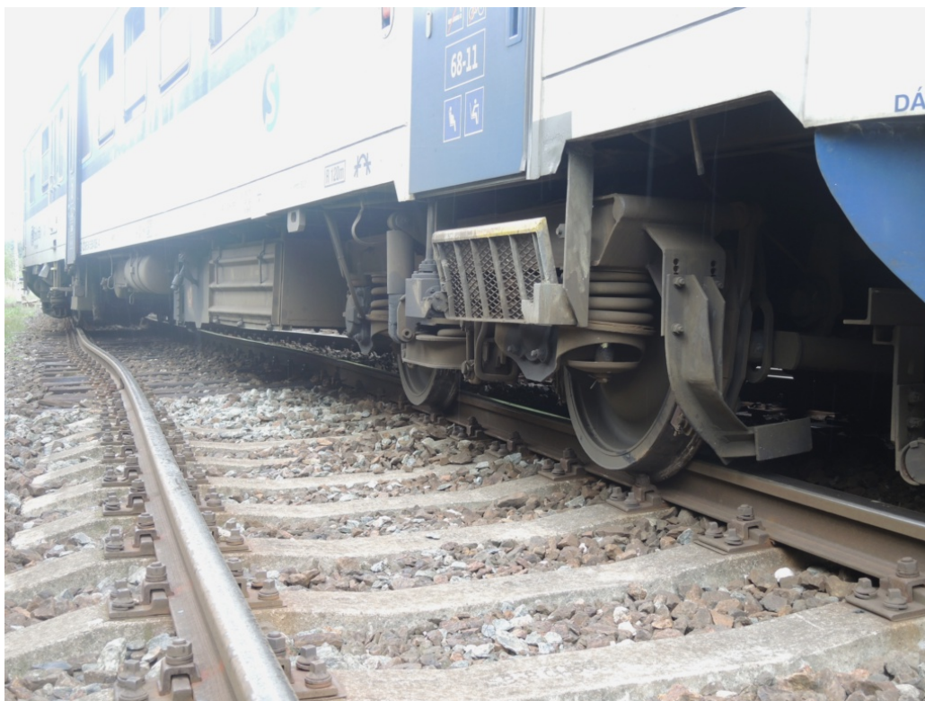
Obr. č. 3: Detail vykolejeného podvozku vlaku