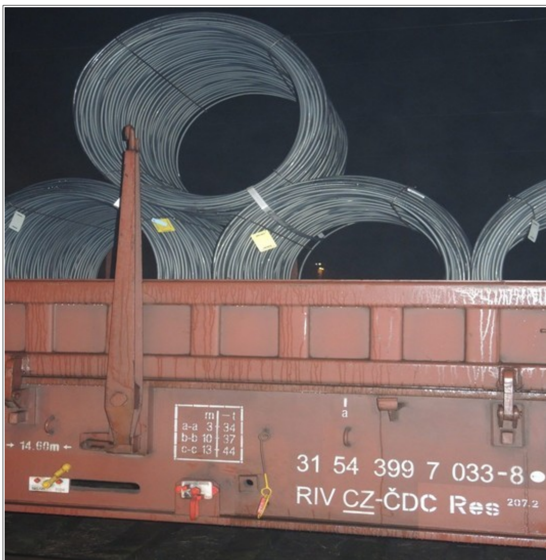
Obr. č. 6: Pohled na svitek válcovaného drátu ložený sedlaně, který neplní funkci závěru vrstvy, uložený na TDV 31 54 3997 033-8