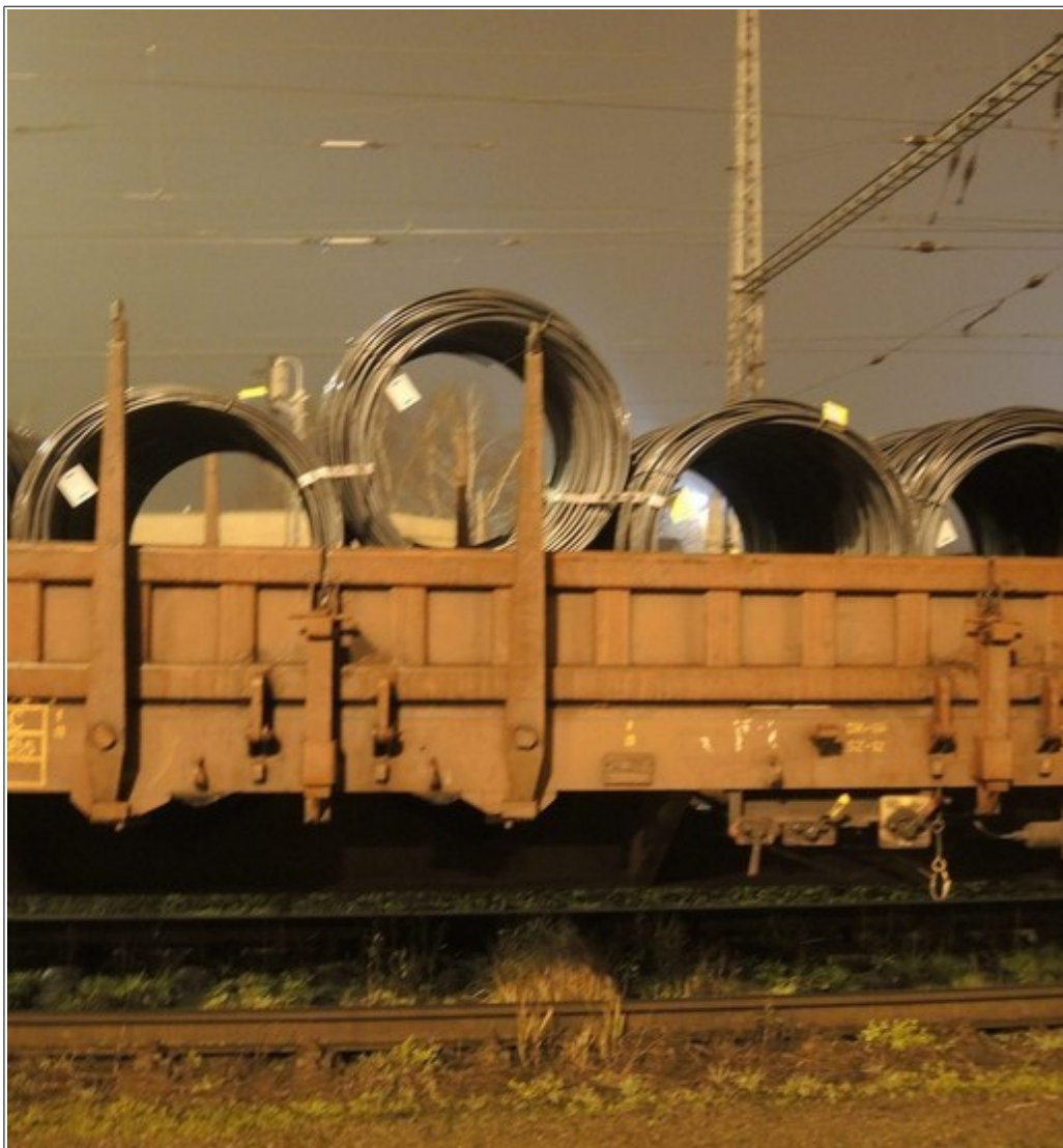
Obr. č. 5: Pohled na svitek válcovaného drátu ložený sedlaně, plnící funkci závěru vrstvy, uložený na TDV 31 54 3938 350-8