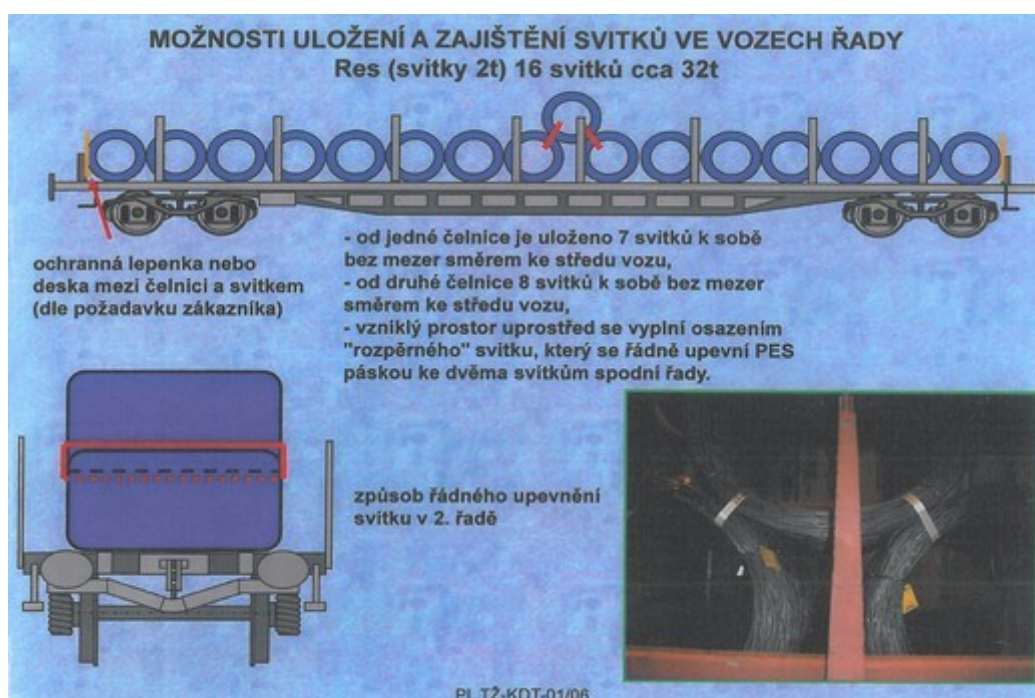
Obr. č. 4: Příklad nakládání PL-TŽ-KDT-01/06

(platnost)“. Podle tohoto postupu zboží (náklad) nevyhovující zásadám obsaženým ve Svazku 1 Nakládací směrnice UIC se považuje (podle číslice 7) za mimořádnou zásilku, pokud nejsou dovoleny odchylky na základě sjednané dohody o provozně bezpečném naložení nebo použitého příkladu nakládání , přičemž Nakládací směrnice UIC, ani jiný právní předpis ani předpis dopravce TŽ, a. s., způsob uzavření této dohody mezi dopravci, tj. dopravci TŽ, a. s., a ČDC, a. s., neupravují. Podle části „K číslici 1.2 (členění): Příklady nakládání“ pro zboží, jehož způsob uložení a zajištění nejsou upraveny žádnou Nakládací směrnicí ani příkladem nakládání, se vždy použijí příslušné zásady svazku 1 Nakládacích směrnic UIC. Přepravce (dopravce), který hodlá použít při naložení a zajištění vozové zásilky způsob uložení a zajištění zboží, který neodpovídá Nakládací směrnicí pro daný druh zboží dle Svazku 2 nebo zásadám uvedeným ve Svazku 1, požádá o povolení této přepravy specialistu dopravce ČDC, a. s., pro Nakládací směrnice. Tento specialista žádost posoudí z hlediska dodržení zásad Svazku 1 a zpracuje dohodu o provozně bezpečném naložení, případně rozhodne o potřebě provedení ověřovacích zkoušek.