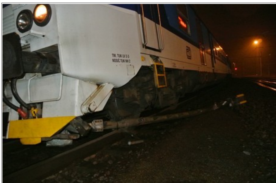
Obr. č. 1: Pohled na konečné postavení vlaku Os 3333 po srážce s hlavním (odjezdovým) návěstidlem L1 žst. Prosenice