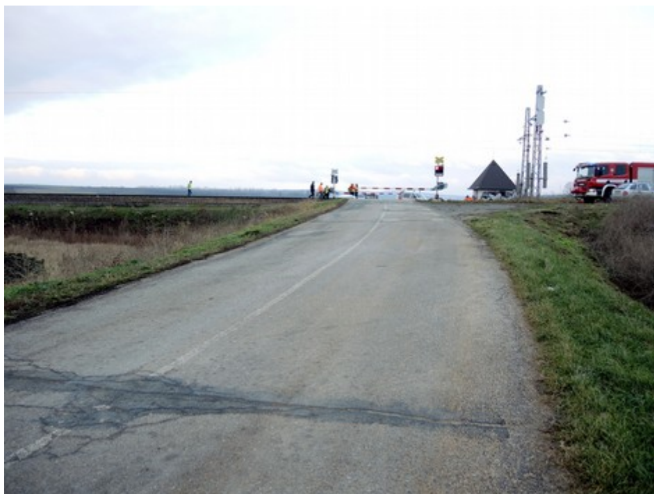
Obr. č. 1: Pohled na přejezd ze vzdálenosti Dz a směru jízdy OA