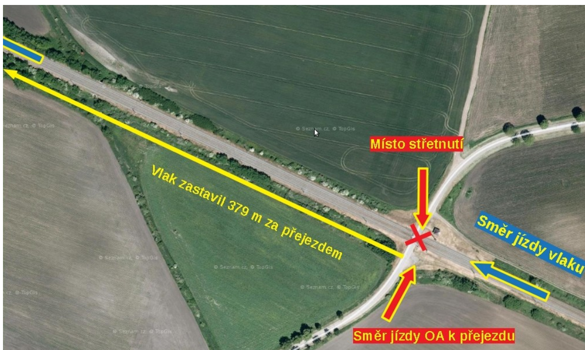
Obr. č. 2: Schéma místa vzniku MU

přejezdu a v průjezdném průřezu 2. TK zůstal stát. I přes okamžité zavedení rychločinného brzdění vlaku a dávání zvukové návěsti „Pozor“ lokomotivní houkačkou nedokázal strojvedoucí zabránit střetnutí s OA stojícím na přejezdu. Čelo HDV po nárazu odhodilo OA do prostoru sousední 1. TK a ten byl srážkou s čelem HDV a smýkáním prostorem železničního svršku roztrhán na kusy a úplně zdemolován. Následkem výše popsaných skutečností došlo k úmrtí řidičky OA, ke zranění zaměstnanců dopravce nedošlo. V prvním DV ve směru jízdy vlaku došlo k lehkému zranění jedné cestující.