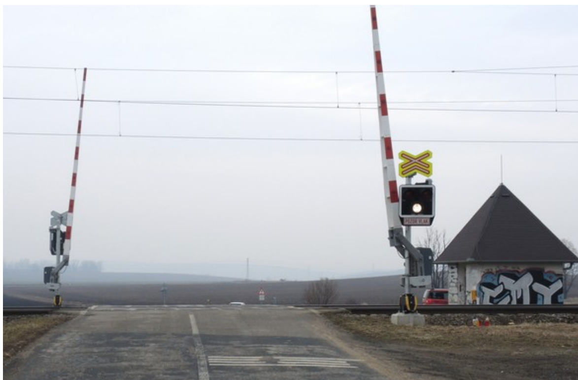
Obr. č. 4: Pohled na PZZ ve směru jízdy OA.