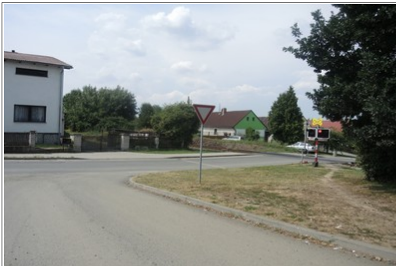
Obr. č. 3: Viditelnost výstražných křížů a výstrahy PZZ ve směru jízdy OA ze vzdálenosti 35 m