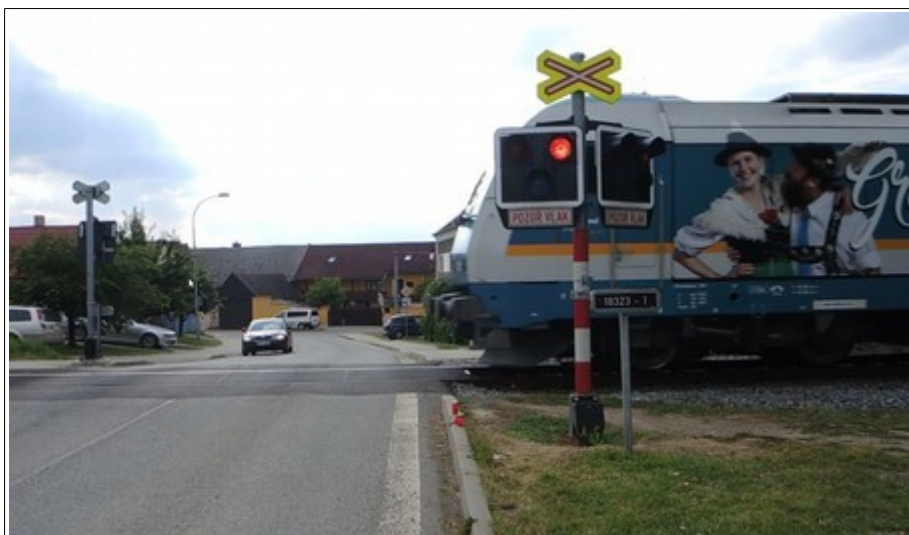
Obr. č. 6: Ověřování doby výstrahy (přibližovací doby) při jízdě vlaku Ex 352