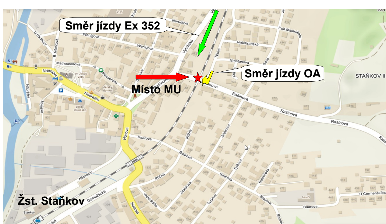
Obr. č. 2: Schéma místa vzniku MU