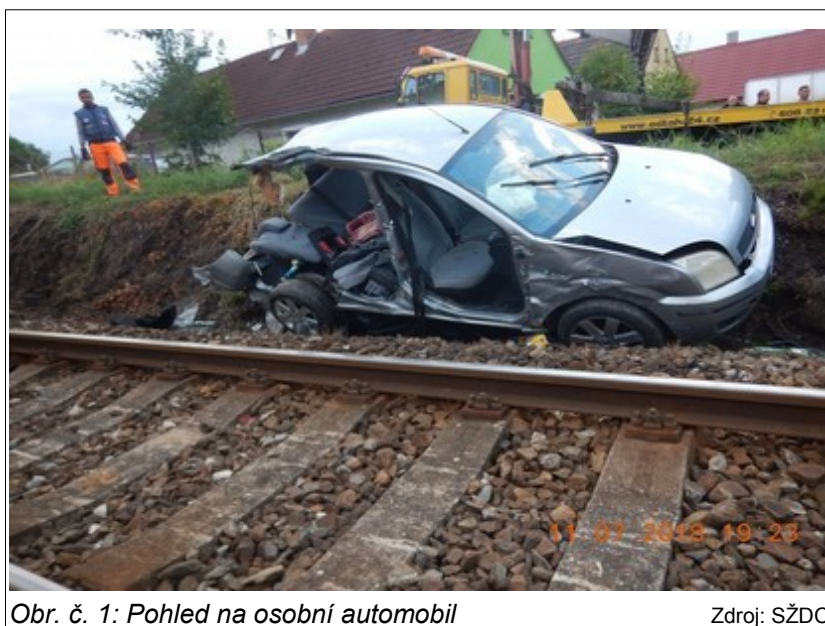
Obr. č. 1: Pohled na osobní automobil

GPS: 49°33'03.24152" N, 13°04'37.37328" E.