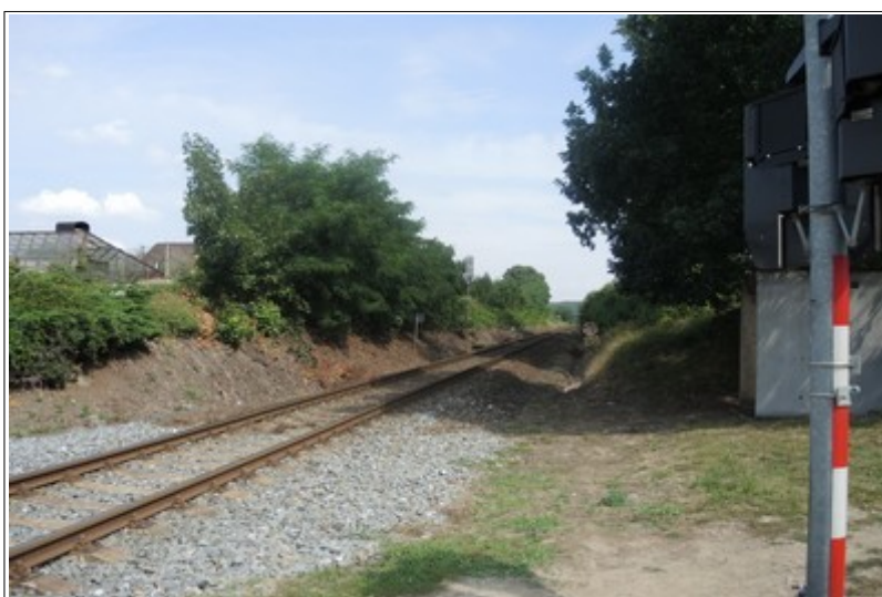
Obr. č. 4: Rozhledová délka ve směru jízdy OA a vlaku Ex 352