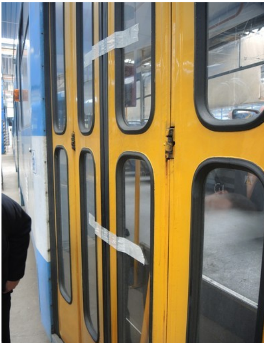
Obr. č. 4: Snímek dokumentující zapečetění dveří dopravním dispečerem DPO, a. s., po MU