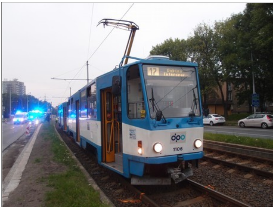
Obr. č. 1: Čelo TVL v konečném postavení po MU