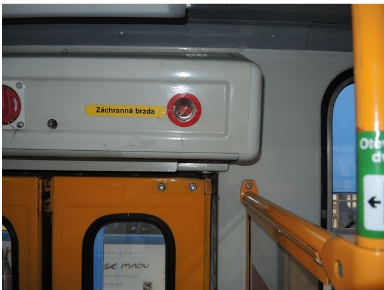
Obr. č. 5: Pohled na poškozenou folii spínače záchranné brzdy, který byl obsloužen cestujícím u prostředních dveří řízeného DV